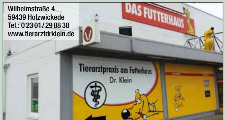
Freie Parkplätze gibt es direkt vor der Tierarztpraxis am Futterhaus.

Wilhelmstraße 4 59439 Holzwickede Tel.: 0 23 01 / 29 88 38 www.tierarzt-drklein.de