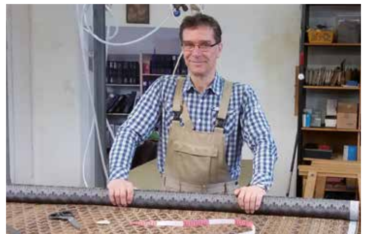
Hier legt der Fachmann noch selber Hand an.

Weitere Informationen gibt es im Netz unter: www.polsterei-muehlbauer.de