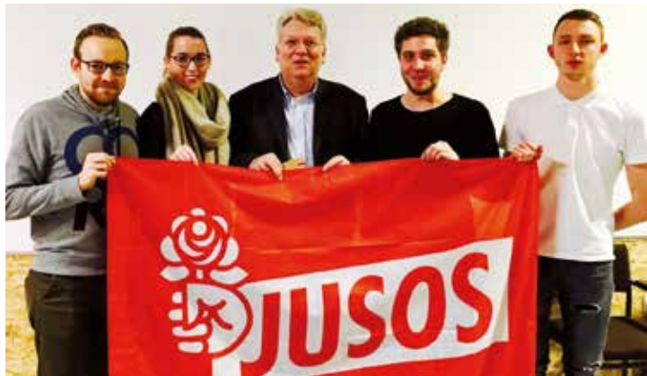
In Zukunft möchten die Jusos einen engen Kontakt zu ihrem Landtagsabgeordneten halten und ihn immer wieder für gemeinsame Diskussionen in die Emschergemeinde einladen.