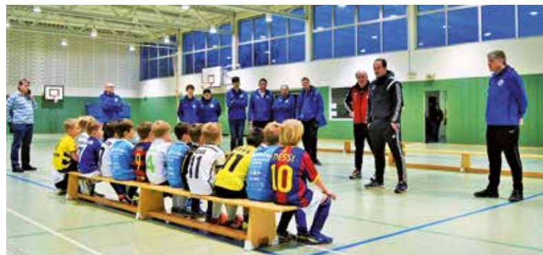
Gespannt folgten die F2-Junioren des HSC in der Dudenrothhalle den Ausführungen der Trainer beim Besuch des DFB-Mobils in Holzwickede.

Mit dem Mobil komplettiert der DFB sein Informations- und Service-Angebot für seine Klubs. Unterstützung für Trainer aller Altersklassen gibt es zudem unter der Rubrik „Training & Service“ auf FUSSBALL.DE, der digitalen Heimat des Amateurfußballs und durch kostenlose Kurzschulungen vor Ort.