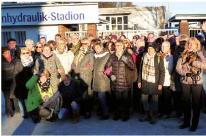
Gut gelaunt machte sich die HSC-Wandergruppe vom Montanhydraulik-Stadion aus auf den Weg zum Hof Riedel auf dem Haarstrang in Hengsen.