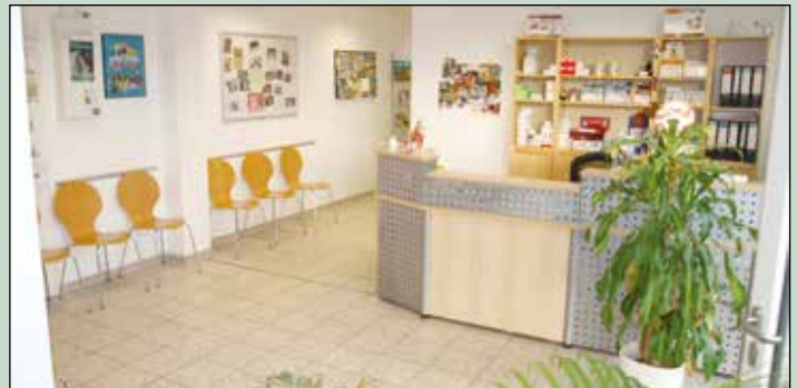
Nach der Anmeldung warten die tierischen Patienten auf ihre Untersuchung und Behandlung.