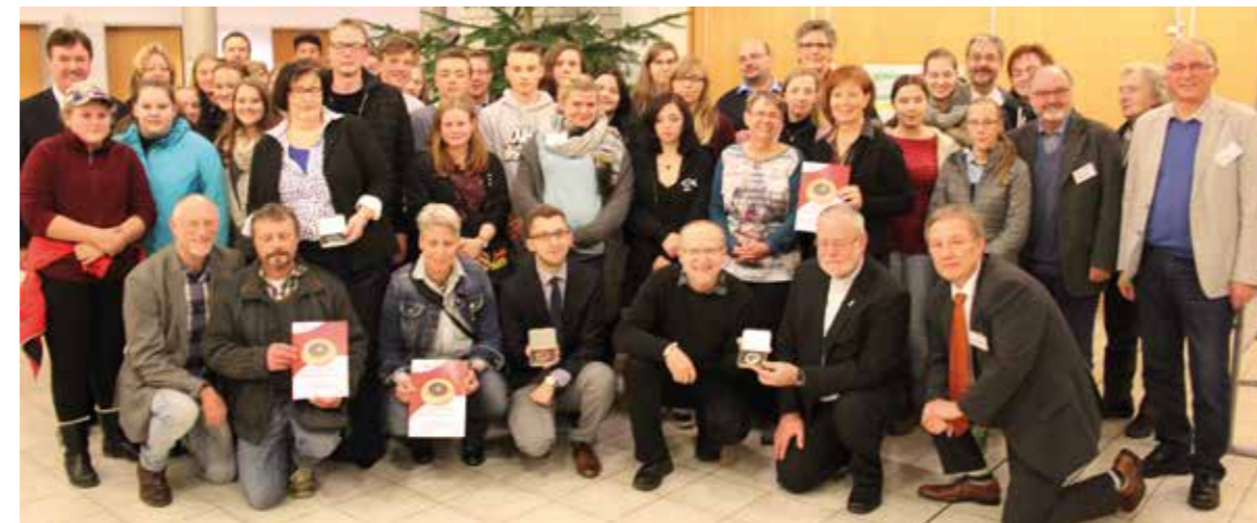
Die Preisträger und alle Teilnehmer des Wettbewerbes bei der Siegerehrung.

Die evangelische Dudenrorthschule in Holzwickede hatte eine Woche lang die Refor-