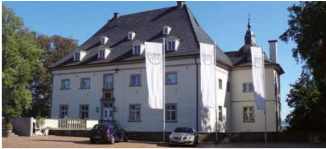
Jetzt noch besser an den öffentlichen Nahverkehr angebunden: Haus Opherdicke.

ckede und Massen mit Unna verbindet, bringt auf Bestellung nun auch abends Passagiere von A nach B. Der T51 fährt montags bis freitags von 20.12 Uhr bis 23.12 Uhr im Stundentakt, am Wochenende bis 20 Uhr. Ideal für Ausflügler, die so lange wie möglich