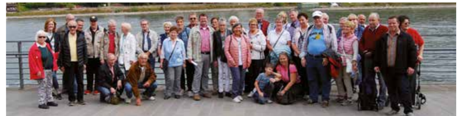
Die Holzwickeder Ausflügler am Rheinufer vor Abfahrt des Schiffes.

Für die 20. Bürgerfahrt der CDU, die im nächsten Jahr angeboten werden soll, verspricht CDU-Vorsitzender Frank Lausmann bereits heute ein attraktives Ausflugsziel.