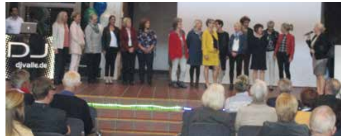
Der HSC-Gesundheitssport ehrte langjährige und verdiente Übungsleiterinnen.