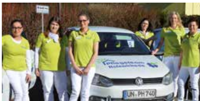
Das junge, dynamische Team aus motivierten Mitarbeiterinnen und Azubis freut sich auf weitere Kolleginnen und Kollegen.

Dafür braucht es Unterstützung für Körper, Seele und Geist. Seit August 2017 ist das Pflege-Team Holzwickede in der Nordstraße 12, in den ehemaligen Räumlichkeiten der Sparkasse, ansässig. Von hier aus startet das mobile Team in frischem Grün zu den Kunden in einem Umkreis von bis zu 15 Kilometern. Neben der Grund- und Behandlungspflege umfasst das Leistungsspektrum die medizinische Versorgung und die praktische Unterstützung im Haushalt, bei Arztbesuchen oder beim Einkaufen. Natürlich sind während der Bürozeiten jederzeit Besucher willkommen, die Beratung und Aufklärung in Sachen Pflegeversicherung und Pflegebedarf wünschen. Gerne berät Sie das Pflege-Team Holzwickede auch bei Ihnen zu Hause. Auch die Vermittlung von Hausnotrufsystemen, einem Friseur, Physiotherapeuten oder Podologen übernimmt das Pflege-Team Holzwickede gern für seine Kunden. Denn: Es geht um mehr als Pflege.