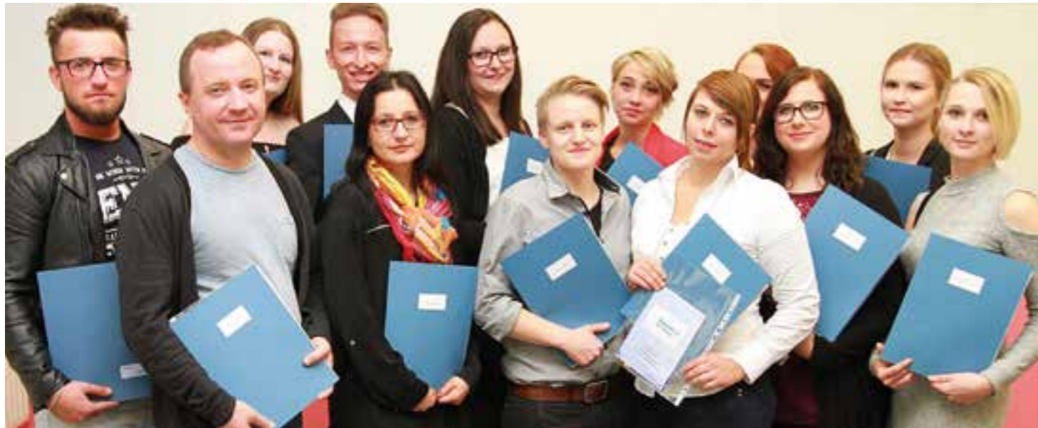
Strahlende Gesichter: Diese Frauen und Männer haben die Altenpflegeausbildung bei der Diakonie erfolgreich bestanden.

Weitere Informationen über das Ausbildungsangebot der Altenpflegeschule gibt es unter Telefon 02301/297874 oder 02301/912418-0 bzw. auf der Internet-Seite: www.diakonie-ruhr-hellweg.de.