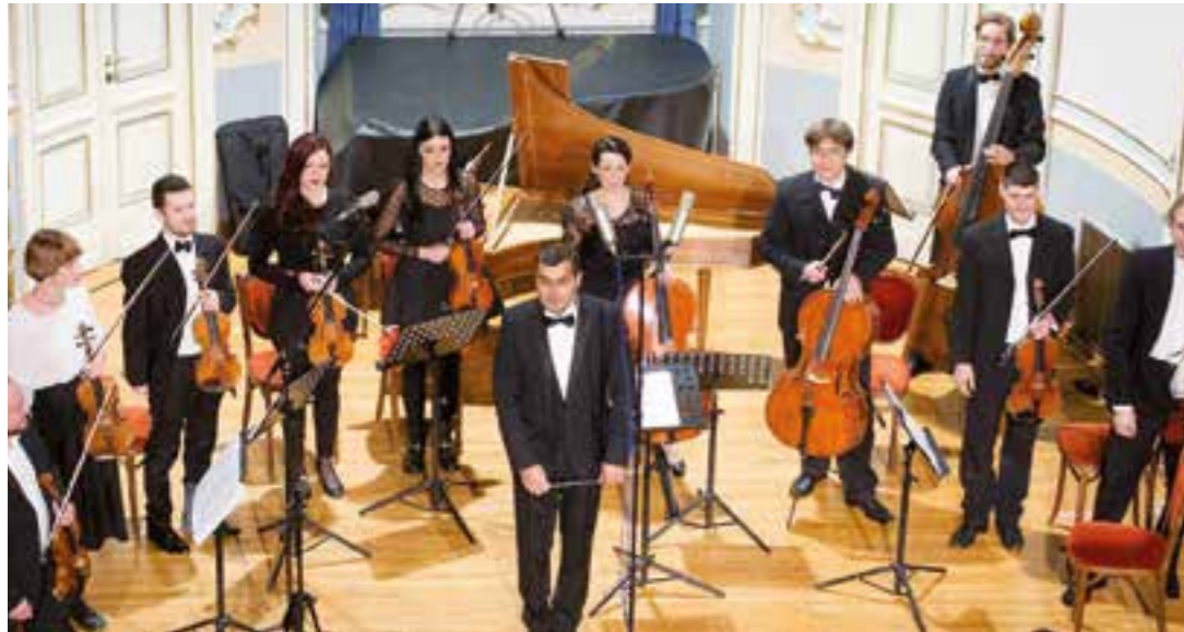
Virtuosen von Split.

Der Celloherbst am Hellweg geht in eine neue Runde. 2018 heißt das Motto „Klangreise durch Europa“.