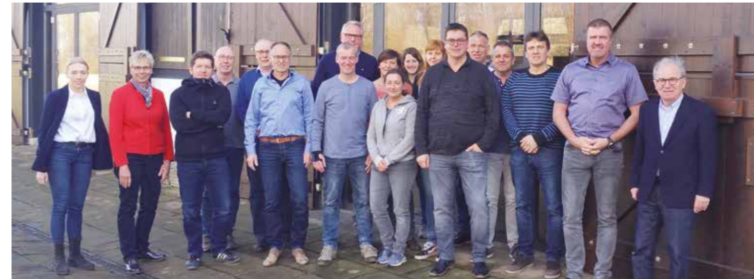
Auf dem Bild (links und rechts) Mitarbeiter Institut IPOS, dazwischen Führungskräfte der Gemeindeverwaltung.

Anfang März haben Fachbereichsleitungen, Stellvertreter und Verwaltungsvorstand an einer Fortbildung auf dem Em-scherquellhof teilgenommen.