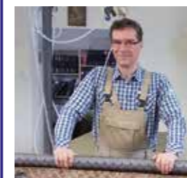
Hier legt der Fachmann noch selber Hand an.

Haben Sie einen alten Sessel, der optisch altersbedingt nicht mehr viel hermacht, aber so bequem ist, dass er noch lange nicht in den Müll gehört? Oder ein Erbstück, von dem Sie sich nicht trennen wollen?