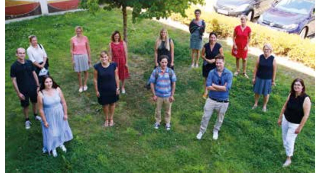
Die Verstärkung für die Grundschulen wurde im Schulamt für den Kreis Unna begrüßt.

Zwei von ihnen werden an Grundschulen in Bergkamen und Holzwickede arbeiten. Sechs weitere Lehrkräfte ergänzen die Vertretungsreserve beim Schulamt für den Kreis Unna. Vertreterinnen der Schulaufsicht für Grundschulen und des verwaltungsfachlichen Bereichs begrüßten die „Neuen“. Bevor es in die Klassenräume zum praktischen Unterricht geht, mussten die Pädagoginnen und Pädagogen erst einmal Papierkram erledigen. Schließlich gab es Urkunden bzw. Arbeitsverträge, eine Vereidigung, Informationsmaterial über Rechte und Pflichten sowie zu den richtigen Anlaufstellen bei Fragen und Sorgen. Natürlich durften auch Informationen über den