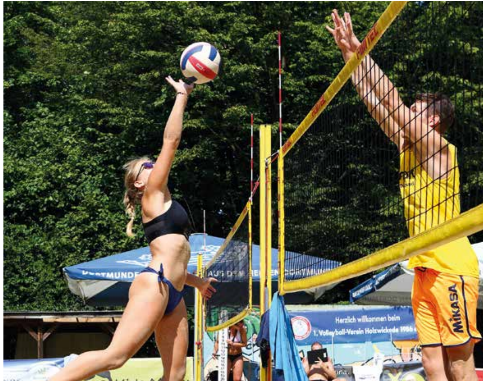
Abwechslungsreiche Netzaktionen und fliegende Körper gab es bei der Westdeutschen Kronen Mixed Meisterschaft in Holzwickede zu sehen.