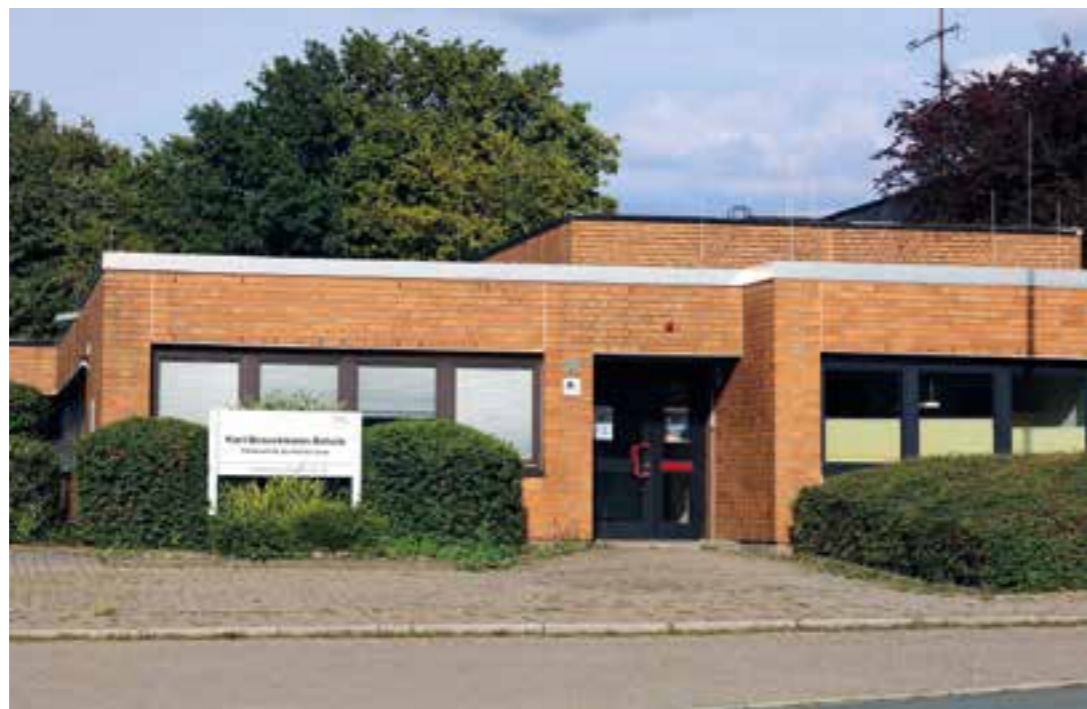
Karl-Brauckmann-Schule in Holzwickede.

Mehr Platz und neue bzw. runderneuerte Gebäude für alle, die an den kreiseigenen Schulen mit dem Förderschwerpunkt Geistige Entwicklung lernen und arbeiten: Es ist ein wegweisender Beschluss, den die Kreispolitik in der Sitzung am 23. Juni fasste. Anstelle der bisher beiden Förderschulen in Holzwickede (Karl-Brauckmann-Schule) und Bergkamen (Friedrich-von-Bodelschwingh-Schule) wird es künftig drei Schulen mit jeweils eigener Schulleitung geben. Die Karl-Brauckmann-Schule und die Friedrich-von-Bodelschwingh-Schule werden erhalten bleiben, für die dritte Schule wird nun ein Standort gesucht. Dafür muss in Abstimmung mit der Schulaufsicht bei der Bezirksregierung Arnsberg nicht