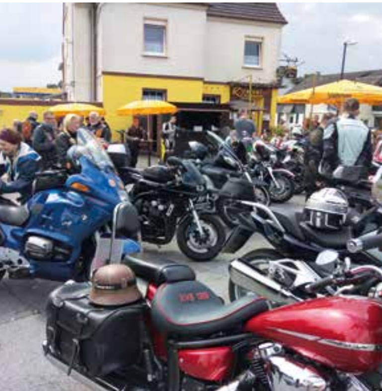
Treffen der Biker am Kreiseleck in Hengsen. Anschließend begleiteten sie Familie Raupach auf den ersten Kilometern ihrer Fahrt zur Nordsee.