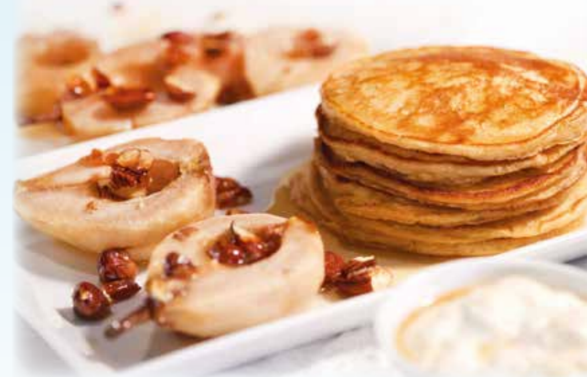
Joghurt-Pancakes mit gebackenen Birnen, Nüssen und Mandeln: Der cremige Joghurt nach griechischer Art macht die Pancakes schön locker.

Eine besonders cremige Struktur und ein angenehm säuerlicher Geschmack: Beides ist für einen Joghurt griechischer Art wie Apostels jogurti charakteristisch und schmeckt pur ebenso gut wie mit Honig auf dem Brot, zum Müsli oder als Dessert mit frischem Obst. Hobbyköche verwenden ihn gerne zum Verfeinern von Soßen, Salat-Dressings oder einem Dip. Beim Backen von Kuchen und Co. sorgt der cremige Joghurt mit leicht säuerlicher Note für mehr Lockerheit und Voll-