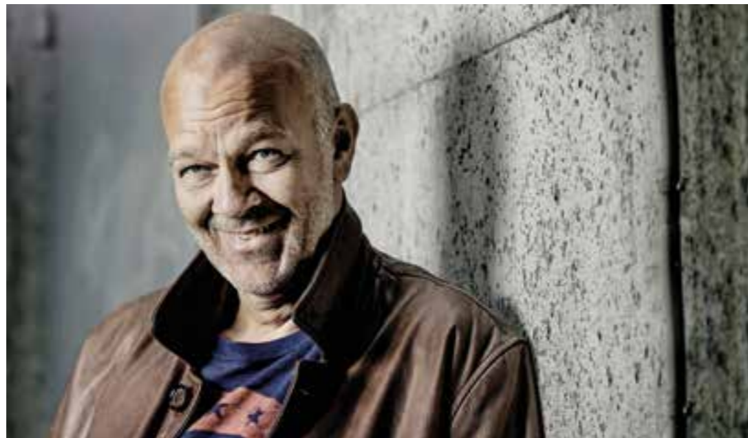
Einer der Krimiautoren, die 2021 in Unna lesen: Jens Henrik Jensen.

Bereits für das kommende Jahr terminiert sind die Lesungen von Elisabeth Herrmann, Jussi Adler-Olsen, Romy Hausmann, Denise Mina, Håkan Nesser, Joe Bausch, Doris Gercke, Dora Heldt, Simon Beckett,