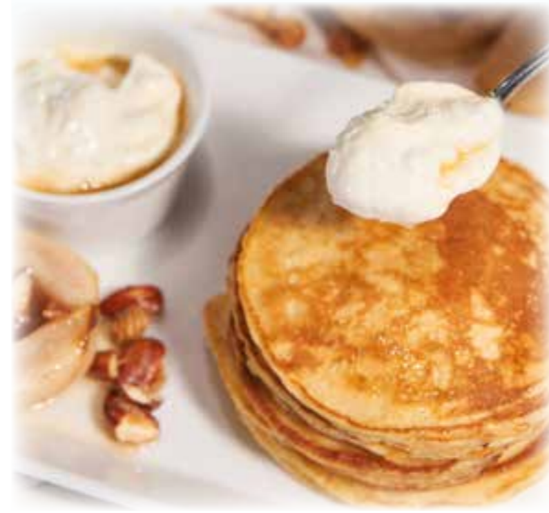
Weckt sonnige Urlaubsgefühle: Pancakes mit Joghurt können nach traditioneller griechischer Rezeptur zubereitet werden.