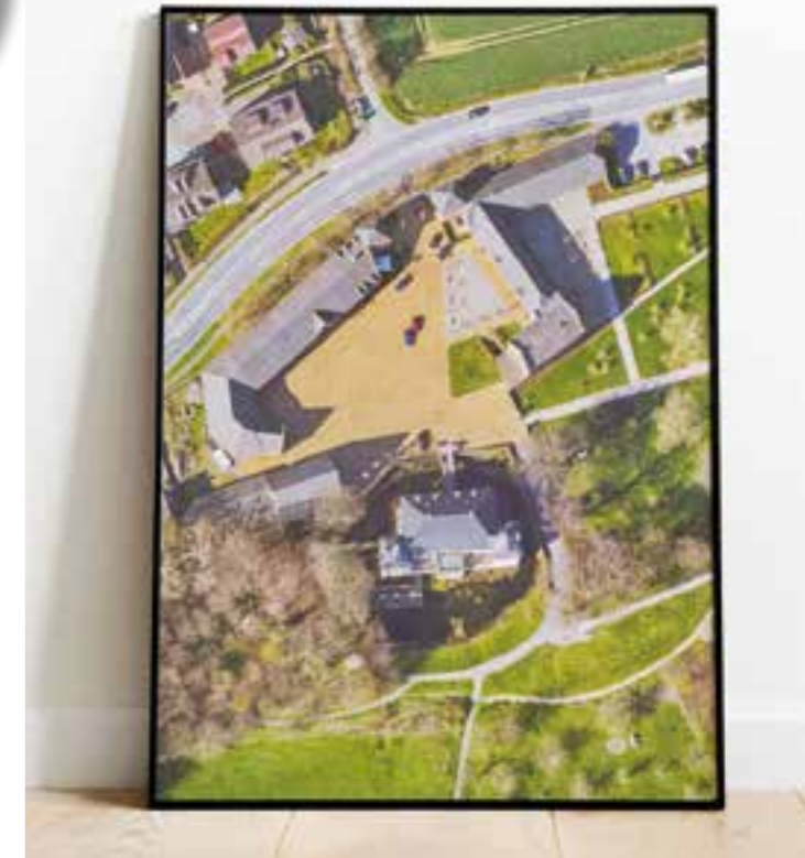
Wer als Lieblingsort im Kreis Unna Haus Opherdicke hat – für den würde sich dieses Bild anbieten.

Hochauflösend – beste Qualität Möglich sind Größen bis DIN-A1, also rund 60 mal 84 Zentimeter. Gedruckt werden kann es wahlweise auf mattem oder glänzendem Papier in entsprechender Stärke. Die Kosten für einen Ausdruck bis einschließlich Größe DIN-A1 liegen bei 30 Euro. Wie schön die Bilder von oben aussehen, davon kann sich jeder selbst überzeugen. Unter http://kreis-unna.virtualcitymap.de sind die Luftbilder über eine interaktive Karte einzusehen. Wer Fragen hat, ein Bild bestellen möchte oder einen bestimmten Ort