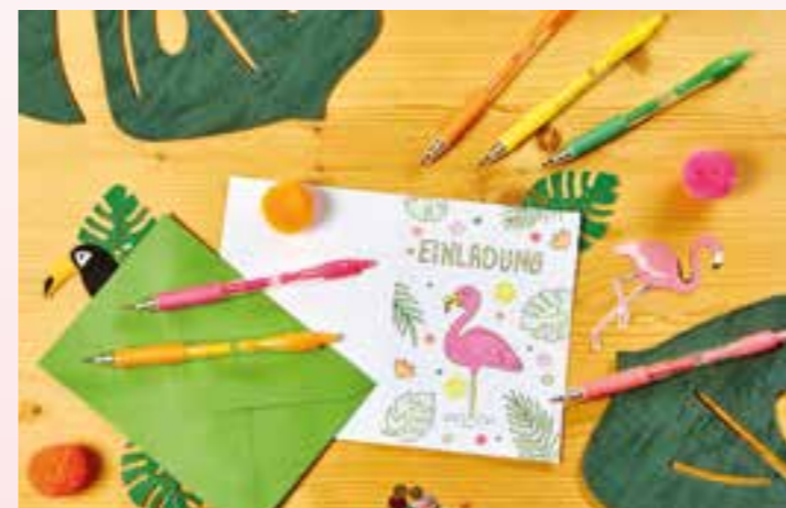
Ein pinker Flamingo inmitten exotischer Blätter und Blüten - fertig ist die fröhlich-bunte Einladungskarte für die nächste Geburtstags-, Sommer- oder Gartenparty.

Wer die Karten noch kreativer verzieren möchte, setzt schimmernde Highlights mit kleinen Pailletten und anderen Deko-Elementen, die mit Flüssigkleber auf die Karten befestigt werden. (djd).