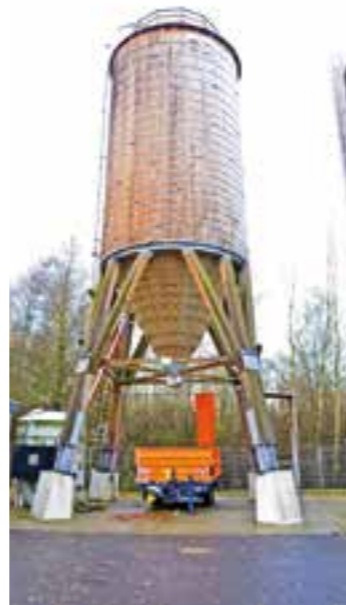
Die Salzlager sind gefüllt: In diesem Silo lagern 250 Tonnen. Insgesamt werden am Kreis-Bauhof in beiden Silos 500 Tonnen bereitgehalten und bei Bedarf auf die Fahrzeuge verteilt.

„Wir wissen aber natürlich, wie gefährlich glatte Straßen sind, und sind im Regelfall zwischen