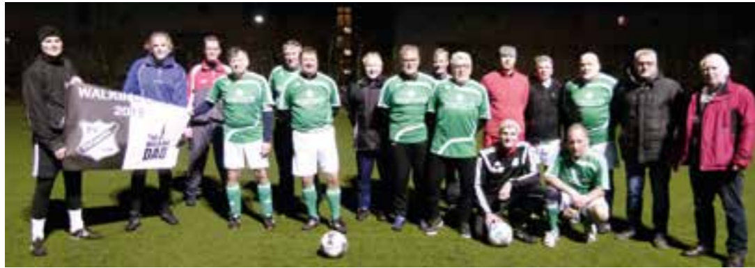
Die Walking-Fußball-Mannschaften des Holzwickeder SC und des SV Frömern traten Ende Januar zu einem Spiel im Holzwickeder Montanhydraulik-Stadion an.

Mehr als nur „mit dem Ball Spazierengehen“: Großer Zulauf gibt es aktuell beim Walking-Fußball.