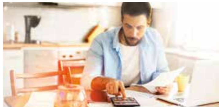
Endlich mehr Transparenz beim Geld: Der Haushaltskalender hilft bei der privaten Buchführung.

Für mehr Durchblick in Sachen Finanzen kann beispielsweise die Broschüre „Mein Haushaltskalender 2022“ des Beratungsdienstes Geld und Haushalt sorgen. Durch die Kombination aus Terminplaner und Haus-