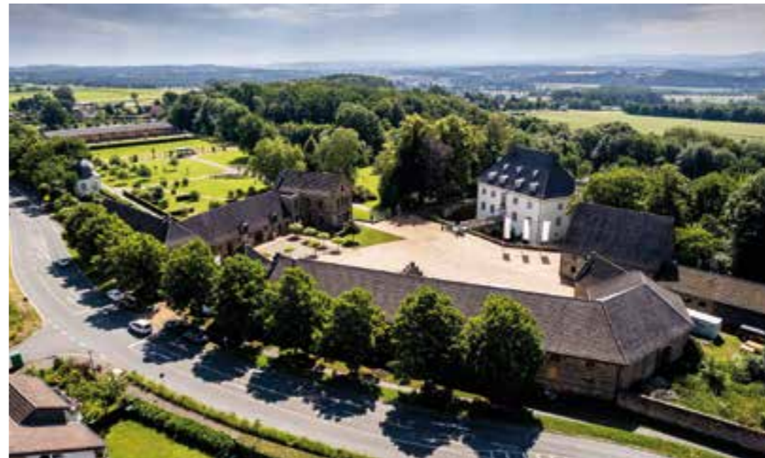
Museum Haus Opherdicke.