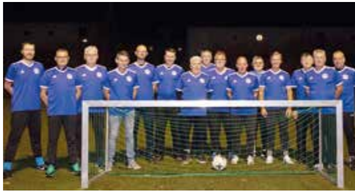
Jeden Montagabend trainieren die Walking-Fußballer des Holzwickeder SC von 19:00 bis 20:00 Uhr auf dem kleinen Kunstrasenplatz des Montanhydraulik-Stadions.

Ins Deutsche übersetzt bedeutet Walking Football nichts weiter als „Geh-Fußball“. Walking Football ist altersgerechtes und gesundheitsförderndes Fußballspielen. Erstmals wurde diese Fußball-Variante 2011 in Chesterfield/England gespielt und begeistert inzwischen das ganze Land. Fast 1.000 Mannschaften, einige auch