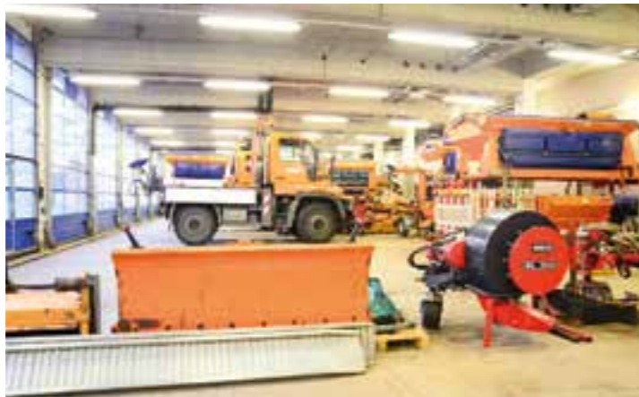
In der Garage des Kreis-Bauhofs stehen die Fahrzeuge, Salztanks und Schneeschieber bereit.

Für Minusgrade, Eis und Schnee sind die Mitarbeiter des Kreis-Bauhofs gewappnet: Die beiden Silos sind mit insgesamt rund 500 Tonnen Salz gut gefüllt.