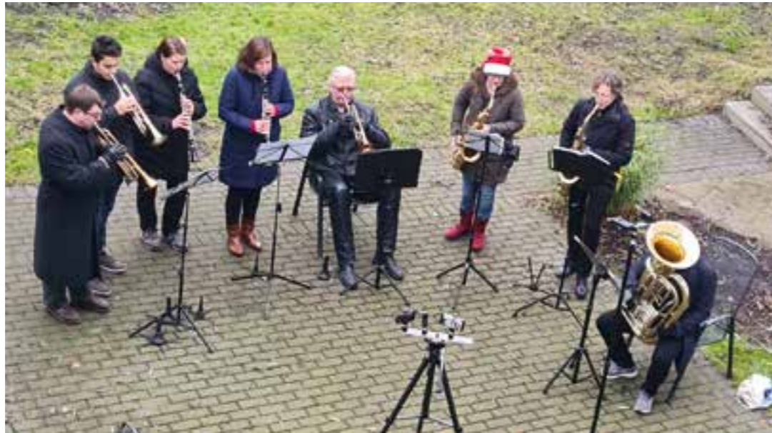
Mitglieder des Sinfonischen Blasorchesters DO-Ton bei einem Hofkonzert.