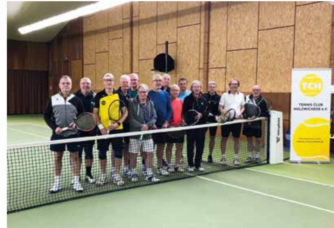
Lust auf Tennis auch im neuen Jahr - die Teilnehmer des Neujahrturniers in der TCH-Halle am Haarstrang.

Der Tennisclub Holzwickede ist mit einem Herren-Doppelturnier unter Beachtung der Corona-2G plus-Regel ins neue Jahr gestartet.