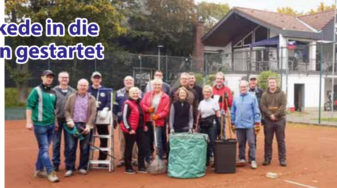
Offensichtlich gut gelaunt und kräftig zugepackt haben die TCH-Mitglieder, um die Außenanlagen winterfest zu machen.

Insgesamt über 30 fleißige Helferinnen und Helfer des TC-Holzwickede haben die Außenanlage mit acht Tennisplätzen auf dem Haarstrang winterfest gemacht.