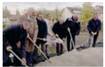
Im Oktober 2019 erfolgte der Spatenstich.

Wer sich mehr für die Details und Highlights des neuen Gebäudes interessiert, der kann an einer der