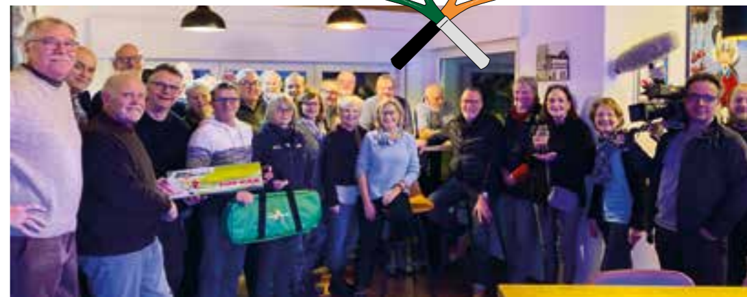
Vorfreude bei den Teilnehmern des Tipp-Kick Turniers (rechts im Bild das Kabel 1-Kamerateam).

Ballbehandlung mal anders lautete das Motto in der Vereinsgaststätte „Ben's kitchen“ Mitte Januar beim Tipp-Kickturnier des Tennisclub Holzwickede.