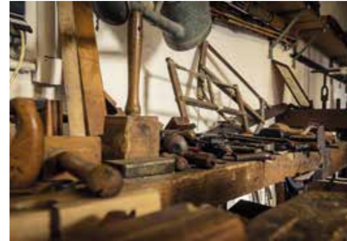
Tischlerwerkzeuge in der Heimatstube.

Am ersten Sonntag im März beginnt seit einigen Jahren die Saison für die Heimatstube.