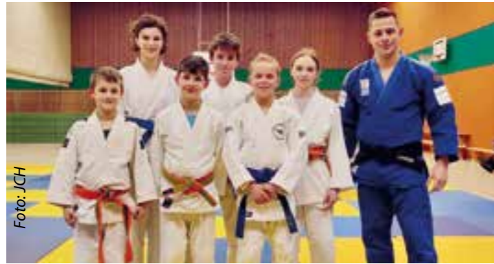
Foto: JCH Lilly Scharf und Fabian Langer. Bei diesem Wettbewerb müssen die Athleten/-innen ihr Können be-

In Witten fand am Landeistungszentrum der alljährliche Vielseitigkeitswettbewerb der weiblichen und männlichen Jugend U15 statt.