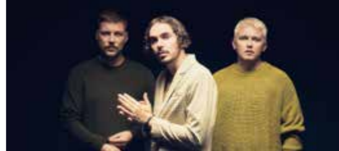
Die Chartstürmer CLOCKCLOCK kommen am 5. August zur Sommerbühne auf Haus Opherdicke.