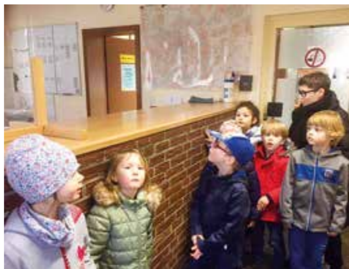
Kleine ganz Groß – Der Diebstahl des Nashorns wurde eigens auf der Polizeiwache zur Anzeige gebracht.