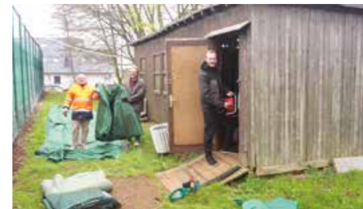
Viele Helferinnen und Helfer packten mit an, um die TCH-Anlage fit für die Freiluftsaison 2023 zu machen.

Mitte April folgten die letzten Ar- beiten, bevor die Außensaison für die Tennisbegeisterten am Haar- stang in Opherdicke begannen. Viele helfende Hände packten mit an, um Bänke, Windsegel, Netze, Abzieher, Besen und anderes für den Spielbetrieb notwendiges Gerät auf die Anlage zu bringen.