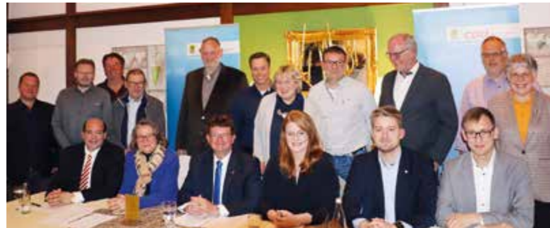
Das Bild zeigt den neuen Vorstand mit den Vereinigungsvorsitzenden und Ministerin Ina Scharrenbach (mit Schal).

Die Mitglieder des CDU Gemeindeverbandes Holzwickede trafen sich im April zur Jahreshauptversammlung in den Opherdicker Schloßstuben.