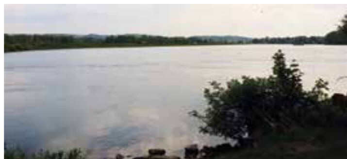
Das Bild zeigt von der neu aufgestellten Bank aus den herrlichen Ausblick auf den Ruhrstausee Hengsen.

Auf einer Wanderung am südlichsten Zipfel der Gemeinde Holzwickede fiel es der Frauen Union Holzwickede (FU) auf, dass es nicht an idyllischer Umgebung, sondern an Sitzgelegenheiten zum Verweilen mangelte.