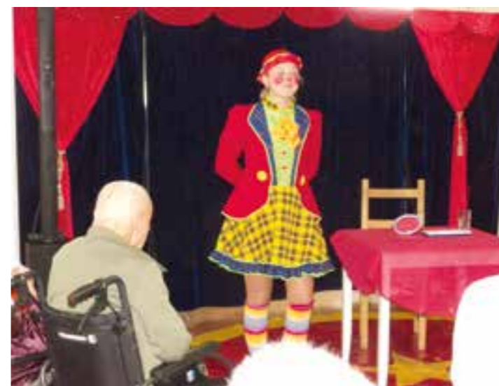
Der Zirkus Happy hat den Bewohnerinnen und Bewohnern des LWL-Pflegezentrums Dortmund viel Freude bereitet.