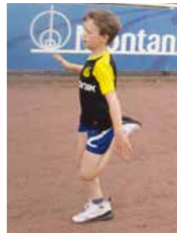
In Holzwickede hat die Sportabzeichen-Saison begonnen.

noch bekannt gegeben. Um die sportlichen Aktivitäten in Holzwickede zu unterstützen, übernimmt die Gemeindeverwaltung die Kosten für die Sportabzeichen. Die Teilnahme ist somit kostenlos möglich. Bei der ersten Teilnahme muss ein Personalausweis (Schü-