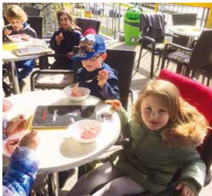
Zur Belohnung der guten Taten gab es Eis für alle Kindergartenkinder.