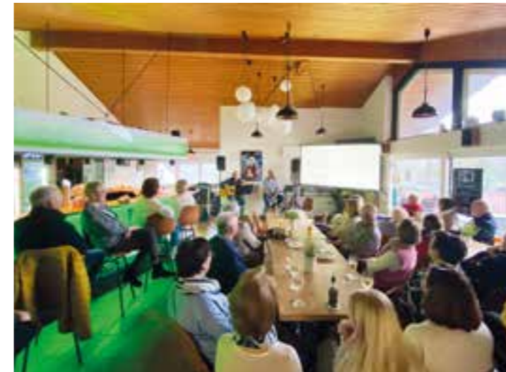
Volles Haus beim TCH-Liederabend „Sing mal mit“.

Tennisbegeisterte mit Talent zum Singen und zur Geselligkeit