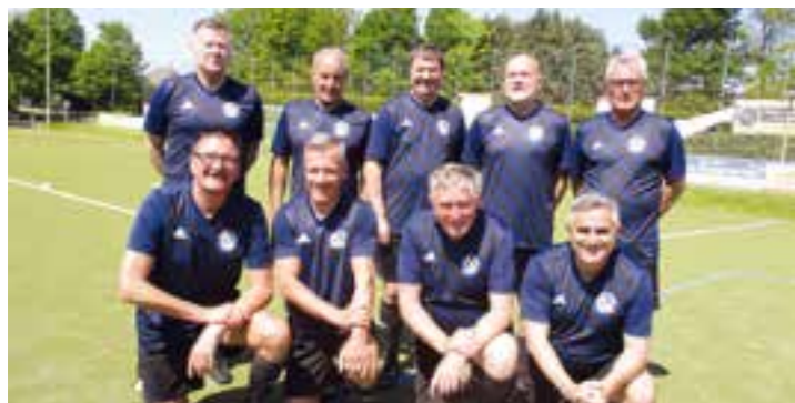
Immer montags von 19:00 bis 20:00 Uhr trainieren die Walking-Fußballer des Holzwickeder SC auf dem kleinen Kunstrasenplatz im Montanhydraulik-Stadion.

Mit „I'm walkin“ schuf Fats Domino 1957 einen echten Ohrwurm. 66 Jahre später ist der Song aktueller denn je – so beim 1. Walking Fußball-Turnier des Holzwickeder Sport Clubs am Himmelfahrtstag auf der Opherdicker Haarstrang-Sportanlage.