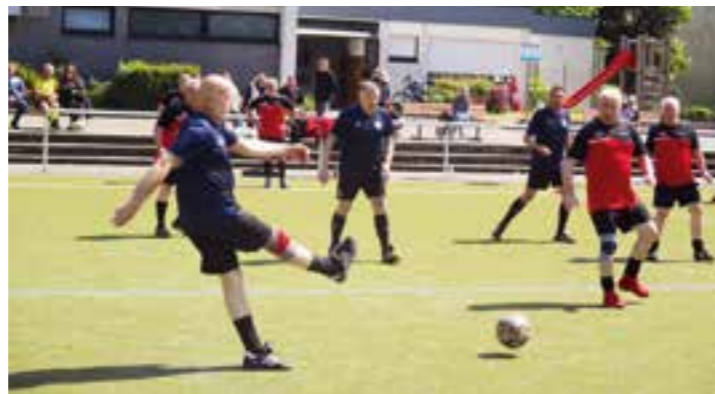
„Geh-Fußball“ ist gerade für ältere Spieler eine echte Alternative und Möglichkeit, weiterhin dem Kampf um das runde Leder zu fröhnen.