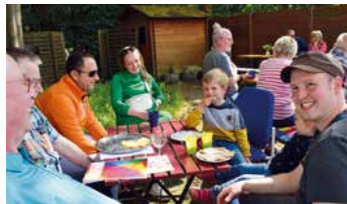
Zahlreiche Besucher kamen am Muttertag auf den Hof und in die Heimattube.