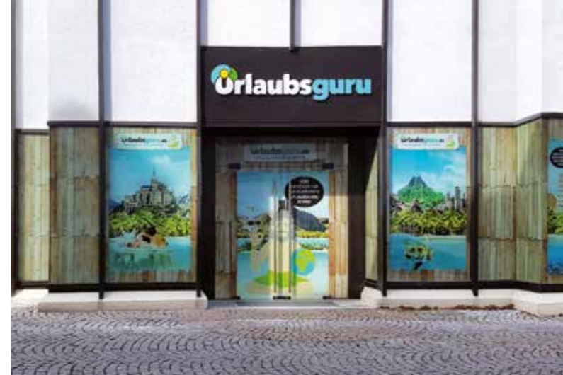
In der Hertingerstraße 7 eröffnet der erste Urlaubsguru Store in Unna

Wie kam die Idee, einen Store zu eröffnen? „In unserem Hauptquartier in Holzwickede haben wir etwa ein Jahr lang mit dem ‚Guru vor Ort‘ Erfahrungen gesammelt – wie das Konzept der persönlichen Beratung ankommt. Und das Ergebnis ist phantastisch: Teilweise kommen die Leute aus Köln und Düsseldorf zu uns, um sich den wirklich besten Urlaub suchen zu lassen!“ Aus Liebe zur Stadt geht Urlaubsguru nun dorthin, wo