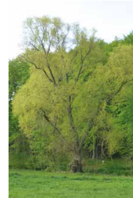
So könnte die Massener Bodensenke nach der Renaturierung aussehen.

durch Entsorgung und Ausbaggern des Abbruchmaterials wieder renaturiert werden. Eine Entsorgung wird teuer sein. „Und doch, da könnte man viel für die Natur, für die Spaziergänger und Liebhaber von offenen Wasserflächen tun“, meinen die Mitglieder des Arbeitskreises. „Ein Café am See“, das ist eine Vision des Moderators Helmut Tewes, wäre eine „Attraktion für Massen und den Umkreis“.