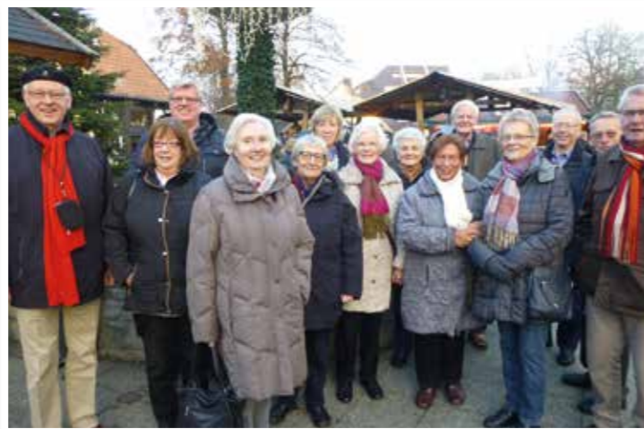
Auf Exkursion zur Weihnachtszeit in Bad Sassendorf.

tag bis Sonntag ein unvergessliches Wochenende in Osnabrück und in dem Osnabrücker Umland. Die Ausflugs- und Besichtigungsmöglichkeiten sind vielfältig. Die Varusschlacht in Kalkriese, die Fachwerkhäuser im Sole-Kurort Bad Essen, das Heilbad Bad-Rotherfelde, der Friedenssaal im Osnabrücker Rathaus, die Teilnahme an Gottesdiensten, urige Hausbrauereien sowie eine Shopping-Auszeit in der Altstadt sind Anlaufziele und stimmen ein auf herrliche, entspannende, gesellige und informierende Tage.