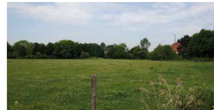
Blick auf das Gelände des früheren Freizeitbades: So manche Massenerin und so mancher Massener erinnern sich mit Freude an das kühle Nass.

Eine Massenerin brachte die Sache unmissverständlich auf den Punkt: „Da gehört wieder eine Badeanstalt hin.“ Es ist eher unwahrscheinlich, dass sich der Stadtrat dieser Meinung anschließen wird.