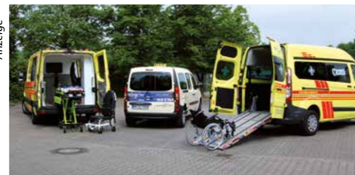
Das Hellweg-Taxi fährt durch den Kreis Unna.

Seit Mai 2015 gibt es die Hellweg-Ambulanz und seit Beginn dieses Jahres auch das Hellweg-Taxi. Familie Schröder aus Unna-Massen bietet Fahrten sämtlicher Art an.