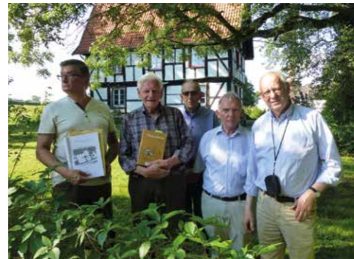
Mit der Karte und festen Schuhen auf der Suche nach einem Wanderweg in Massen.

Mitmachen ist angesagt. Der Arbeitskreis trifft sich einmal im Monat, Uhrzeit und Ort werden in der Presse bekanntgegeben.