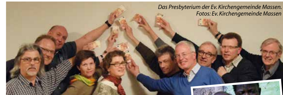
Das Presbyterium der Ev. Kirchengemeinde Massen.

Die 10 Presbyterinnen und Presbyter haben eine Idee zur Aktion gemacht: „10 für Afrika“. Wenn jeder Evangelische in Massen