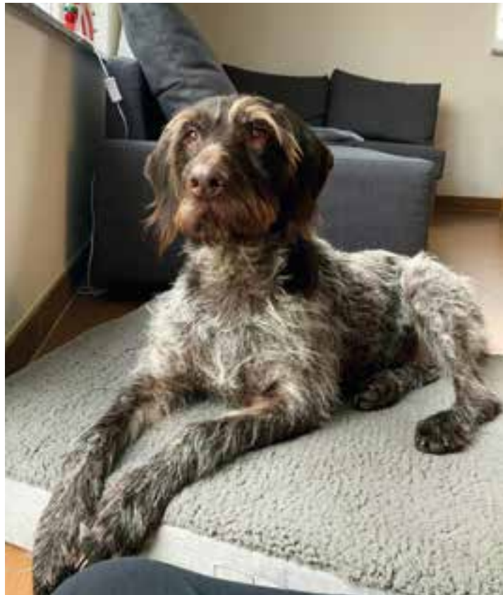
Biene, ehemalige Langzeitbewohnerin des Tierheims grüßt aus ihrem neuen Zuhause.

„Ich freue mich, dass ich so liebe Dosenöffner gefunden habe!“ – die Berichte der neuen Tierbesitzer sind nicht selten aus Sicht der Tiere geschrieben. So wie bei Katze Thalia, genannt Lia, die mit ihren zwei Jahren bereits einige Kinder auf die Welt gebracht hat und sich dann wieder von diesen trennen musste. Glücklicher-