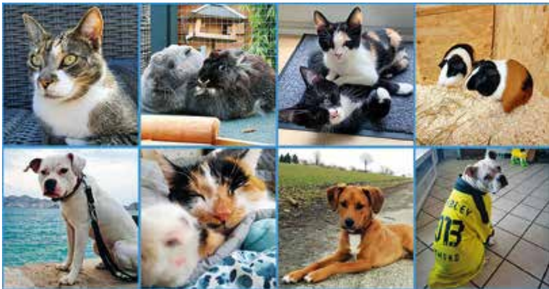
Vermittelte Tiere in ihrem neuen Zuhause.