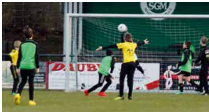
Trainingsneustart nach covid-19 am 11. März 2021.

Auf dem Massener Sportplatz wird wieder gekickt