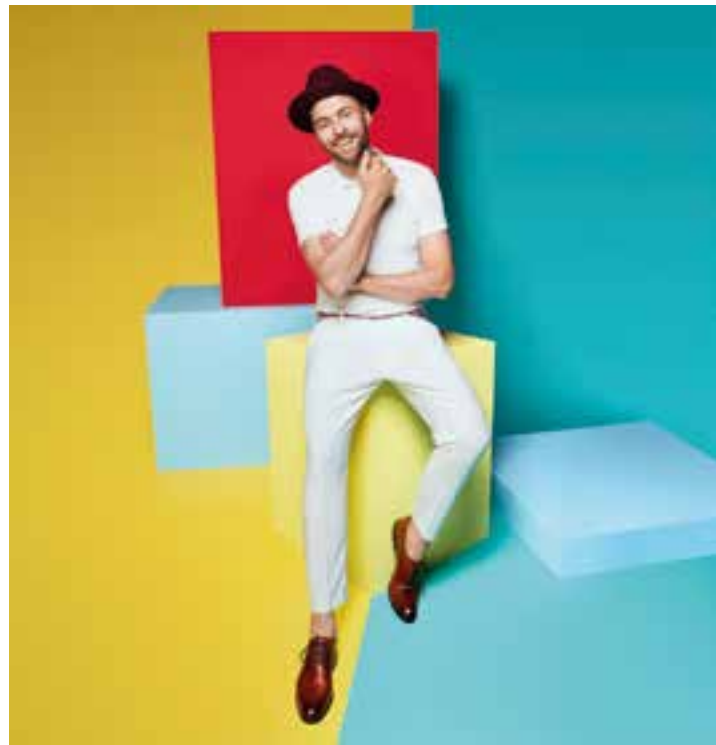
Max Mutzke