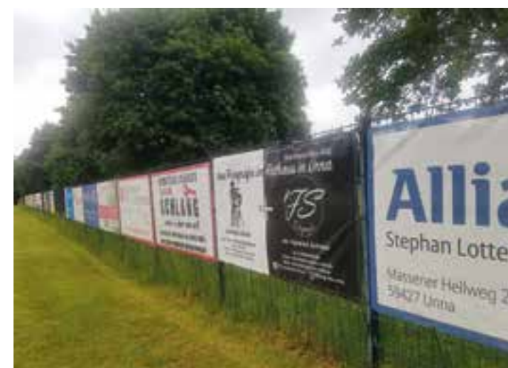
Banner-Werbung heimischer Firmen am Abgrenzungs-Zaun zur Finnen-Laufbahn.

tung des Denkmals. Das gärtnerische Umfeld ist zwar noch nicht vollständig abgeschlossen, aber hier wird zukünftig der Zuschauer-Einlaß sein. Zu diesem Zweck wird der Kassen-Bereich hier wieder hergerichtet. Der Platz-Zugang vom Sportheim aus wird zukünftig den Spielern vorbehalten sein - auch eine Maßnahme, die sich in der Pandemie-Zeit bewährt hatte. Auffällig für alle Besucher wird sein, daß es dem Verein gelungen ist eine Vielzahl von heimischen Firmen davon zu überzeugen ihre Banner-Werbung am Abgrenzungs-Zaun zur Finnen-Laufbahn zu platzieren. Dies ergänzt die bereits vorhandene Banden-Werbung rund um das Spielfeld und verschafft dem Verein einen finanziellen Grundstock