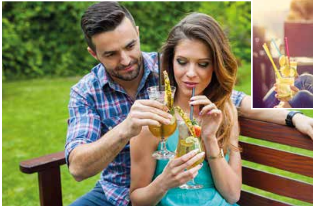
Die Aromen des Urlaubs nach Hause holen: Ein tropischer Cocktail mundet auch im heimischen Garten.

Rezepttipps: Lifestyle-Cocktails aus aller Welt selbst mixen