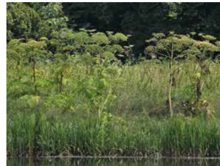
Bis zu vier Meter groß: der Riesen-Bärenklau, auch Herkulesstaude genannt.

Eine Verbreitung des Riesen-Bärenklau wirksam zu verhindern,