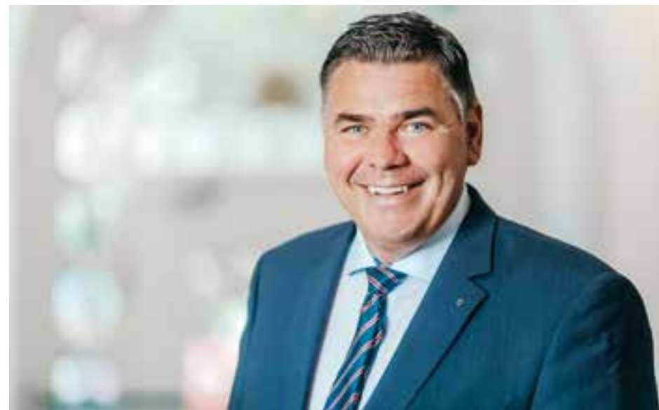
Bus und Bahn fahren soll einfacher werden. Landrat Mario Löhr freut sich über die Pläne zum eTarif und fordert, ihn auch auf Abo-Tickets auszudehnen.

Gärtner rücken Unkraut auf befestigten Flächen am besten mit mechanischen Verfahren zu Leibe. Neben dem Hacken und Jäten oder dem Einsatz von Fugenkratzer und rotierenden Bürsten leisten beispielsweise gegen Moos auch ein fester Besen und heißes Wasser bei der Beseitigung gute Dienste. Auch Hochdruckreiniger sind für die Unkrautbeseitigung insbesondere von Moos auf Dach- und Pflasterflächen geeignet. Mit Abflämmgeräten sollte wegen der Verletzungs- und gerade auch der Brandgefahr besonders vorsichtig umgegangen werden. „Die Unkrautbekämpfung ohne chemische Hilfsmittel kann mühsam sein“, räumt Marten Brodersen ein und unterstreicht gleichzeitig: „Sie ist aber zum Schutz der Gewässer unverzichtbar.“ Schließlich werde aus Gewässern Trinkwasser gewonnen – das wichtigste Lebensmittel. PK|PKU