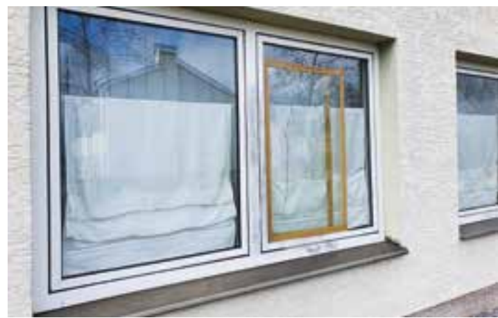
Das Sportheim an der Karlstraße ist inzwischen mit einer Alarmanlage ausgestattet. Nach mehreren Einbrüchen in den letzten Monaten ist nunmehr eine Objekt-Sicherung erfolgt. Zwar waren die materiellen und finanziellen Schäden nie gravierend, aber ein gewisser Vandalismus für die Betreiber sehr ärgerlich und zeitaufwändig in der Wiederherstellung von Sauberkeit und Ordnung.

Uhr auf der Platzanlage an der Sonnenschule statt. Prominent geleitet wird dieses Sonder-Training vom Co-Trainer des Zweit-Bundesligisten Hannover 96. Sicherlich ein High-Light für Trainer und Spieler der SG Massen - oder solche die es noch werden wollen. Es wird um eine Anmeldung unter 0179-4945332 gebeten. Der Reigen mit nachzuholende Jahreshauptversammlungen startet diesmal mit dem Förderverein der SGM. Dieser lädt ein für Freitag, den 25. Juni ab 19:00 Uhr in das Vereinsheim an der Karlstraße, also neben der Sportanlage. Da es hier als einzige Gruppe des Vereins nicht gelungen ist eine Ver-