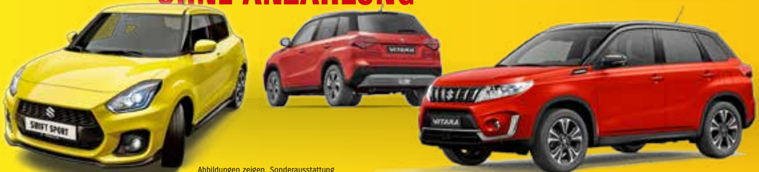
Abbildungen zeigen Sonderausstattung

z.B. Swift Sport Hybrid 1.4 mit 95 kW (129 PS), Gelb, LED-Scheinwerfer, Abstands-Tempom., LED-Rücklicht, Sitzhgz., Navi, Rückfahrkamera , KeylessGo, Multif.-Lenkrad, Klimaautom., Fernlichtassist., PDC v&h, 17" LM-Felgen, DAB+ mit Smartphone-Anbindung, u.v.m. Preisvorteil 1 7.660 €