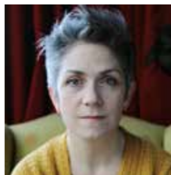
Denise Mina liest bei „Hellweg meets World“.