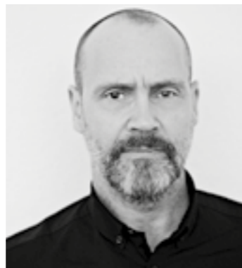
Simon Beckett sorgt für Mordspannung pur.

Mit Jussi Adler-Olsen ist ein Träger des Europäischen Krimipreises erneut bei „Mord am Hellweg“ zu Gast. Er bringt am Dienstag, 13. Oktober, den aktuellen, achten Fall für Carl Mørck mit nach Gelsenkirchen: „OPFER 2117“. Schauspieler Peter Lohmeyer (Das Wunder von Bern) übernimmt wie gewohnt kongenial den deutschen Lesepart. Am Sonntag, 18. Oktober, rockt Kai Havaii im kultigen Dortmunder Jazzclub „domicil“ die Bühne. Der unter die Krimischriftsteller gegangene Punkrocker, TV-Produzent und Cartoonzeichner liest aus seinem, für den renommierten Gläuser-Preis nominierten, Debütroman „Rubicon“.