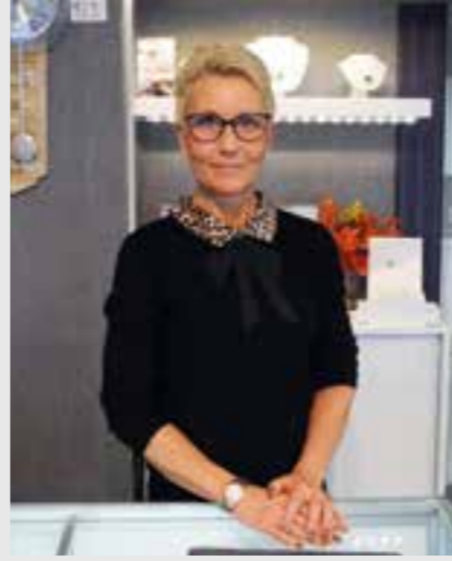
Lubojanski ist, die sehr gut zu „Schick und Schön“ passt, bietet sie seit Kurzem auch kreative Nail-art an. Text u. Foto: F.K.W. Verlag

sondern sich von einem individuellen Schmuckstück finden lassen möchten. Aber auch Gold kommt hier nicht zu kurz, sondern zurück: Nach wie vor kann der gute Goldpreis genutzt werden, um hier manch alten Schatz zu Bargeld zu machen. Das gilt übrigens auch für Silber, Tafelsilber und Münzen. Zum Service gehören außerdem Reparaturen, Batteriewechsel und Anfertigungen. Und weil auch das eine Leidenschaft von Antje