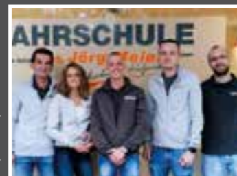
Text: F.K.W. Verlag