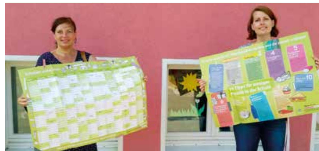
Jutta Eickelpasch (Verbraucherzentrale) und Ophelie Lespagnol (Diesterwegschule) verteilen im Juli Schuljahreskalender mit zehn Tipps für plastikfreie Schule an alle Erstklässler-Eltern.

Bündnis gegen Plastik startet wieder durch