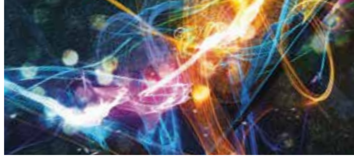
Plakat: Stadt Kamen