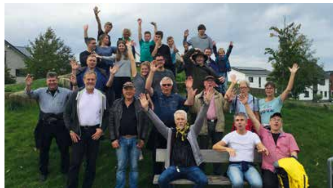
2019 ging's Richtung Hohenbuschei.

Die Wanderung beginnt um 10.30 Uhr (nach der Messe) und ist natürlich so ausgelegt, dass auch Kinder diese ohne weiteres bewältigen können und die Regelungen zur Corona Pandemie eingehalten werden. Bei der Hälfte der Strecke erwartet die Teilnehmer eine kleine Stärkung. Zur besseren Planung würden wir uns über eine vorherige Anmeldung unter Tel. 0170/4110581 oder kolping-husen@web.de freuen.