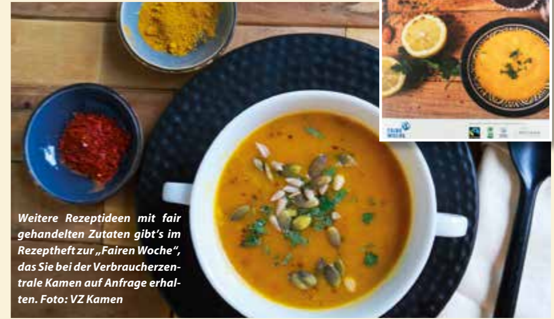
Weitere Rezeptideen mit fair gehandelten Zutaten gibt's im Rezeptheft zur „Fairen Woche“, das Sie bei der Verbraucherzentrale Kamen auf Anfrage erhalten.

Gemüsefond einrühren und weiter fünf Minuten dünsten. Etwas abkühlen lassen und in eine