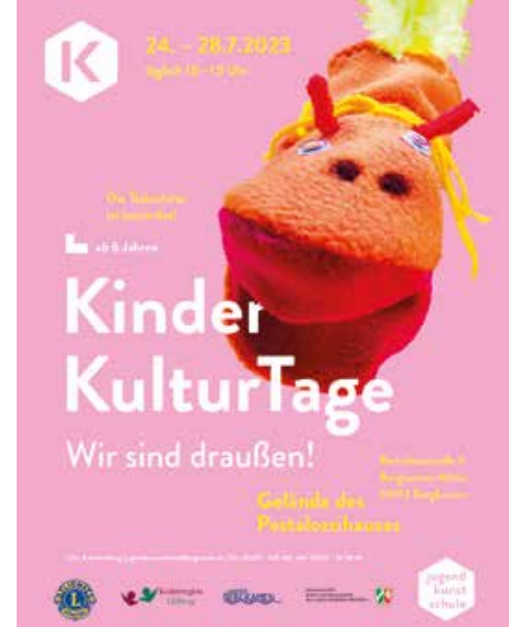
Plakat: Stadt Bergkamen

Die Besucherinnen und Besucher sind bereits ab 18.00 Uhr zu einem musikalischen Vorprogramm eingeladen, Filmbeginn ist ca. 22.00 Uhr. Ein kleines Speisen- und Getränkeangebot wird es selbstverständlich auch geben. Freuen Sie sich aber auf beste Unterhaltung mit einzigartigem Open-Air-Feeling! Der Eintritt ist frei.