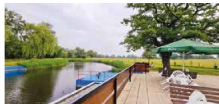
Die Liegefläche und neues Mobiliar laden zum Verweilen ein.

Der Bergkamener Stadtrat hatte 2021 beschlossen, das Bad bei Sanierungs-, Renovierungs- und Außenarbeiten finanziell zu unterstützen. Diese Maßnahmen sind größtenteils abgeschlossen und kommen den Badegästen nun zugute. Allen voran muss man die neue Photovoltaikanlage nennen, die das Bad in Richtung Klimaneutralität bringt und die technischen Geräte mit Strom versorgt – eine