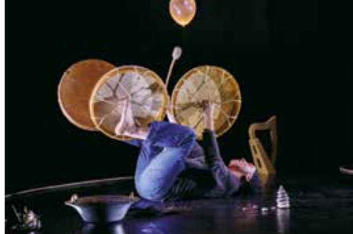
Das Theater LagunArte spielt „Aufwärts!“. Foto: Helios Theater