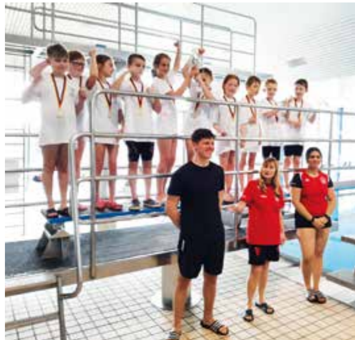
Die erfolgreichen Schwimmer/innen der Jahnschule.

Die Bergkamener Grundschulen haben ihre Stadtmeister im „Schwimmen“ und im „Fußball“ ermittelt.