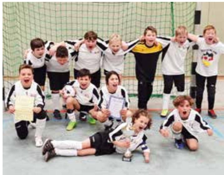
Stolze Turniersieger: die Mannschaft der Preinschule.

Temporennen und Ausdauer-schwimmen, stand auch eine T-Shirt Staffel auf dem Programm. Souverän gewann dabei die Oberadener Jahnschule, die Bergkamen auch bei den Kreismeisterschaften vertreten hat. Dort belegte die Mannschaft den 3. Platz.