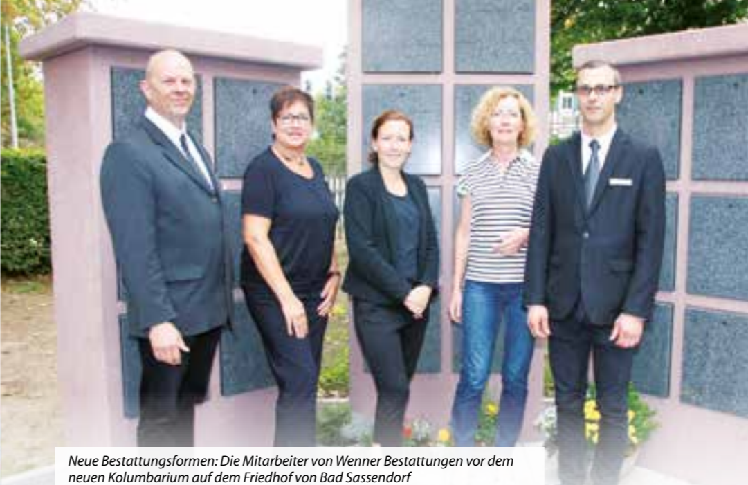
Neue Bestattungsformen: Die Mitarbeiter von Wenner Bestattungen vor dem neuen Kolumbarium auf dem Friedhof von Bad Sassendorf