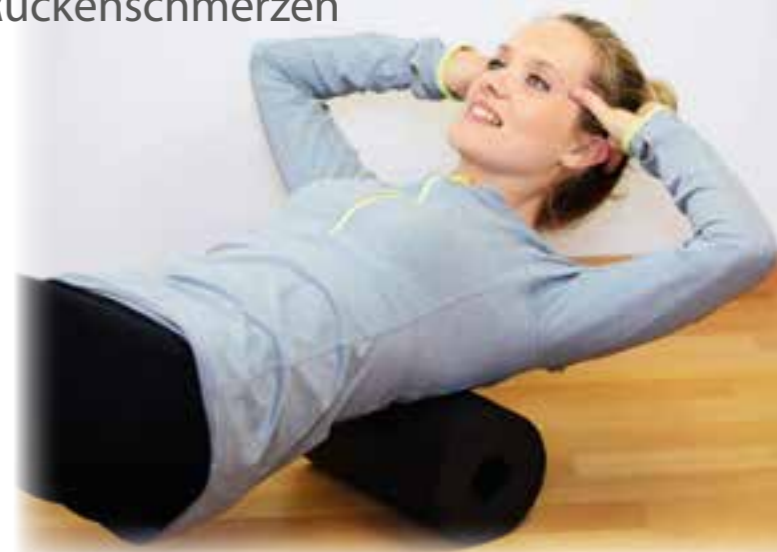
Beim Faszientraining kommen häufig spezielle Rollen und Kugeln zum Einsatz, um die Bindegewebsfasern wieder geschmeidig zu machen.

Der Organismus kann solche Nervenschäden selbst reparieren, braucht dazu allerdings natürliche „Nervenbausteine“, um die Regeneration der betroffenen Zellen zu fördern. Förderlich ist außerdem gezieltes Faszientraining. (djd)