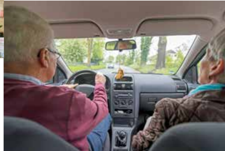
Ältere Menschen werden manchmal „von Technik erschlagen“: Produkte und Dienstleistungen müssen auch auf Senioren zugeschnitten sein.

„Das Internet ist kein Exklusivclub für die junge Generation“