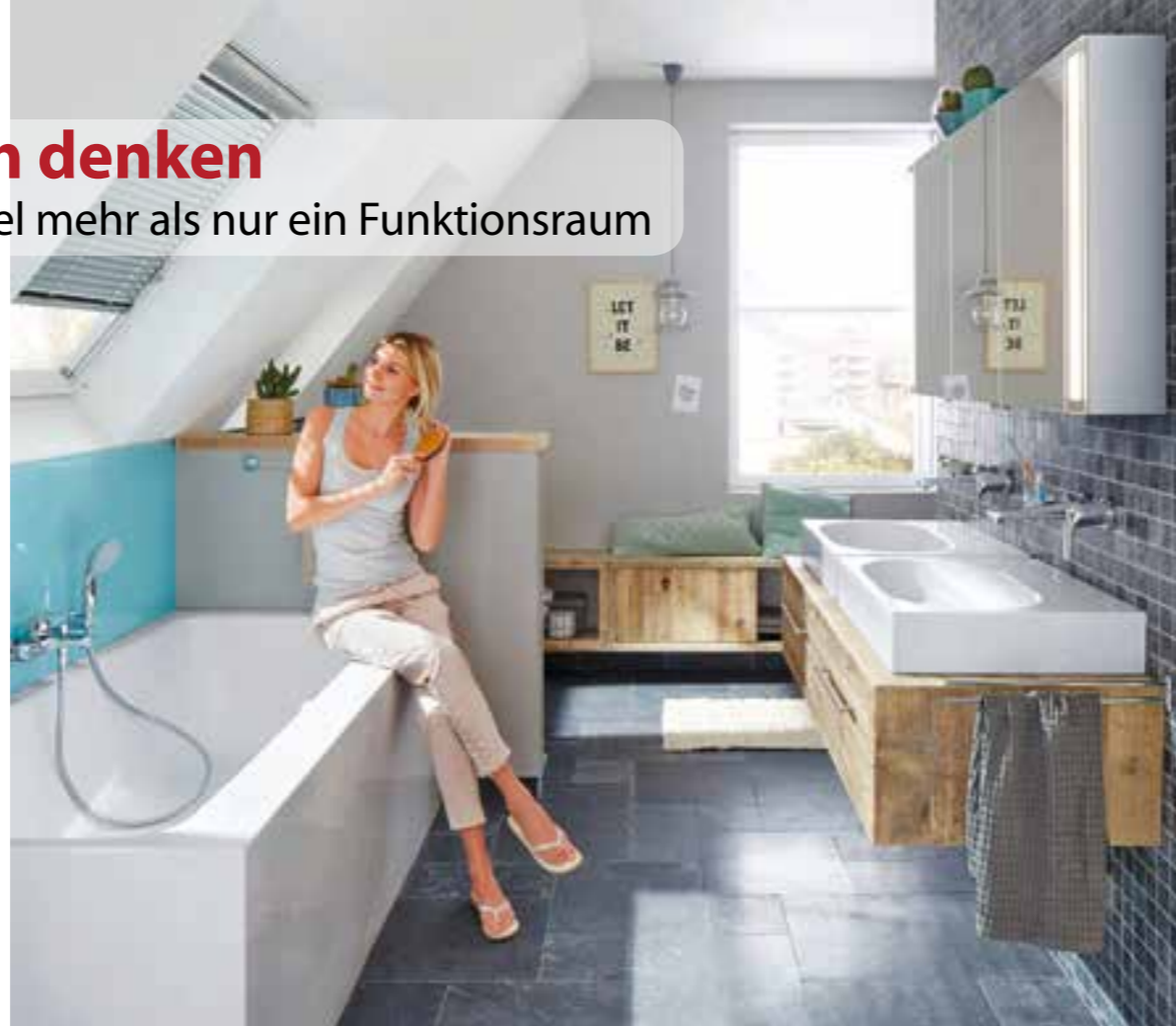
Das viele Tageslicht, das durch die Kombination zweier Dachfenster fällt, lässt das Bad gleich viel freundlicher und großzügiger wirken.

Fensterflächen vergrößern Befindet sich das Bad im Dachgeschoss, ist eine Vergrößerung der Fensterfläche mit viel weni-