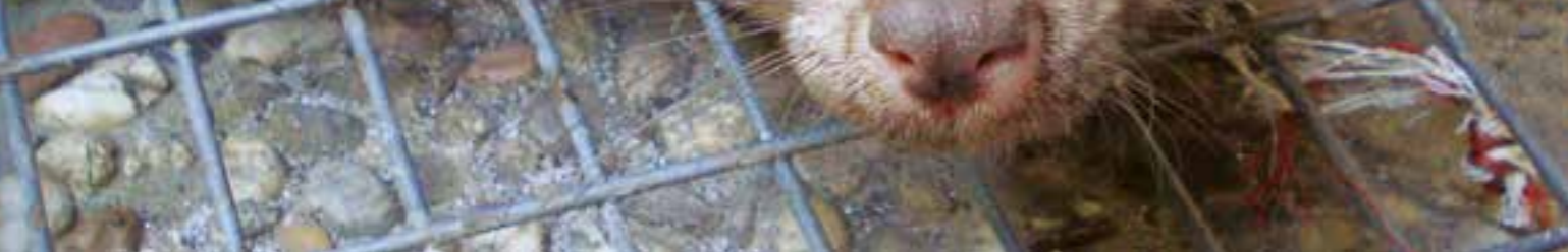
In einem Käfig würden wohl die meisten Mardergeplagten dieses eigentlich niedliche Tier am liebsten sehen.

Mit diesen Tipps sind Marderschäden kein Thema mehr