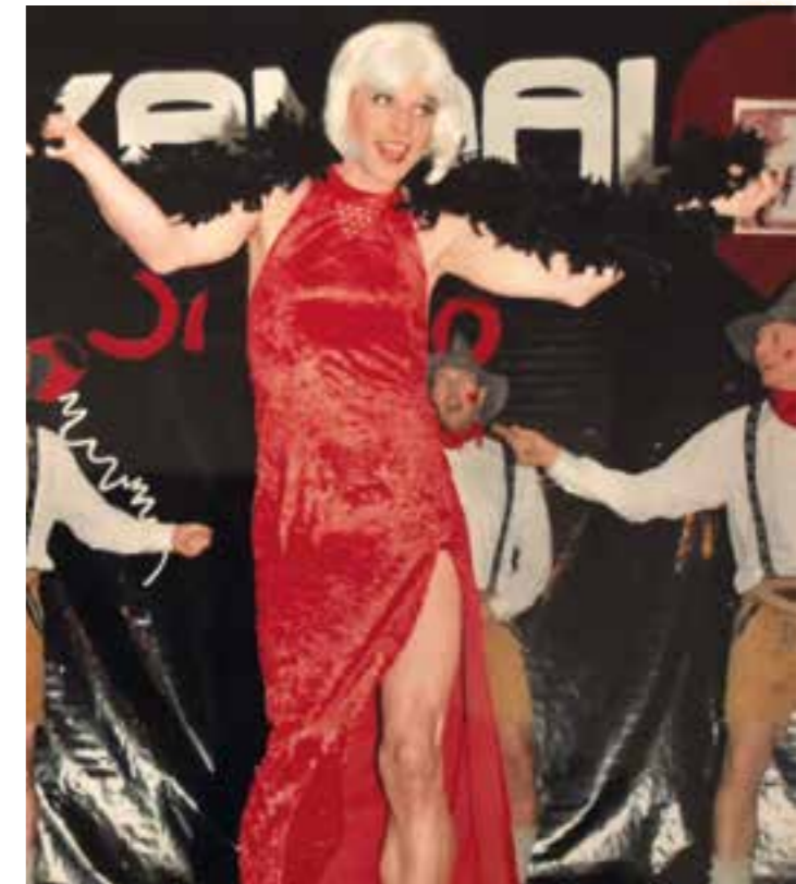
Diese Rosi sowie die telefonische Kartenreservierung für den Herzfelder Karneval erreichen Sie NICHT unter Tel. 32 16 8.

Publikum steht auf den Stühlen und klatscht. Wir genießen diesen Moment in vollen Zügen. Mit dem Applaus erhalten wir unseren Lohn für unzählige Übungsabende, um den Zuschauern Vergnügen zu bereiten. Genauso oder ähnlich ergeht es auch in diesem Jahr wie-