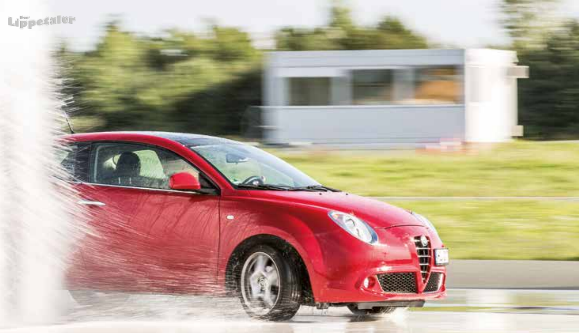
Fahrsicherheitstrainings bietet unter anderem der ADAC an.