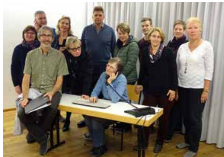
Kurze Pause während der Probe zu „Chefs und andere Katastrophen“. Die Theatergruppe Lippetal freut sich auf die neue Spielzeit.

Die Komödie in drei Akten von Hans Schimmel ist am Samstag, 2. Februar, ab 20 Uhr und Sonntag, 3. Februar, ab 18 Uhr im Albertusaal in Lippe-