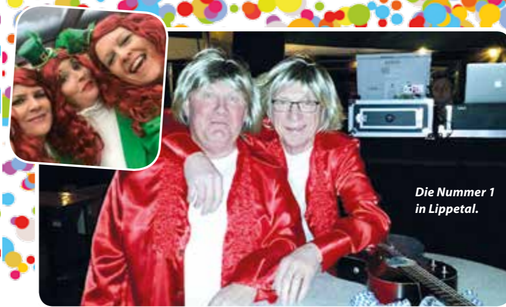
Die Nummer 1 in Lippetal.

Einlass ab 16 Jahren Die Party beginnt um 20 Uhr, Einlass ist ab 16 Jahren, die Ausweise werden kontrolliert. Der so genannte Erziehungsberechtigtenschein wird nicht akzeptiert. Es gilt das Jugenschutzgesetz, daher wird genau darauf geachtet, dass alle Minderjährigen spätestens um Mitternacht die Veranstaltung verlassen. Wer dabei sein möchte, sollte früh da sein, denn erfahrungsgemäß wird die Warteschlange ab 22 Uhr immer länger. Der Eintritt für die Megasause kostet 10 Euro, mit der Sparkassen-Joker-Karte 8 Euro.