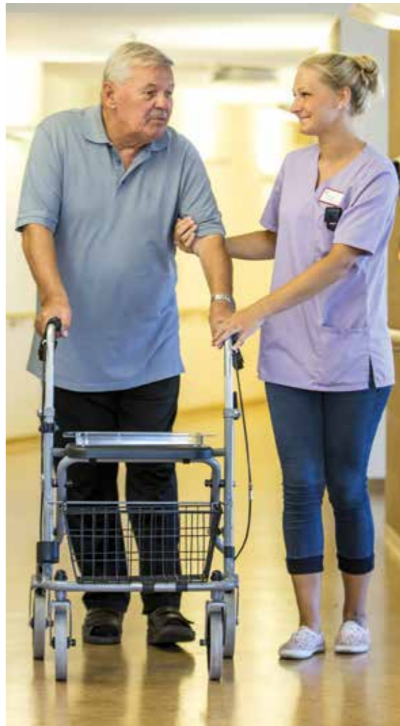
Dame mit Rollator-Mann.

Natürlich möchte man sich im Alter die Selbstständigkeit so lange wie möglich erhalten. Holen Sie sich Unterstützung für den Haushalt! Eine Putz-Perle nimmt Ihnen die schweren Arbeiten ab und Lieferdienste für Essen ersparen Ihnen das Kochen. Wenn ein Pflegegrad besteht, kann die Hilfe im Haushalt über den Pflegedienst organisiert werden. Tipp: