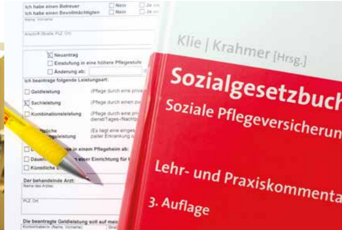
Antrag Pflegegrad.

stungen oder Anforderungen nicht selbstständig kompensieren oder bewältigen können“ – und das auf Dauer. Stellen Sie dies selbst oder Ihre Verwandten bei Ihnen fest, dann können Sie einen Pflegegrad bei der Pflegekasse beantragen. Nach Ihrem Antrag wird der Besuch eines Gutachters über den Pflegegrad entscheiden.