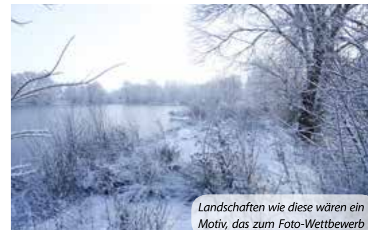
Landschaften wie diese wären ein Motiv, das zum Foto-Wettbewerb „Lippetaler Lieblingsplätze“ eingereicht werden kann.

In diesem Jahr feiert die Gemeinde Lippetal ihren 50. Geburtstag. Das schreit geradezu nach einem besonderen Event! Bürgerinnen und Bürger sind daher zu einem Foto-Wettbewerb aufgerufen. Unter dem Motto „Lippetaler Lieblingsplätze“ können bis zum 15. Juni Fotos aus zwei Kategorien eingereicht werden.