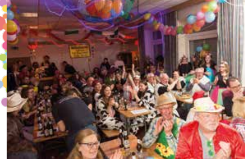
Betting helau! Am 2. März geht es hoch her im Bürgerhaus.