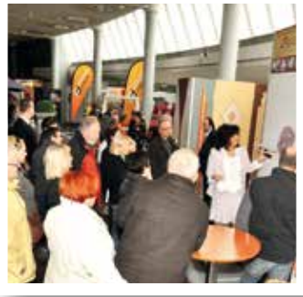
Soest Seite 11

Leistungsschau der Region öffnet zum 21. Mal