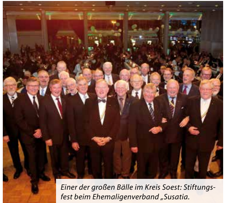
Einer der großen Bälle im Kreis Soest: Stiftungsfest beim Ehemaligenverband „Susatia“.

bildung im Handwerk ist ein europäischer, ein internationaler Exportschlager. Delegationen aus China und Indien besuchen uns, um zu verstehen, warum unsere jungen Leute so hervorragend geschult sind“. Das Handwerk sei einer der größten Arbeitgeber überhaupt - mit 45.000 Beschäftigten und 4.000 Lehrlingen in der Region.