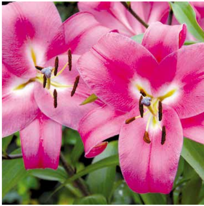
Die Lilie ‚Robina‘ trägt große Blüten in sattem Pink. Sie ist winterhart, robust und gut für die Pflanzung im Garten geeignet.

Im Winter herrscht Ruhe im Garten - Rasenmäher, Schere und andere Geräte sind verstaut und warten auf den Frühling. Doch Gartenbesitzer, die im Sommer 2015 ein Beet mit farbenfrohen Lilien genießen wollen, sollten jetzt den Spaten in die Hand nehmen und die Zwiebeln in die Erde setzen.