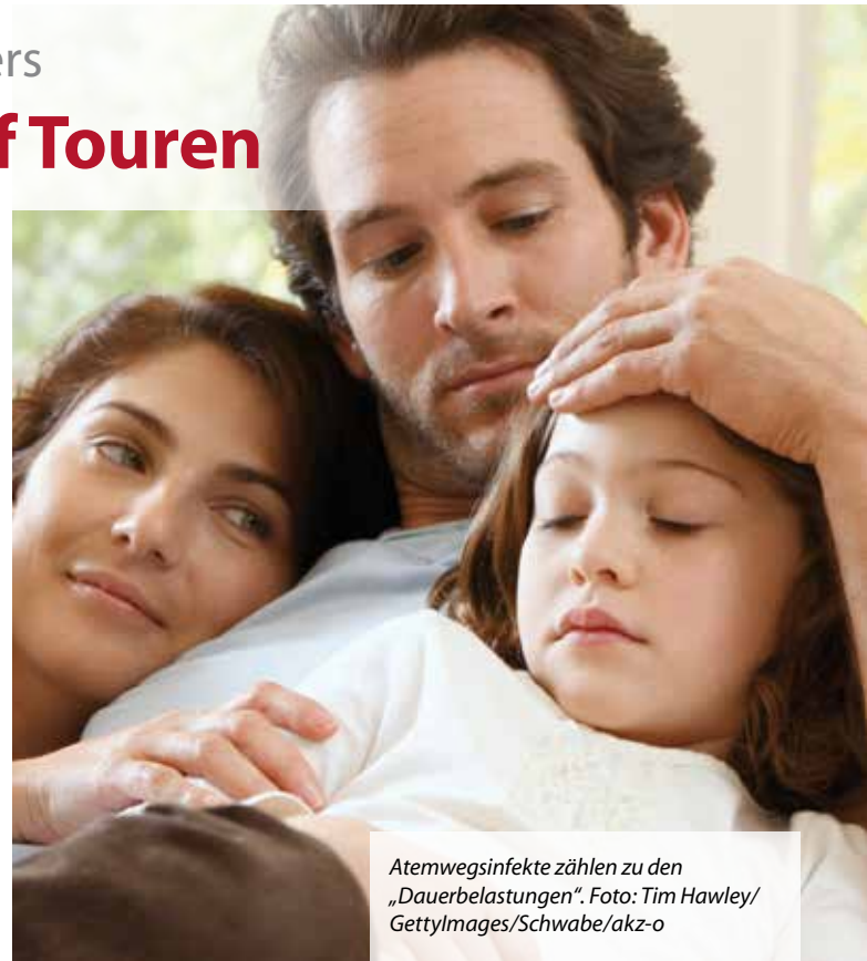
Atemwegsinfekte zählen zu den „Dauerbelastungen“.

Da Antibiotika gegen Virusinfekte nichts ausrichten, können Arzneimittel aus dem pflanzlichen Fundus hier geeigneter sein. Pflanzenextrakt kann nicht nur die Symptome lindern, sondern auch die Ursache des Infekts bekämpfen.