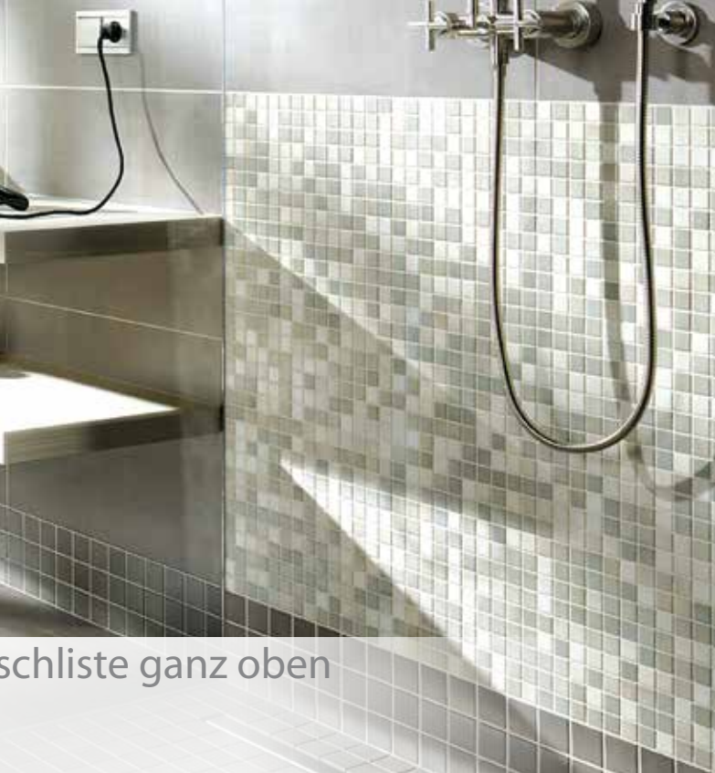
schlische ganz oben

Zukunft setzen darum immer mehr Bauherren auf bodenebene Duschen. Denn vom hohen Nutzungskomfort eines bequemen, schwellenlosen Zugangs und von dem Plus an Platz gegenüber engen Duschkabinen profitieren Jung und Alt – und zwar nicht nur beim Duschen, sondern auch bei der Reinigung.