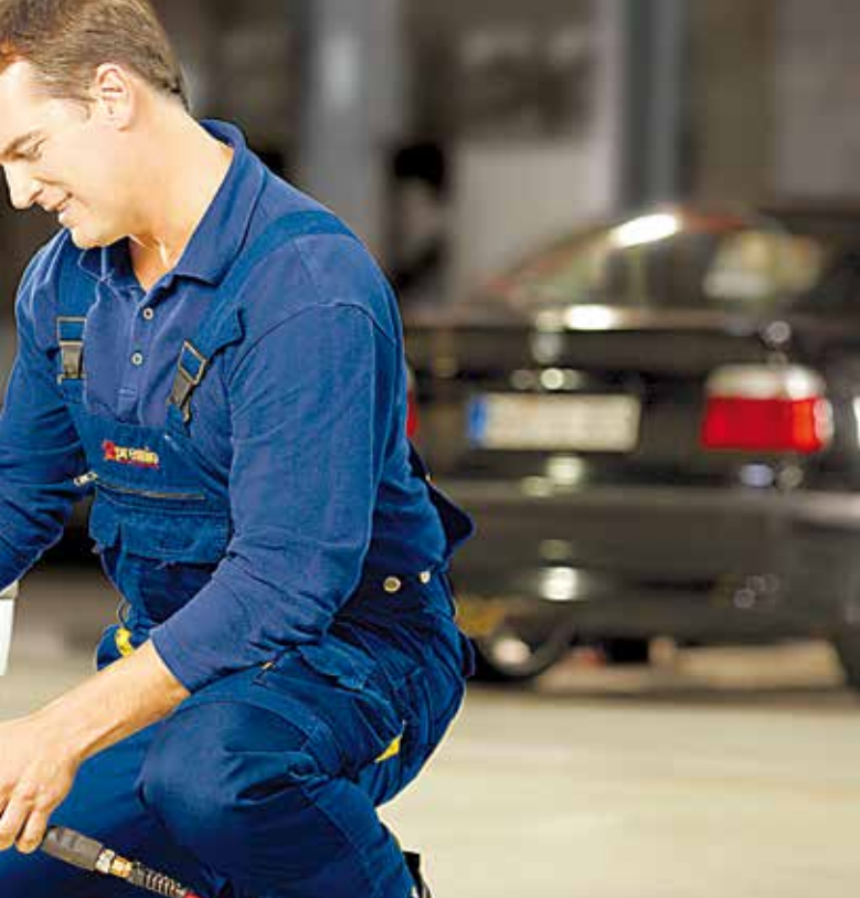
Autoreifen verlieren 0.1 bar Druck pro Monat. Die Kontrolle über den korrekten Luftdruck übernehmen bei Neufahrzeugen der Klasse M1 die Reifendruckkontrollsysteme.