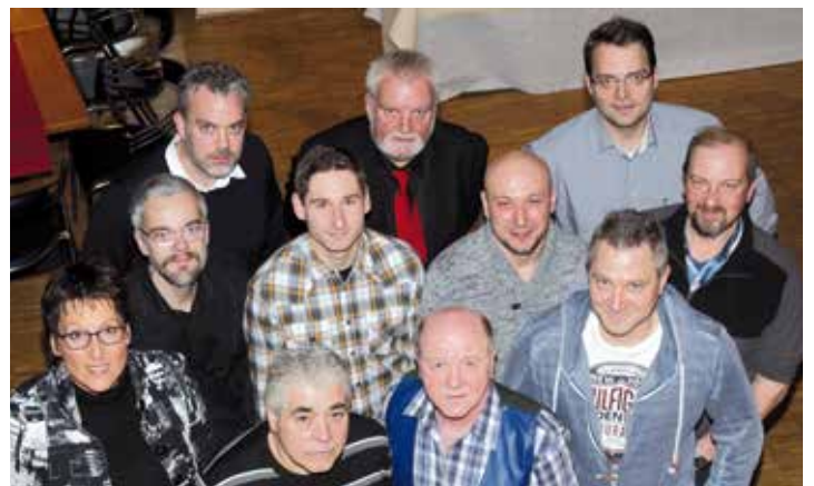
Auszeichnung für treue Mitglieder bei der Bauunternehmung Lehde.