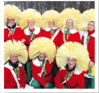
Welver Seite 41

Neues Zentrum geht im Kurort an den Stadt