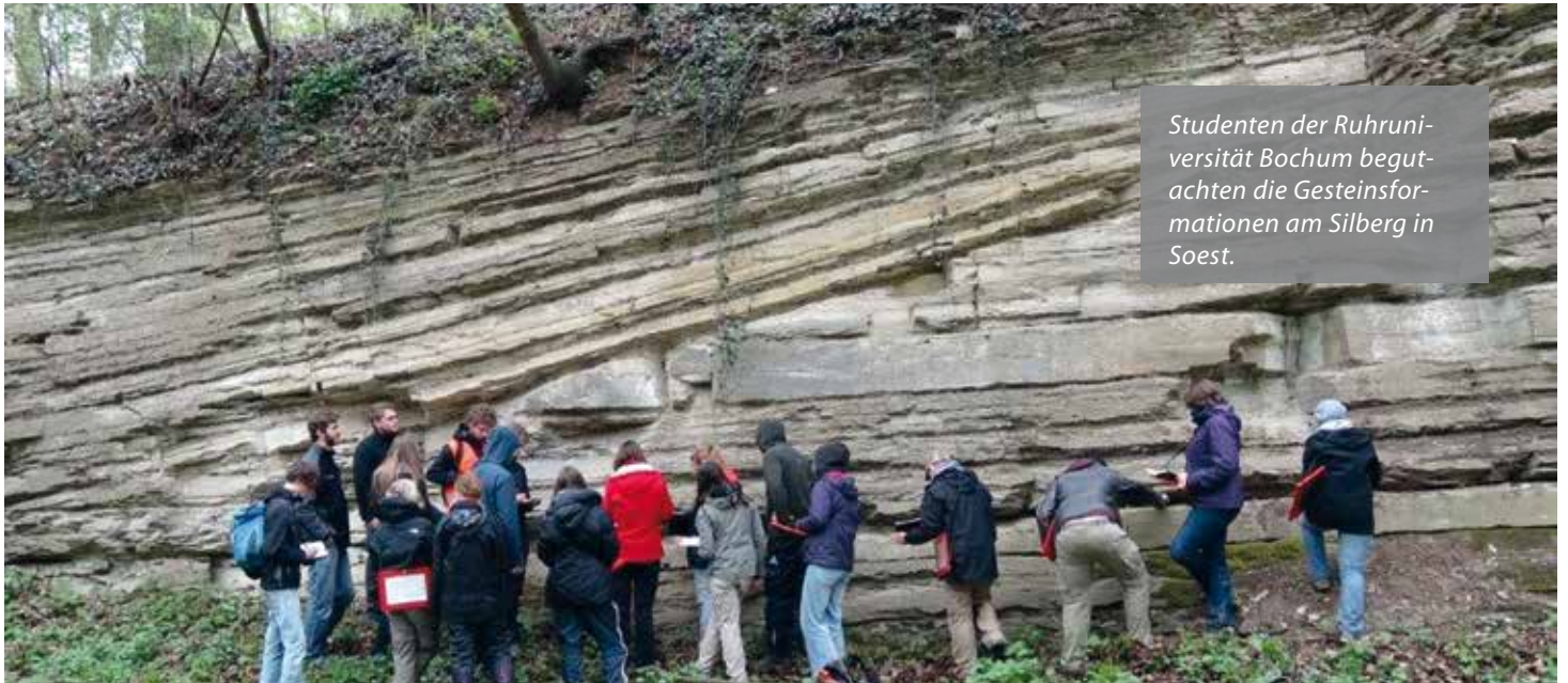
Studenten der Ruhruni- versität Bochum begut- achten die Gesteinsfor- mationen am Silberg in Soest.