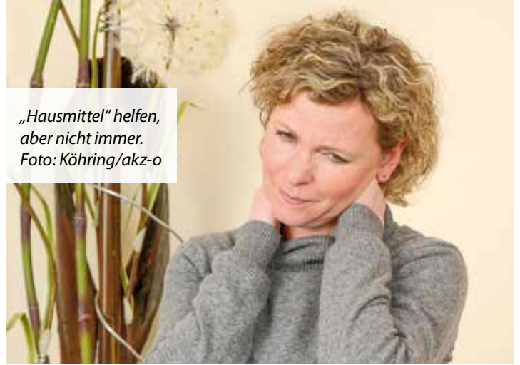
„Hausmittel“ helfen, aber nicht immer.