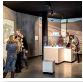
Bad Sassendorf Seite 19

Leistungsschau der Region öffnet zum 21. Mal