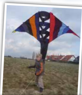
Auch die Jugend macht mit beim Drachenfest.

Sollte es dann doch mal Fragen geben, stehen mit den Drachenfreunden Hamm und Experten aus anderen Vereinen die besten Fachleute bereit, um zu helfen, um Antworten zu geben. Die „Profis“ wollen mit rund 30 bis 50 Mitgliedern kommen, geben gerne Tipps, verraten ihre Tricks und Kniffe und lösen etwaige Probleme rund um die Flugobjekte. Gibt es mal Schwierigkeiten, etwa bei der Entwicklung, der Planung oder dem Bau, hier ist