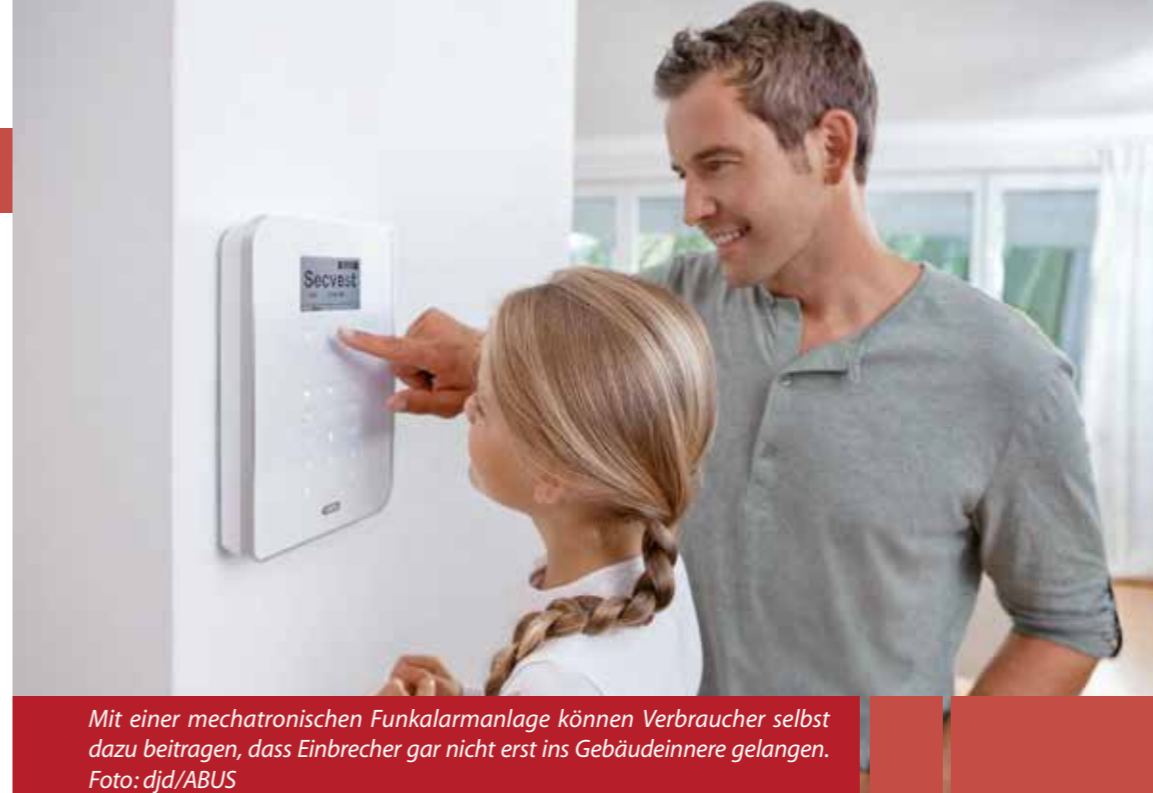
Mit einer mechatronischen Funkalarmanlage können Verbraucher selbst dazu beitragen, dass Einbrecher gar nicht erst ins Gebäudeinnere gelangen.

Statistisch gesehen wird etwa alle zwei Minuten irgendwo in Deutschland eingebrochen. Das Bewusstsein der Bürger, sich mit moderner Sicherheitstechnik schützen zu müssen, ist deutlich gestiegen. Inzwischen werden Erwerb und professionelle Installation solcher Systeme zudem durch staatliche Zuschüsse über die KfW