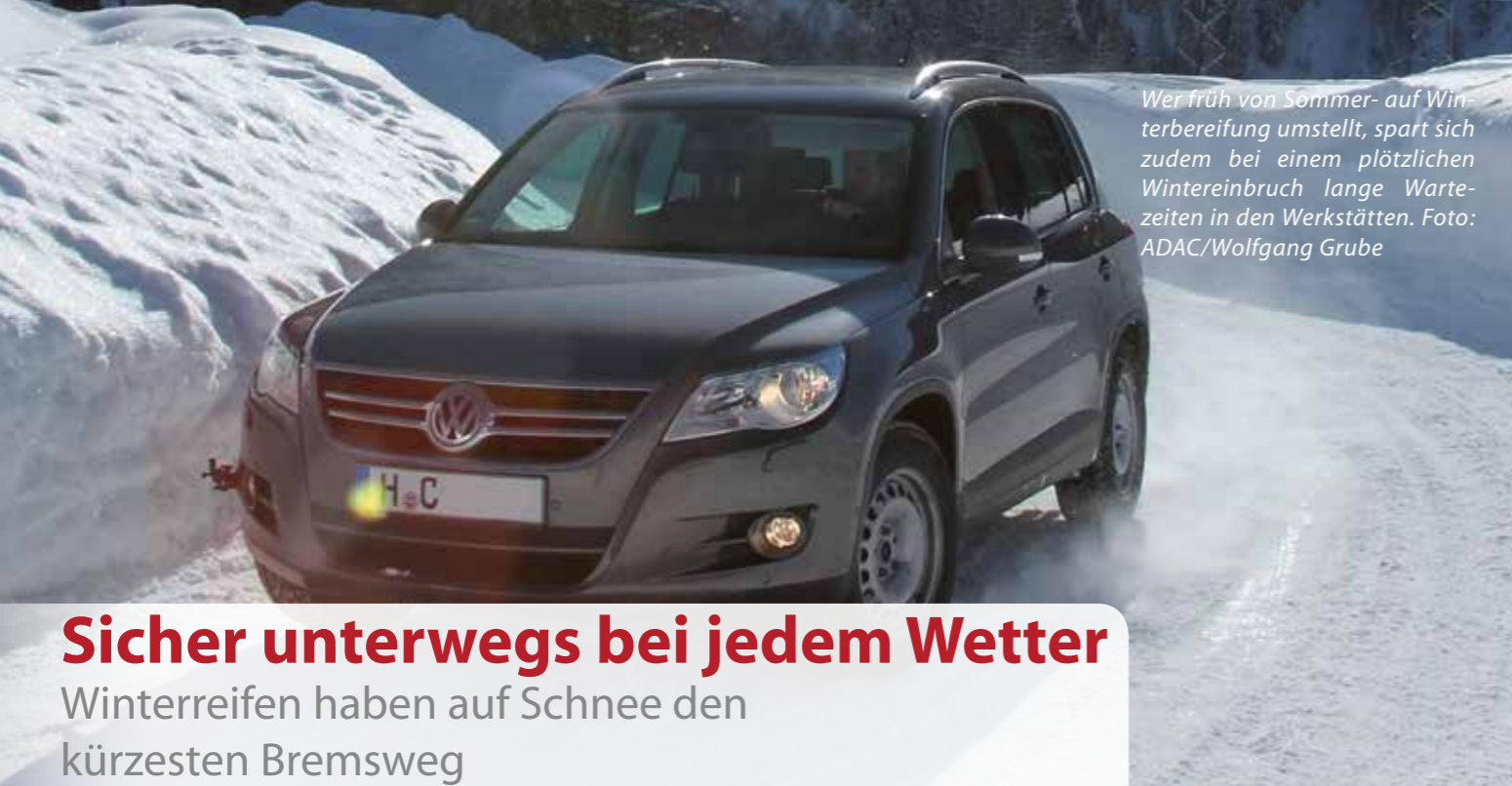
Wer früh von Sommer- auf Winterbereifung umstellt, spart sich zudem bei einem plötzlichen Wintereinbruch lange Wartezeiten in den Werkstätten.