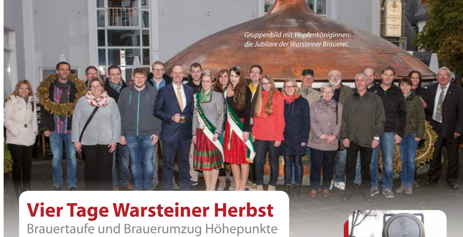
Gruppenbild mit Hopfenköniginnen: die Jubilare der Warsteiner Brauerei.