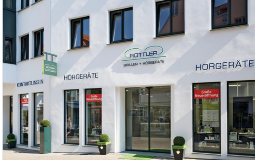
Das neue ROTTLER-Kompetenzzentrum für Sehen & Hören in der Brüderstraße 22-24 in Soest.