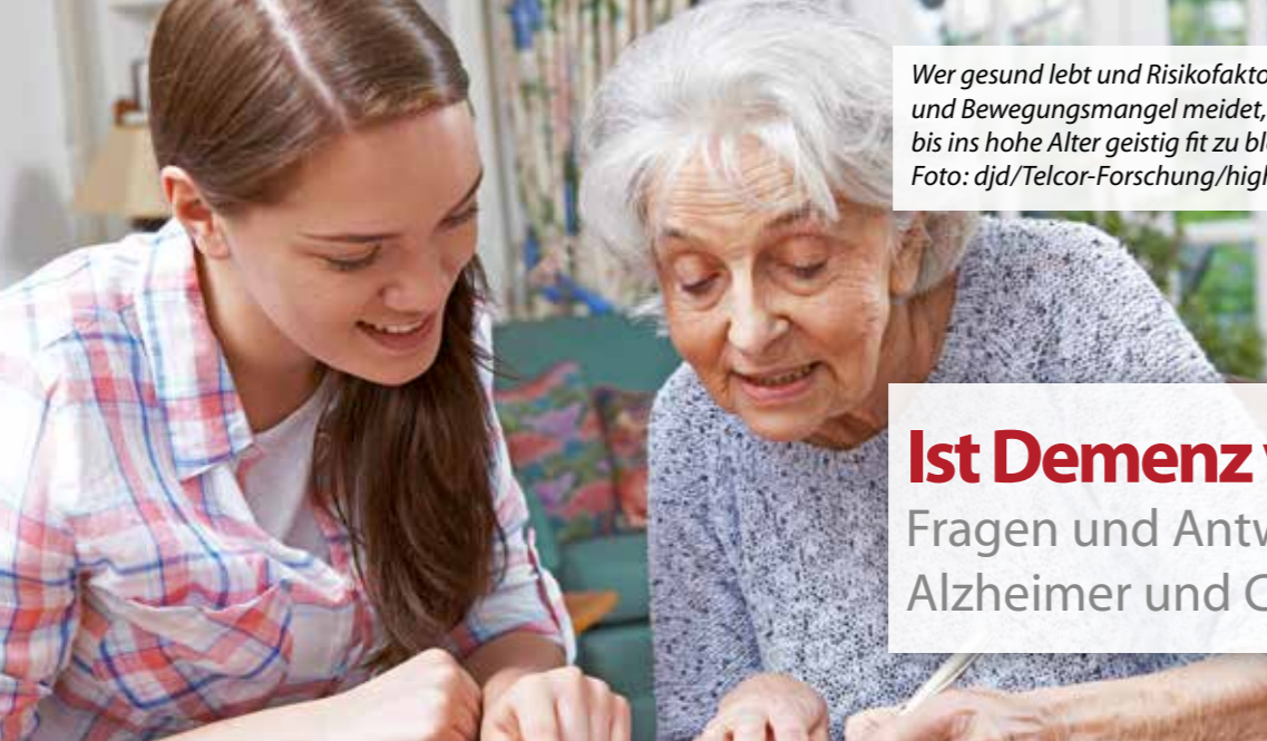
Wer gesund lebt und Risikofaktoren wie Rauchen und Bewegungsmangel meidet, hat bessere Chancen, bis ins hohe Alter geistig fit zu bleiben.