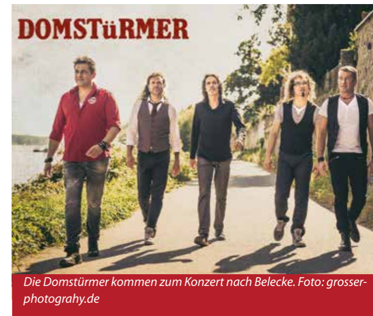
Die Domstürmer kommen zum Konzert nach Belecke.

Wenn dann die letzten kölschen Töne verklungen sind, sorgt die Aftershow-Party mit DJ Knut für beste Stimmung bis in den frühen Morgen.