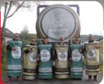
Auch fantasievolle Verkleidungen lassen sich die Azubis einfallen.

Der Brauerumzug am Sonntag, 16. Oktober, steht diesmal unter einem ganz besonderen Motto, denn das Reinheitsgebot feierte sein 500-jähriges Bestehen. Ab 13 Uhr rollt der Tross von der Franz-Hege-mann-Straße aus durch die Innenstadt Warsteins. Die Brauerei wird einige historische Vehikel präsentieren, der Fasswagen ist schon Tradition. Auch eine Kutsche wird die Kolonne bereichern. Ob die Lehrlinge aus dem ersten Jahr wieder große, alte Bierfässer über die gesamte Strecke rollen? Natürlich zeigen auch einige spe-