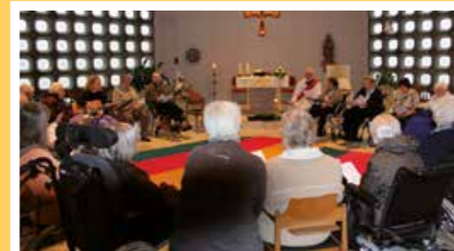
Demenzwortgottesdienst „Gottesdienst für den Augenblick“ für Menschen mit Demenzerkrankung, Begleitende und Interessierte

fahren und eine sichere Betreuung und Pflege für Mutter oder Vater benötigen. Es gibt aber noch weitere Fälle, in denen das „St. Michael“ weiterhelfen kann: Sie haben eine chronische Erkrankung oder brauchen neben der Pflege eine sichere Versorgung im Bereich Palliativversorgung. Hier geht es um Schmerzfrei-