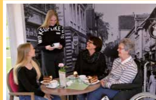
Gemütliches Beisammensein, Kontakte im „Café zum gemütlichen Eck“ im Foyer. Das Café ist täglich außer montags und donnerstags von 15-17 Uhr geöffnet. Im Café findet jeden Sonntag nach der Hl. Messe ein Frühschoppen für Bewohner und sehr gerne für Werler Bürger statt. Auch hier sind Gäste herzlich willkommen.

(NBA). Fünf Pflegegrade ersetzen künftig die bisherigen Pflegestufen. Dadurch sollen die Leistungen