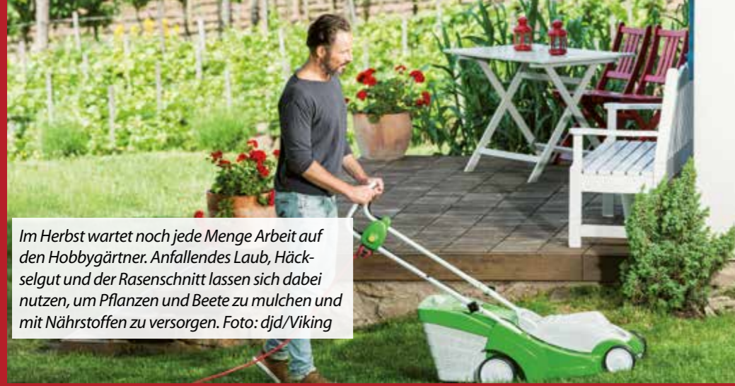
Im Herbst wartet noch jede Menge Arbeit auf den Hobbygärtner. Anfallendes Laub, Häckselgut und der Rasenschnitt lassen sich dabei nutzen, um Pflanzen und Beete zu mulchen und mit Nährstoffen zu versorgen.