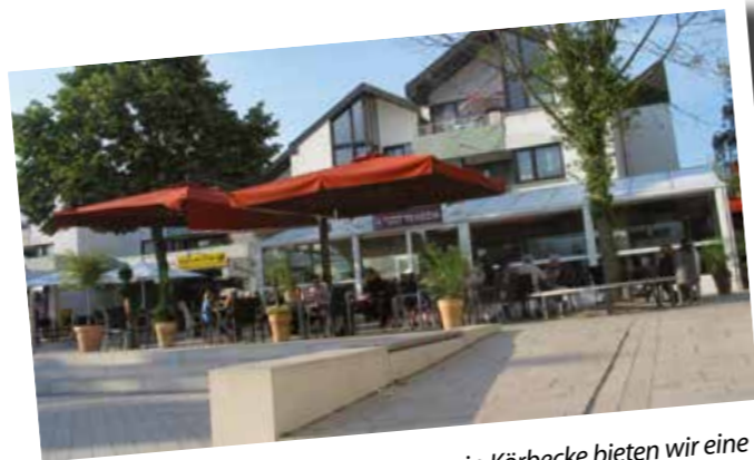
Italienisch genießen: In zentraler Lage in Körbecke bieten wir eine große Auswahl von Eis und Speisen, Kuchen, frischen Waffeln, Nudelgerichten, Salaten, argentinischen Steaks, Fisch und Pizza.

Am 7. Oktober ab 18 Uhr wird herzlich zum Mitfeiern eingeladen. Für beste Unterhaltung mit DJ Alex Heuser und das das leibliche Wohl der Gäste ist bestens gesorgt. Der Getränkepreis liegt bei einem Euro und der Erlös geht als Spende an den ortsansässigen Kindergartenverbund. Bedient werden die Besucher übrigens von den ansässigen Geschäftsleuten persönlich!