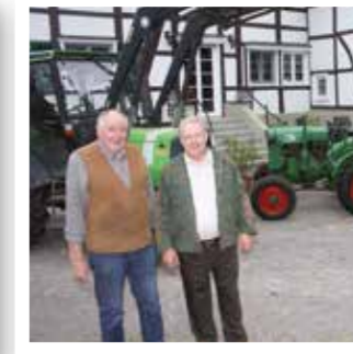
Werl Seite 32