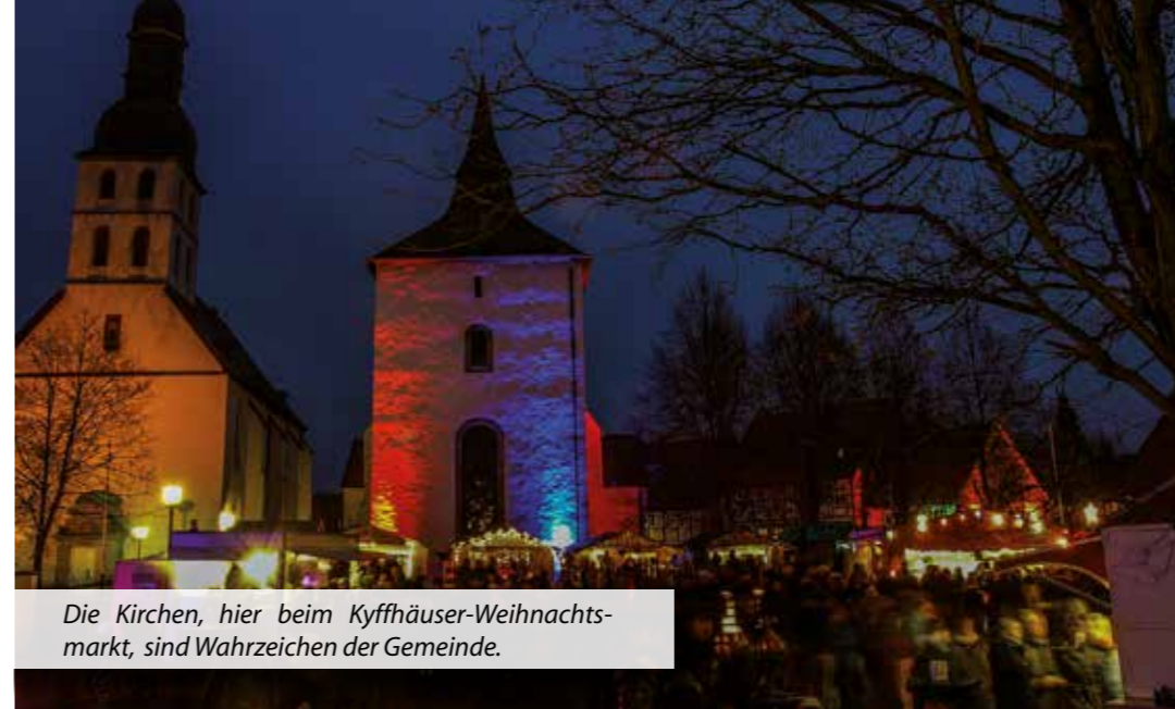
Die Kirchen, hier beim Kyffhäuser-Weihnachtsmarkt, sind Wahrzeichen der Gemeinde.

Das wirtschaftliche Angebot in der Gemeinde ist abwechslungsreich und lohnt durchaus den Besuch. Beispielsweise kann sich der „Genießer“ auf dem Hof Rüsse-Markhoff mit hochwertigen landwirtschaftlichen