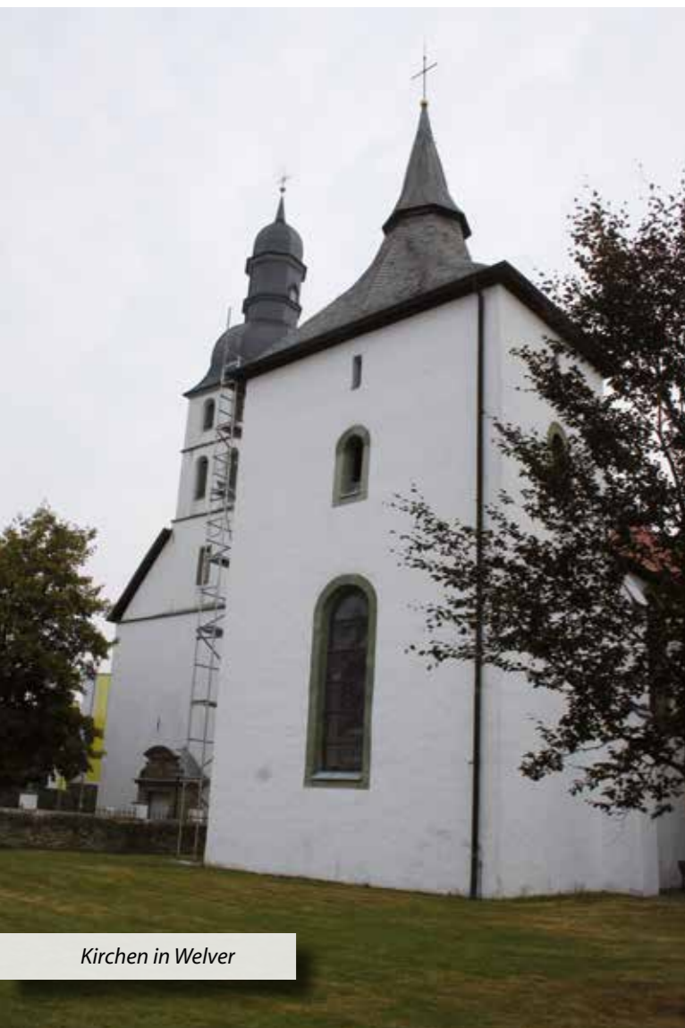
Kirchen in Welver

Wanderer nutzen vor allem die vorhandenen Wald- und Forstwege in den Wäldern um Welver und erfreuen sich an den vielfältigen Eindrücken der Landschaft. Welver ermöglicht mit seinem eher ebenen Gelände eine uneingeschränkte Naherholung für das breite Feld