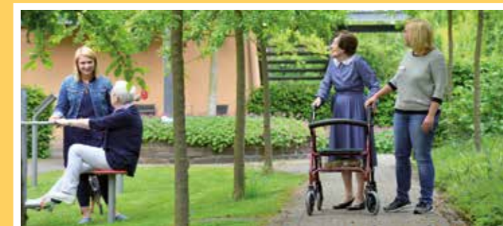
Dreistündige Betreuungsangebote werden mit den Angehörigen individuell abgestimmt. Dies kann zum Beispiel die Teilnahme an einem musikalischen Nachmittag, an einem Kreativangebot, einem begleiteten Spaziergang im Garten oder eine gesellige Spielrunde sein. Die Angebotspalette ist sehr groß und abwechslungsreich.

Darüber hinaus besteht die Möglichkeit, über die Kurzzeitpflege für eine bis vier Wochen das Leben in einem Seniorenzentrum kennenzulernen. Dies kann nach einem Krankenhausaufenthalt zwingend notwendig sein, aber auch, weil die Angehörigen in den Jahresurlaub