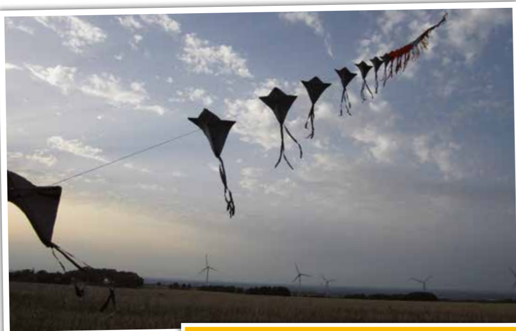
Drachen aufgereiht wie an einer Wäscheleine.

Ein besonderer Clou: eine in einem der Windvögel befestigte Kamera zeigt die Welt aus der Drachenperspektive. Der Eintritt ist frei.