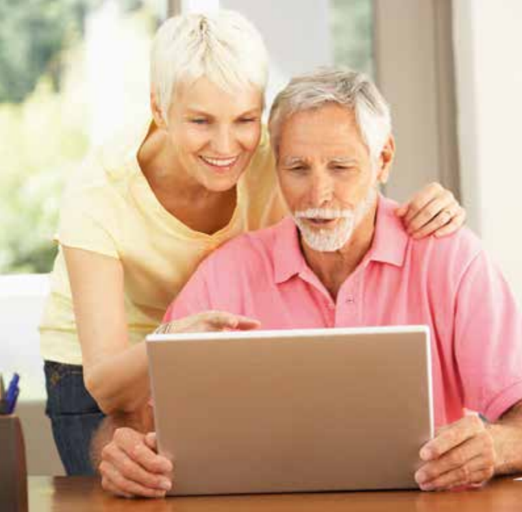
Geistig fit bleiben – eine wichtige Voraussetzung ist eine ausreichende Vitamin-Versorgung.

ler anlässlich eines Symposiums der Gesellschaft für Biofaktoren e.V. (GfB) in Berlin hin. Insbesondere die B-Vitamine sind für die reibungslose Funktion der Nerven und des Gehirns unverzichtbar, sodass Defizite schwerwiegende Folgen – von Nervenschäden bis hin zu Depressionen und Demenz – haben können. Erkenntnisse der letzten Jahre zeigen, dass ausgeprägte Mangelsituationen der B-Vitamine selten sind, leichte und mittelschwere hingegen häufig. Oft werden sie aber nicht