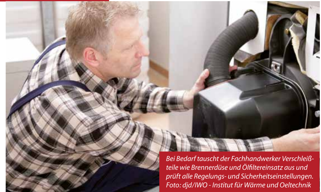
Bei Bedarf tauscht der Fachhandwerker Verschleißteile wie Brennerdüse und Ölfiltereinsatz aus und prüft alle Regelungs- und Sicherheitseinstellungen.

Das A und O sei die Reinigung des Heizkessels. Denn Ablagerungen auf den Wärmetauscherflächen würden die Wärmeübertragung auf das Heizungswasser behindern. Als Folge steigt die Abgastemperatur, und es wird unnötig Energie