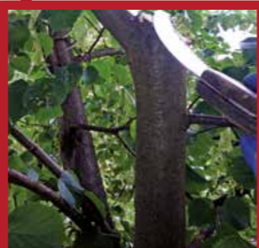
Durch den richtigen Schnittwinkel kann man einen Baum so einkürzen, dass der verbleibende Teil weiterhin optimal versorgt ist.