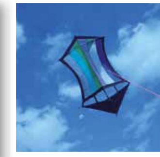
Möhnesee Seite 36