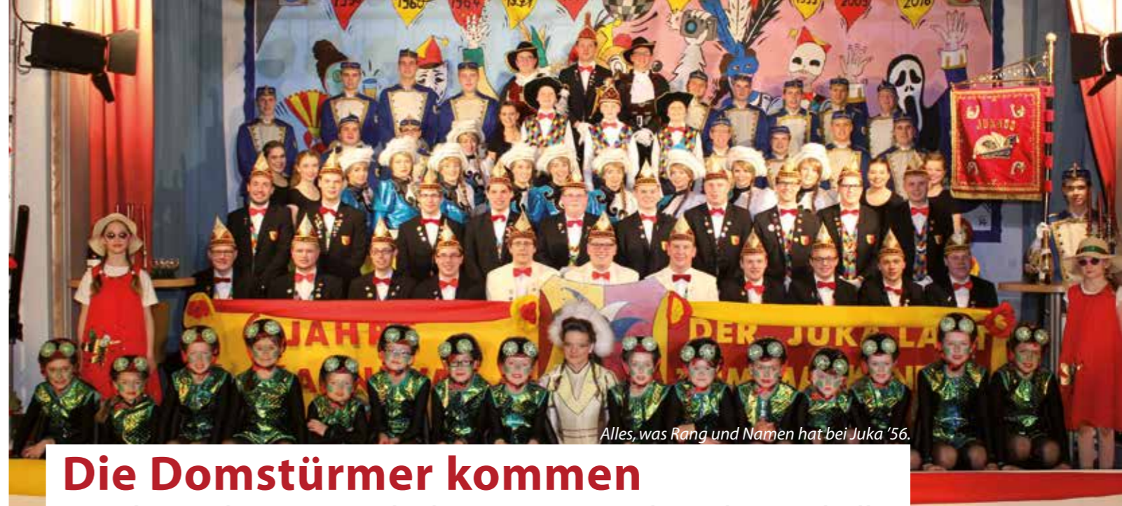
Alles, was Rang und Namen hat bei Juka '56.