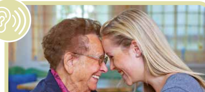
Sprechen, Hören, sozial aktiv: Hörsysteme verbessern die Leistungsfähigkeit des Gehirns und verringern das Risiko einer Demenz.