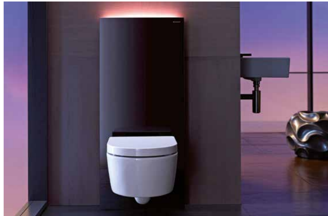
Licht und Luft: Sanitärmodul mit sanftem Orientierungslicht und integrierter Geruchsabsaugung.

betrifft, darüber entscheiden nicht zuletzt die Fliesen an Wand und Boden. Kacheln, die an Schwimmbad-Duschräume erinnern, sind ebenso wenig gefragt wie kleinteilig gemusterte Fliesenformate. Wenn Waschtisch-, Dusch-