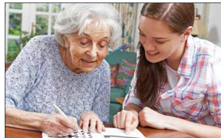
Wer gesund lebt und Risikofaktoren wie Rauchen und Bewegungsmangel meidet, hat bessere Chancen, bis ins hohe Alter geistig fit zu bleiben.