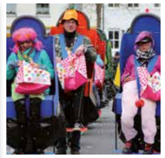
Möhnesee Seite 32