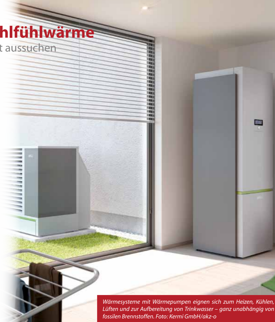
Wärmesysteme mit Wärmepumpen eignen sich zum Heizen, Kühlen, Lüften und zur Aufbereitung von Trinkwasser – ganz unabhängig von fossilen Brennstoffen.

Wärmesysteme mit Wärmepumpen eignen sich zum Heizen, Kühlen, Lüften und zur Aufbereitung von Trinkwasser – ganz ohne fossile Brennstoffe wie Kohle, Öl und Gas. Das spart Geld und schont die Umwelt: Vor allem in Kombination mit einer Photovoltaikanlage lassen sich die Betriebskosten durch den eigenerzeugten Strom zusätzlich deutlich senken. Heizsysteme, die einen maßgeblichen Beitrag zur Senkung von Energieverbrauch und CO 2 -Emissionen leisten, werden außerdem