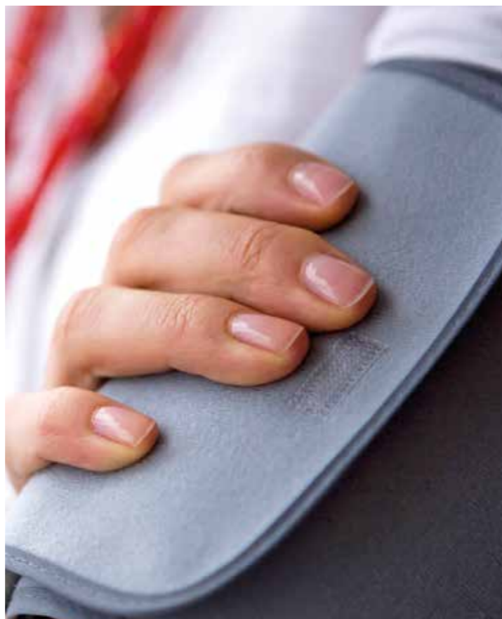
Bluthochdruck im mittleren Lebensalter ist einer der beeinflussbaren Risikofaktoren für eine spätere Demenz.

Spielen auch Nährstoffe eine Rolle? Wissenschaftler der Duke University in den USA haben