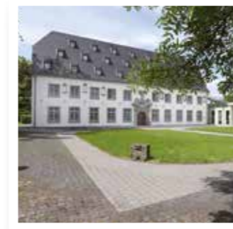
Soest Seite 5