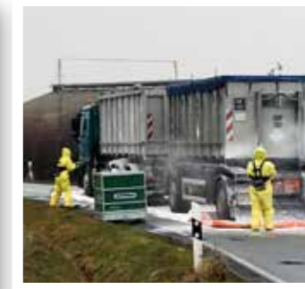
Kreis Soest Seite 17