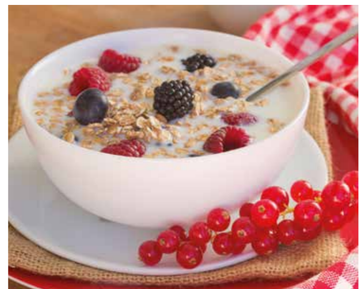
Menschen mit einem Diabetes mellitus sind besonders häufig von einem massiven Vitamin B1-Defizit betroffen. Ein leckeres Müsli mit Haferflocken und Vollkorngetreide ist eine gute Quelle für die Versorgung mit wertvollem Vitamin B1.

Was kann man zur Vorbeugung tun? Wer lange geistig fit bleiben will, sollte sich vor allem regelmäßig bewegen und nicht rauchen. Bei der Ernährung sollte auf eine gute Arginin-Versorgung geachtet werden. Wer dazu auf sein Gewicht achtet und Erkrankungen wie Bluthochdruck, Diabetes oder Depressionen konsequent behandeln lässt, hat schon viel für die Demenzvorbeugung getan.