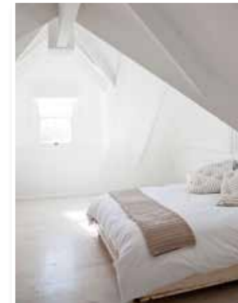
Die Investition in eine bessere Wärmedämmung kann sich für Hausbesitzer rechnen.

Anstriche, Beläge oder der Witterung ausgesetzte Holzbauteile etwa müssen meist schon nach fünf bis 15 Jahren erneuert werden. Dachrinnen, Außenverglasungen oder Heizkessel bringen