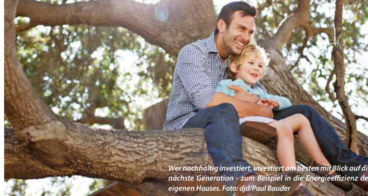
Wer nachhaltig investiert, investiert am besten mit Blick auf die nächste Generation - zum Beispiel in die Energieeffizienz des eigenen Hauses.

Wichtig bei der Planung der Dämmung ist auch, auf Materialien zu achten, die nachhaltig sind. Dazu gehören neben der Dämmleistung auch ihre Nutzungszeit und Faktoren wie Schadstoffarmut. Wer ein Haus baut, kann danach einiges erzählen. Noch spannender ist es allerdings meist, wenn eine Immobilie grundlegend saniert werden muss. Denn Altbauten bestechen zwar durch ihren