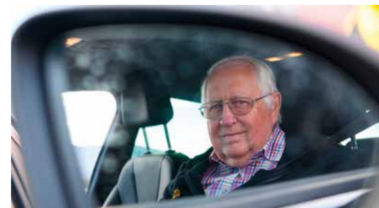
Senioren sollten sich in Sachen Fahrtüchtigkeit regelmäßig vom Hausarzt beraten lassen. Er kennt die medizinische Vorgeschichte und weiß am besten über die Gesundheit Bescheid.

das eine - das andere sind Beeinträchtigungen, die sich mit fortschreitendem Alter oft unbemerkt einschleichen und die Fahrtüchtigkeit beeinflussen können. Nachts sieht man nicht mehr so gut wie früher, der zur Gefahrenvermeidung notwendige Blick über die Schulter nach hinten fällt schwerer, weil die Beweglichkeit nachlässt. Deshalb ist es sinnvoll, sich regelmäßig ärztlich beraten zu lassen. Ein allgemeiner Gesundheits-Check, den man alle zwei Jahre durchführen lassen kann, ist ein guter Anlass, um auch das Thema Fahrtüchtigkeit anzusprechen. Mit dem Ziel, die Fahrfitness zu verbessern, sollten Hör- und Sehvermögen, Reaktionsgeschwindigkeit, Beweglich-