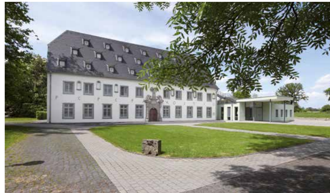
Das Kloster Paradiese: Heimat von Protatlinik, Tagesklinik und der onkologischen Praxis.

Zusammenarbeit mit Soester Krankenhäusern: „Starkes Zeichen der Krebsbehandlung“ für den Standort Soest