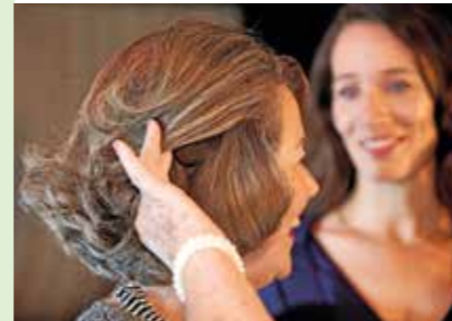
Wer sich bei Gesprächen unwohl fühlt oder oft nachfragen muss, sollte durch einen Hörspezialisten die Notwendigkeit eines Hörgerätes oder Implantates abklären lassen.

Für viele Autofahrer ist das Thema Sehtest mit der Überprüfung vor dem Führerscheinwerb erledigt, besonders die Nicht-Brillen-träger lassen ihre Augen viel zu selten oder gar nicht mehr testen. Unabhängig von der Forderung nach einem verpflichtenden Wiederholungssehtest empfiehlt der ZVA daher eine jährliche Überprüfung der Sehleistung beim Augenoptiker oder Optometristen. (djd).