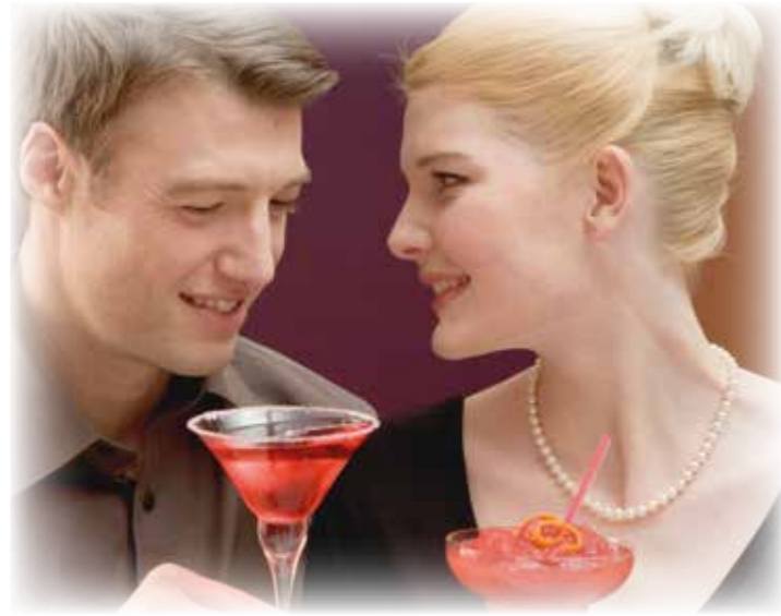
Gemeinsame Zeit ist das größte Glück für Verliebte.

Am 14. Februar ist Valentinstag: Zu schön, um nicht zu feiern