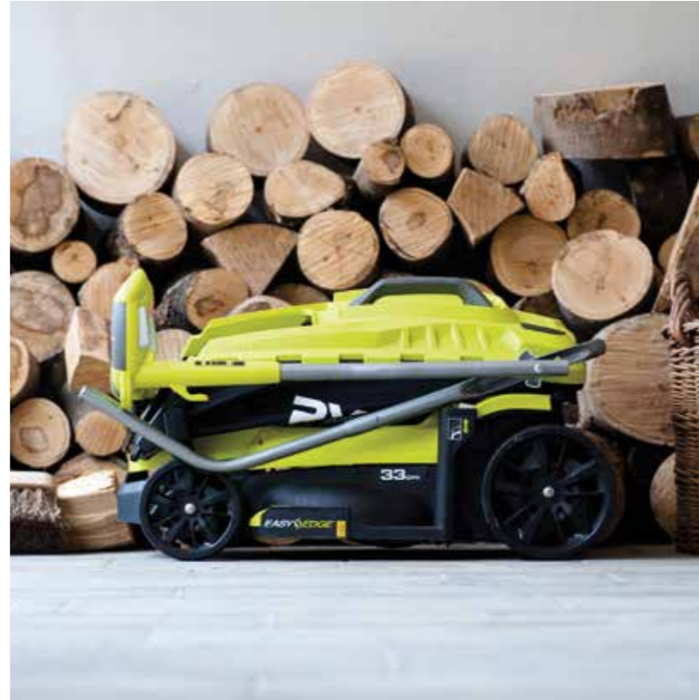
Ein moderner, kompakter Rasenmäher lässt sich zusammenklappen und platzsparend bis zum nächsten Einsatz lagern. Nun ist die Zeit für die Inspektion und die Vorbereitung der kommenden Gartensaison.

Hinsichtlich Pflege und Wartung haben die Varianten unterschiedliche Bedürfnisse. Elektrorasenmäher sind dabei nicht so anspruchsvoll wie die Kollegen mit Benzinmotor. Elektromotoren laufen in der Regel wartungsfrei. Sie benötigen weder einen Ölwechsel, noch muss der Füllstand überprüft werden. Die Messer sollten hin und wieder nachgeschliffen werden, damit das Schnitt-Ergebnis auch den Ansprüchen der Nutzer genügt. Am besten lassen Garten-Besitzer die Messer maschinell vom Profi schneiden – beispielsweise bei Händlern, die sich auf Gartengeräte spezialisiert haben.