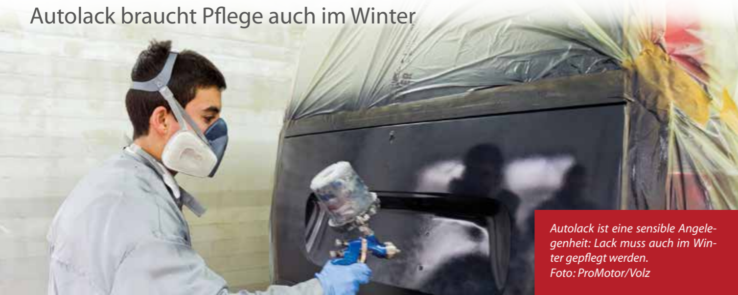
Autolack ist eine sensible Angelegenheit: Lack muss auch im Winter gepflegt werden.

Der Lack, die „Haut“ unserer Autos, soll das Blech bei Wind und Wetter vor Umwelteinflüssen und Korrosion schützen. Momentan genügen schon kurze Fahrten über feuchtschmutzige und gestreute Straßen, damit die Karosserie blickdicht unter einer dichten Salz- und Schmutzschicht verschwindet. Das sieht unschön aus und kann auch dem Lack schaden. Daher gilt: Die Kruste muss runter!