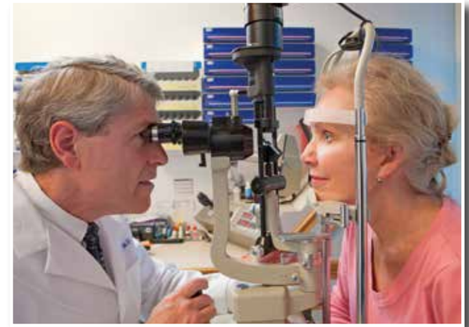
Wer Symptome wie eine erhöhte Blendempfindlichkeit oder ein nachlassendes Kontrastsehen bemerkt, sollte einen Augenarzt aufsuchen.

Ein äußerst wichtiges Sinnensorgan ist auch das Auge. Weltweit gibt es derzeit rund 39 Millionen sehbehinderte Menschen. Nach Schätzungen der WHO sind 80 Prozent aller Sehbehinderungen vermeidbar oder heilbar. Das gilt auch für eine der häufigsten Erblindungsursachen in