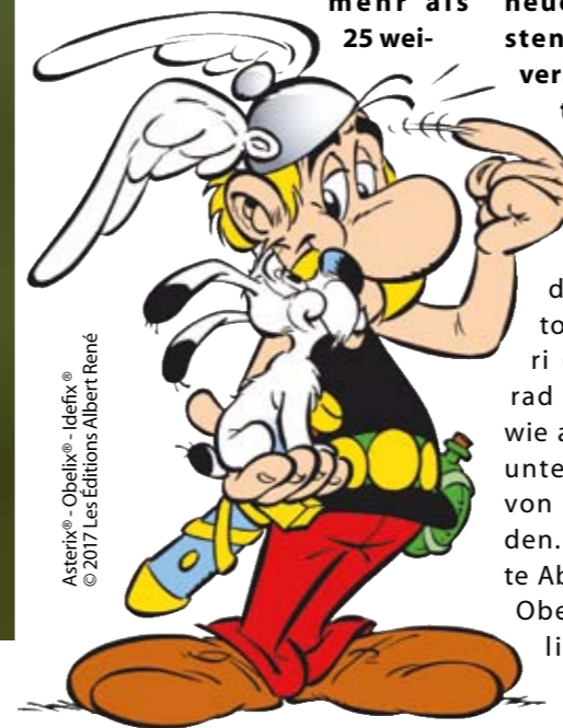
Asterix - Obelix - Idéfix © 2017 Les Éditions Albert René

teren Ländern. Natürlich hagelt es auch in „Asterix in Italien“ wieder Backpfeifen und blaue Augen. Mit etwas Glück können Sie das neue Abenteuer ganz kostenlos erleben, denn wir verlosen 18 exklusive „Asterix“ Egmont Ehapa Media Hardcover-Ausgaben!