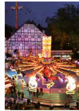
Soest Seite 4 Der Weg hinauf In den Kirmes-Himmel