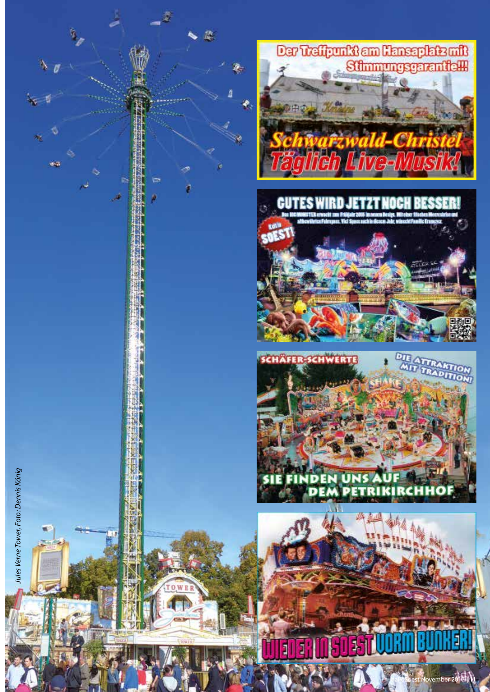
Jules Verne Tower