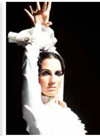
Werl Seite 42 Kleinkunsttage mit Flamenco, Cabaret