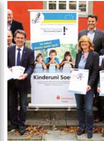
Soest Seite 40 Soester Kinder-Uni Wieder am Start