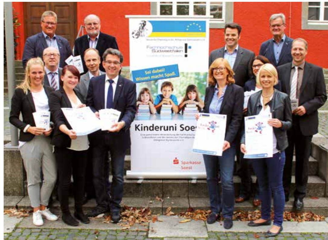
Wissen macht Spaß! Die Organisatoren der Kinder-Uni von Stadt, Aldegreviergymnasium und Fachhochschule Südwestfalen präsentieren jetzt das Programm für das Wintersemester 2017/18. Anmeldungen für die Seminare sind ab sofort möglich über das Sekretariat des Aldegrevier-Gymnasiums in Soest.