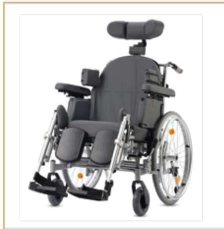
Pflegerrollstühle ab 799,- EURO