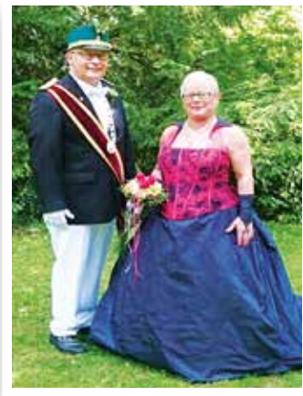
Seite 12 „Vereinigter“ feiert in Ost und West gemeinsam