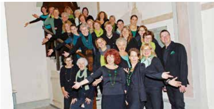
Der Frauenchor tonArt freut sich auf ihren Besuch bei der Landpartie 2018.