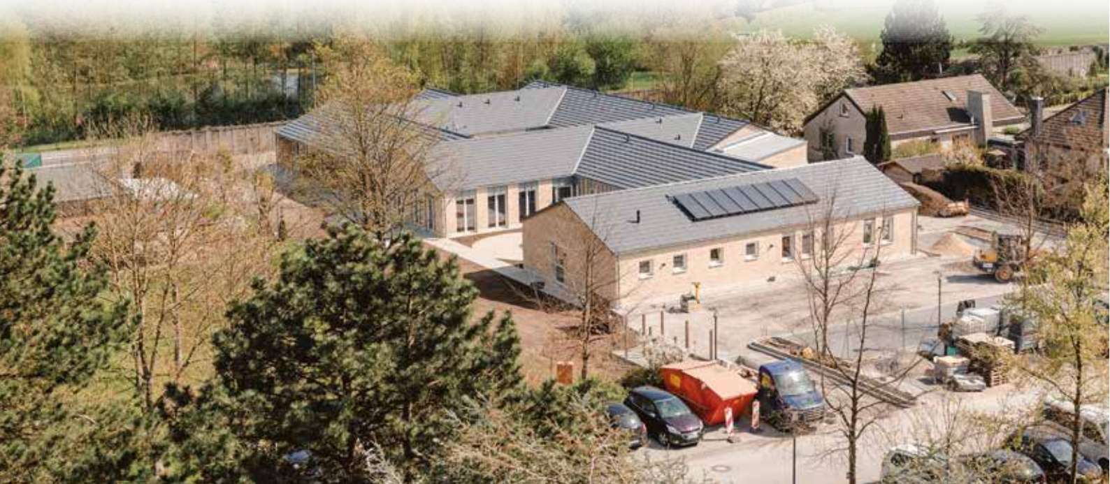
Das Hospiz für den Kreis Soest hat den Betrieb aufgenommen, zunächst werden fünf Gäste in den neuen Räumen betreut.

Christliches Hospiz in Soest nach 30-jähriger Planungs- und Ideenphase eröffnet: „Außerordentliches Werk“