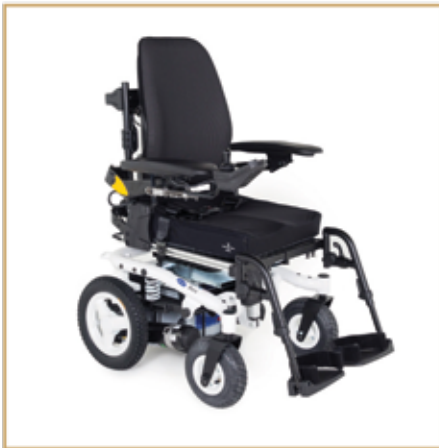
Elektrorollstühle ab 1899,- EURO