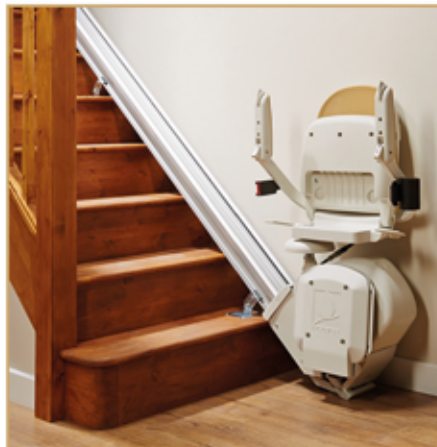
Treppenlifte ab 2499,- EURO