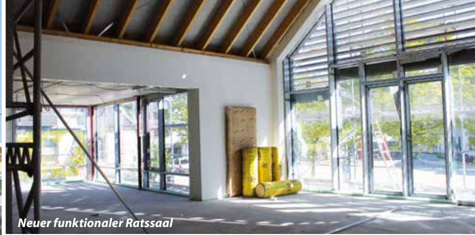
Neuer funktionaler Ratssaal