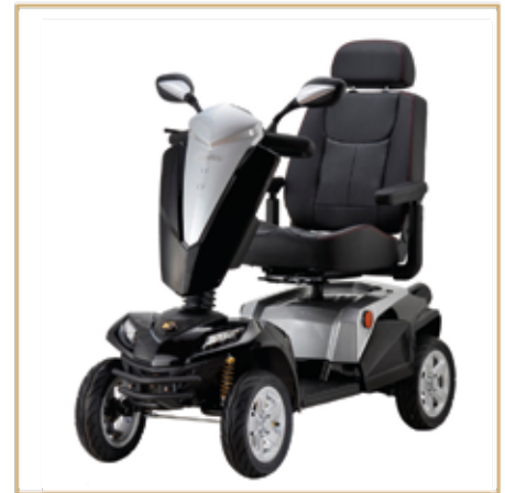
Elektromobile ab 1199,- EURO

Alles, was Sie brauchen, unter einem Dach!