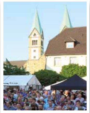
Seite 30 Siederfest lockt mit Musik nach Werl