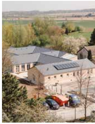
Seite 4 Hospiz nimmt in Soest die Arbeit auf