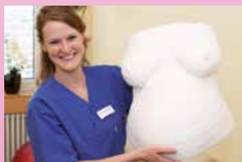
Ein Gipsabdruck vom Babybauch: Solche Erinnerungen können auch bei der Messe wieder kostenlos erstellt werden.

Hunger frisch gebackene Waffeln und Würstchen vom Grill. Hinweis: Die Terminvergabe für Babykino (Ultraschall), Gipsbäuche und Babymassage startet bereits um 10.45 Uhr.