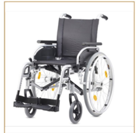
Rollstühle ab 185,- EURO