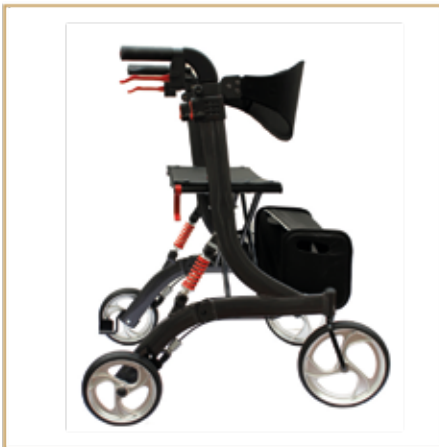
Rollatoren ab 149,- EURO

ELEKTROMOBILE ♦ ROLLATOREN ♦ TREPPENLIFTE ♦ ELEKTROLLSTÜHLE ♦ MANUELLE ROLLSTÜHLE ♦ SAUERSTOFFKONZENTRATOREN