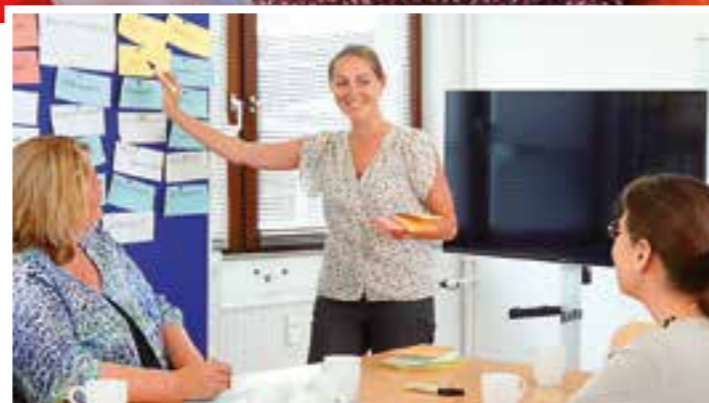
Qualifizierte Fortbildungen sind auch für Fach- und Führungskräfte ein wichtiges Thema.

Wohlfahrtsverbände sind zum Beispiel auf allen Gebieten der sozialen Arbeit und des Gesundheitswesens tätig und bieten professionelle soziale Hilfs- und Beratungsangebote für Men-