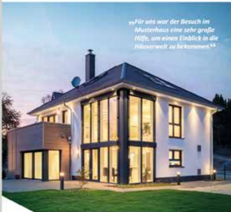
Einführung zum FAVORIT Massivhaus-Musterhaus.

„Für uns war der Besuch im Musterhaus eine sehr große Hilfe, um einen Einblick in die Häuserwelt zu bekommen.“