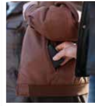
Seite 4 Spendensammeln als Abzock-Masche