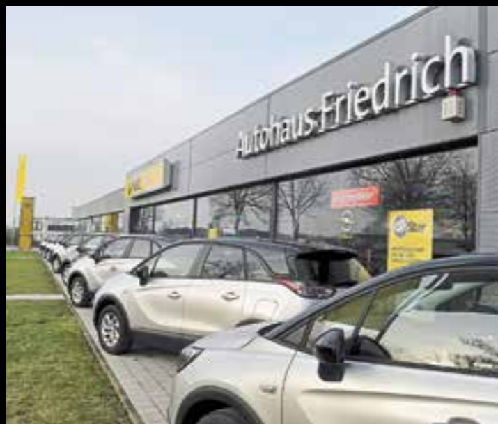
- Anzeige -

Ihr alter Diesel soll weg? Wenn Sie vom Euro 1 bis 4-Fahrzeug auf einen schicken, neuen Opel umsteigen möchten, dann sollten Sie Autohaus Friedrich in Anröchte einen Besuch abstatten.