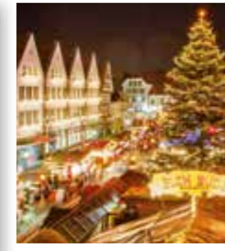
Seite 6 Soester Weihnachtsmarkt einer der schönsten im Lande