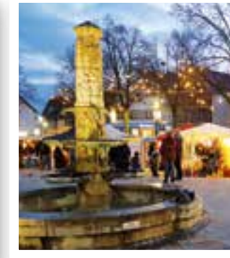
Seite 32 Besinnlicher Treffpunkt zum Körbecker Kerzenzauber