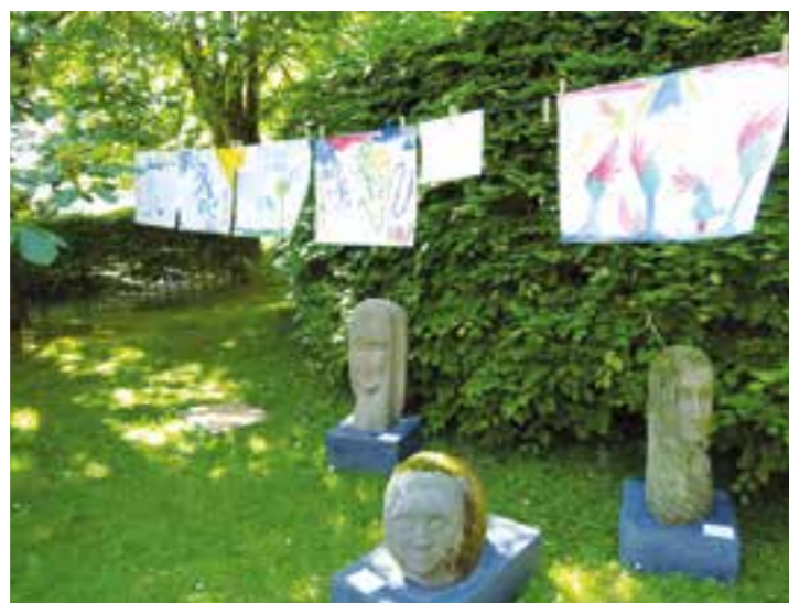
Ein Event für die ganze Familie!

Ein geschichtsträchtiger Ort mit Ambiente, engagierte Initiatoren und hochklassige Unterhaltung: Dies sind die Zutaten für „Westfalens kleinstes Festival“, das am Pfingstweekenende 2019 – vom 8. bis 10. Juni – in Drüggelte am Möhnesee stattfindet.