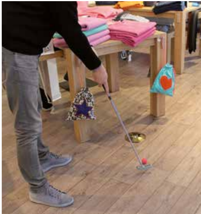
Beim 2. Sälzer-Golf in Bad Sassendorf darf in Geschäften gespielt werden.

Golfen zwischen Kleiderständen – das ist am Freitag, 15. März, in 18 Geschäften in Bad Sassendorf möglich. An diesem Tag lädt die Bad Sassendorfer Kaufmannschaft alle, die am Minigolf- oder Golf-Spiel Spaß haben, zum 2. Sälzer-Golf ein.