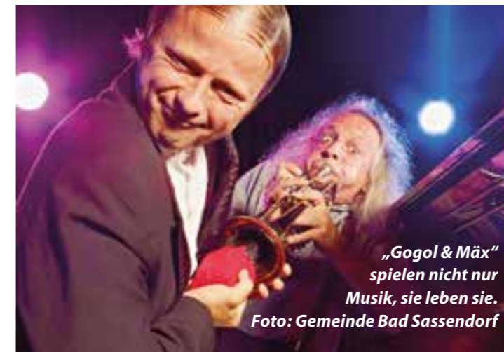
„Gogol & Mäx“ spielen nicht nur Musik, sie leben sie.

Gemeindegewerke Bad Sassendorf GmbH & Co. KG, Eichendorffstr. 1, 59505 Bad Sassendorf Tel. 02921/50581 • Fax 02921/505981 E-Mail: gemeindegewerke@bad-sassendorf.de • www.gw-bad-sassendorf.de