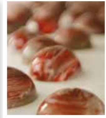
Seite 31 Traumberuf Schokoladen- Sommelière