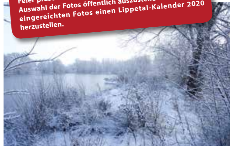
Landschaften wie diese wären ein Motiv, das zum Foto-Wettbewerb „Lippetaler Lieblingsplätze“ eingereicht werden kann.

Preisgelder winken! Die Sparkasse Soest-Werl stiftet Preisgelder. Die drei besten Fotos jeder Kategorie werden wie folgt prämiert: 3. Platz 100 Euro, 2. Platz 200 Euro, 1. Platz 300 Euro. Eine Auswahl der eingereichten Fotos wird während der Feier präsentiert. Weiterhin ist geplant, im Herbst eine Auswahl der Fotos öffentlich auszustellen und aus den eingereichten Fotos einen Lippetal-Kalender 2020 herzustellen.