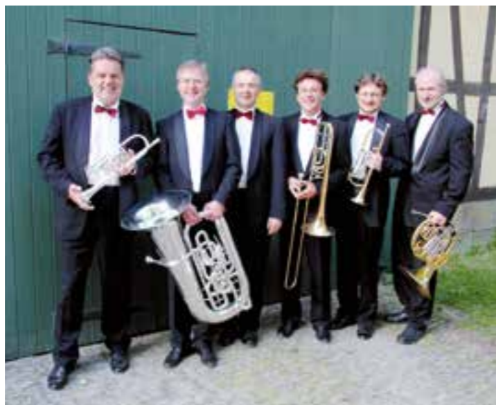
Zum 30. Mal dabei: die Leipziger Blechbläser Solisten

Zu Beginn der Veranstaltungsreihe war man in Drüggelte noch ziemlich experimentell, die ersten Kunst-Stückchen hatten noch ziemlichen Impro-Charakter. Auch wenn jedes Jahr das Programm unterschiedlich sein soll, gibt es seit der ersten Auflage immer eine Konstante: den Auftritt der Leipziger Blechbläser Solisten. Direkt nach der Wende ein Ensemble aus dem Osten an Bord zu haben, freute die Veranstalter. „Es ist ein Welt-