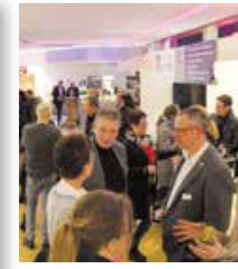
Seite 22 MeTa in Ense