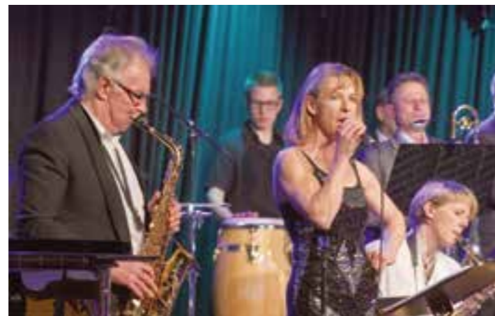
Die John Holmes Big Band gehört zu den Künstlern, die im Schlachthof auftreten.

Junge und Junggebliebene, Großeltern, Eltern und Enkelkinder, kurz, Menschen aller Generationen bilden in Soest eine große Jazz-Familie und spielen teilweise auf der gleichen Bühne zusammen. Am Samstag, 9. März, steht das Kulturhaus Alter Schlachthof wieder ganz im Zeichen des Jazz, wenn um 19 Uhr die 42. VHS Jazz Nacht beginnt.