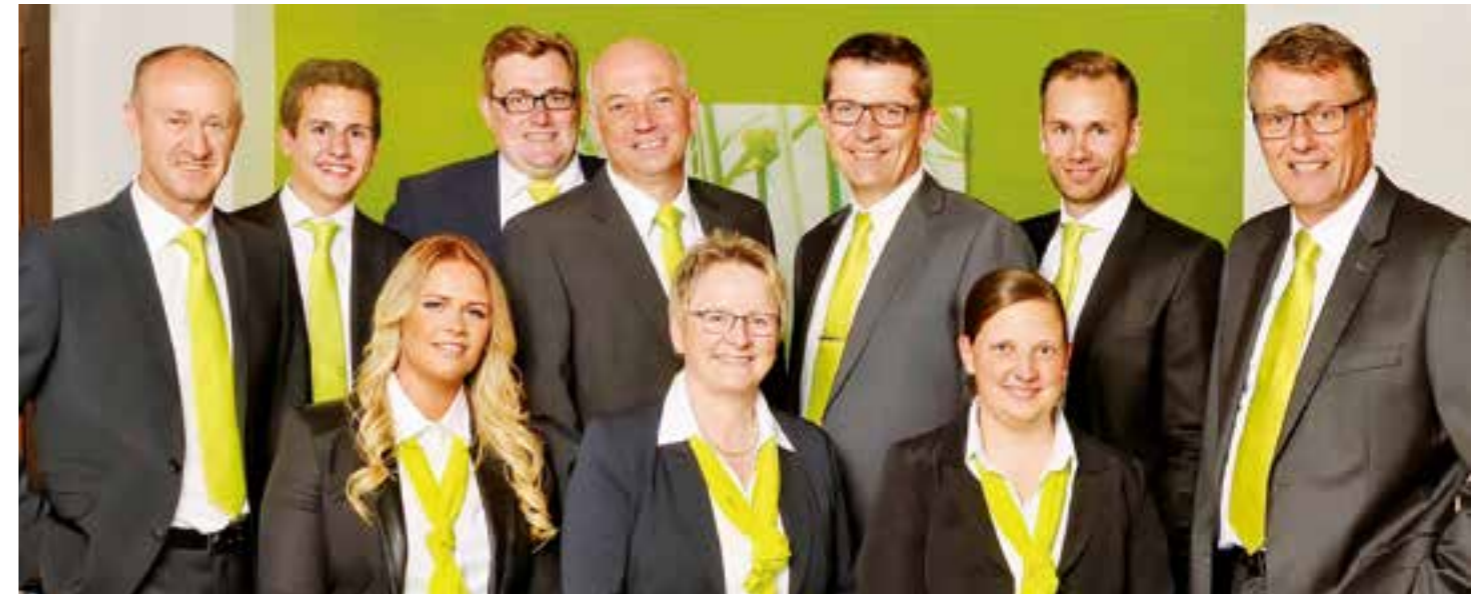
Das Team der LVM-Versicherungsagentur Nillies freut sich auf Ihren Besuch.

für unsere Kunden da. Wir übernehmen die Schadensdokumentation und vermitteln auf Wunsch auch Handwerker, damit so schnell wie möglich Abhilfe geschaffen werden kann.