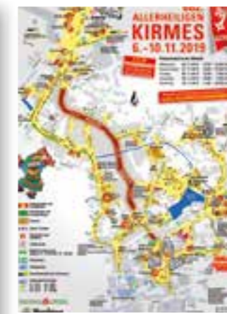
Seite 32 Kirmesplan