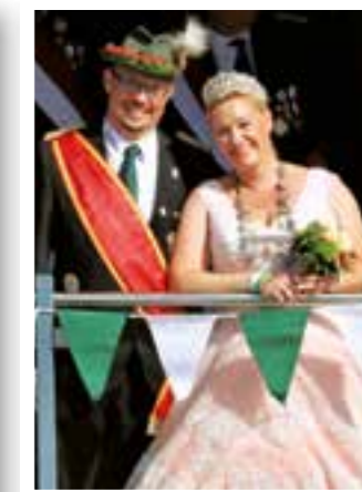
Seite 54 Wamels Schützenheldin