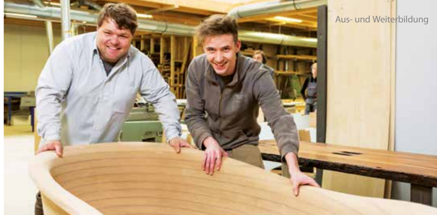
Aus- und Weiterbildung

Mit Händchen und Köpfchen Als Azubi zum Tischler sollte man vor allem geschickte Hände, technisches Verständnis und Kreativität mitbringen. Auch Kontaktfreude ist wichtig, denn der Kundenkontakt ist unerlässlich. Gute Mathe-Kenntnisse und Sorgfältigkeit gehören ebenfalls zu den Grundvoraussetzungen, schließlich sollen die Produkte am Ende auch Maß genau passen. Das erste Jahr der Ausbildung zum Tischler findet meistens als Berufsgrundbildungsjahr im Voll-