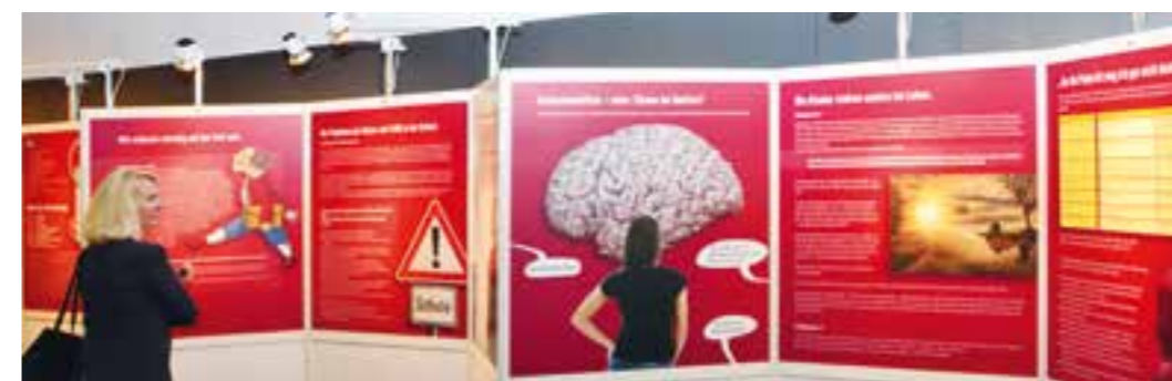
Die Ausstellung „FASD und Pflegefamilie-Kinder mit fetalem Alkoholsyndrom besser verstehen“ ist vom 5. bis 15. November im Kreishaus in Soest zu sehen.

„Stopp! Kein Alkohol während der Schwangerschaft“ heißt es auf Flyern und Plakaten. Denn „bereits ein Glas Alkohol während der Schwangerschaft kann Schädigungen beim Kind verursachen“. Daher hat der Kinderschutzbund im Kreis Soest jetzt eine große Aufklärungskampagne gestartet.