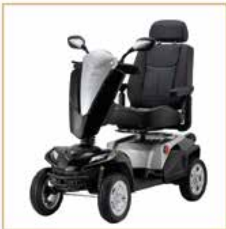
Elektromobile ab 1199,- EURO

Fragen Sie uns auch nach gebrauchten Elektromobilen!