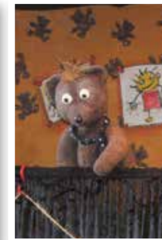
Seite 11 WDR KiRaKa in Ense