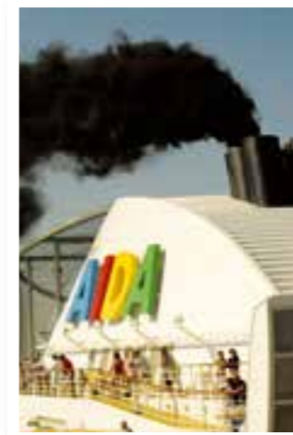
Seite 4 Hilfe, die Kreuzfahrer kommen