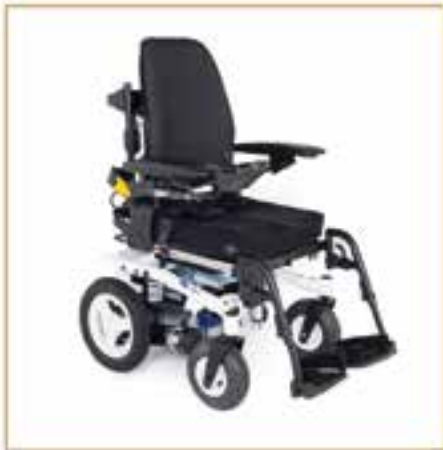
Elektrollstühle ab 1899,- EURO