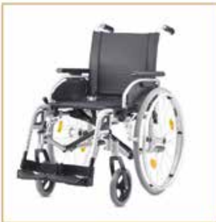
Rollstühle ab 189,- EURO