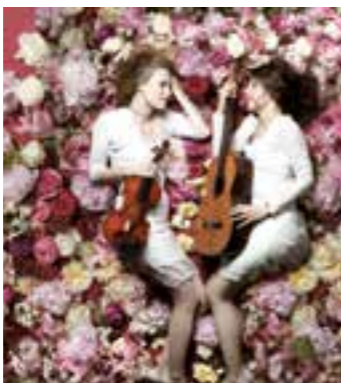
Das Duo Aciano.

Besondere musikalische Leckerbissen samt künstlerischem Rahmenprogramm locken an Pfingsten große und kleine Kulturliebhaber auf den Hof Schulte-Drüggelke an den Möhnesee.