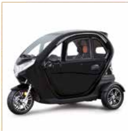
Elektroscooter ab 1999,- EURO