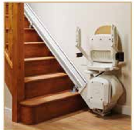
Treppenlifte ab 2749,- EURO