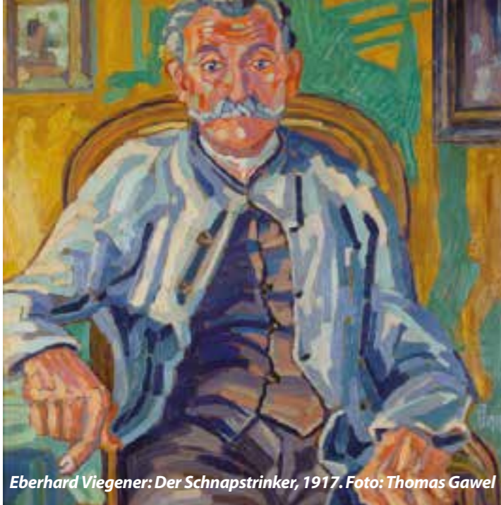
Eberhard Viegner: Der Schnapstrinker, 1917.