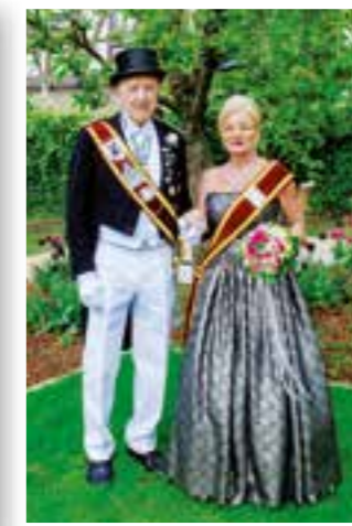
Seite 6 Soester Bürger-Schützen feiern