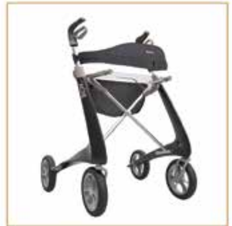
Rollatoren ab 149,- EURO

Alles, was Sie brauchen, unter einem Dach! BEARATUNG ♦ PRODUKTE ♦ REPARATUREN ♦ INSPEKTIONEN