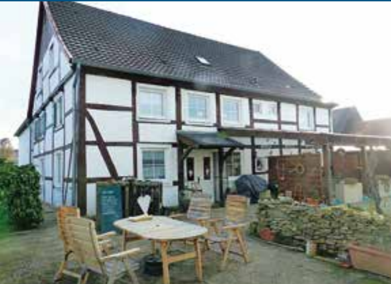
Charmantes Fachwerkhaus mit Nebengebäuden zu verkaufen.

Ihr professioneller Ansprechpartner in Immobilienangelegenheiten