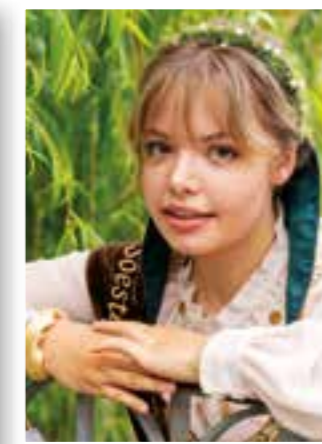
Seite 34 Neue Bördekönigin