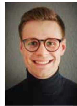
Seite 4 Exklusiv Schützenforscher