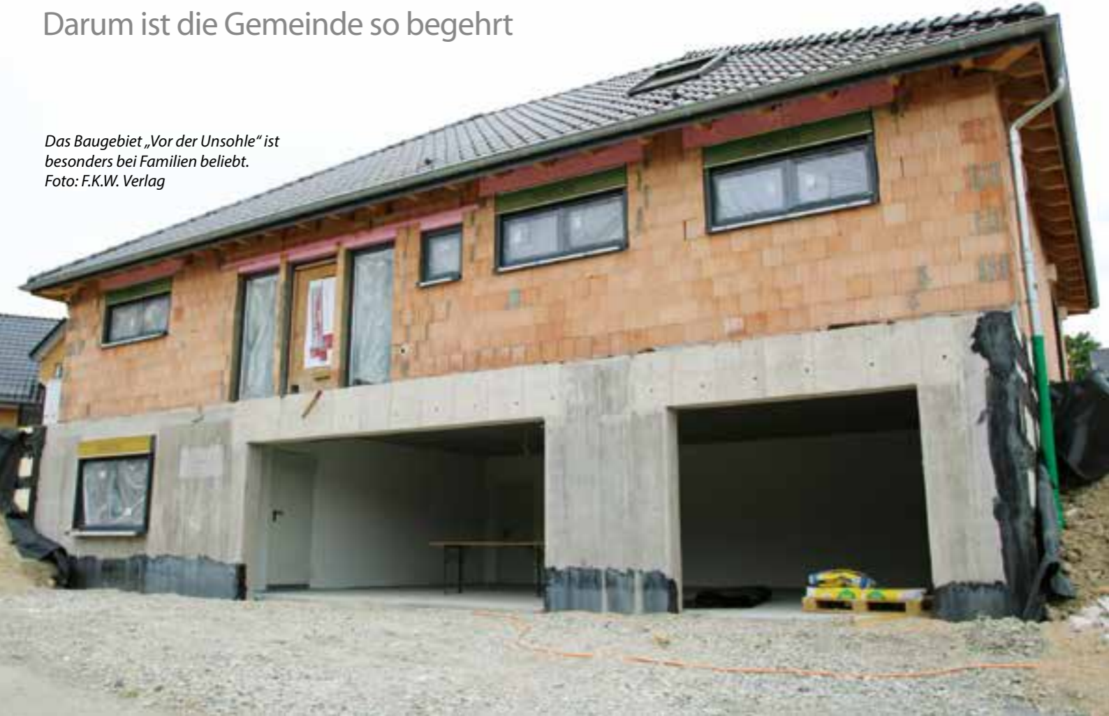
Das Baugebiet „Vor der Unsohle“ ist besonders bei Familien beliebt.

Bauland ist heiß begehrt. Aktuell sind wenige Grundstücke und Immobilien auf dem Markt. Die Eigentümer verkaufen nur ungern, da sie Strafszinsen für die Verkaufserlöse zahlen müssen. Warstein ist eine sehr beliebte Stadt. Warum das so ist und wie die Lage für Bauherren aussieht, hat uns das Rathaus verraten.