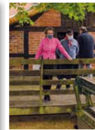
Seite 39 Infozentrum für Heimatgeschichte