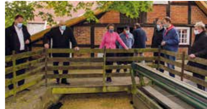
Ministerin Ina Scharrenbach besichtigte den Gebäudekomplex „Stüttings Mühle“ in Warstein-Belecke, an dem der Kultur- und Heimatverein Badulikum aktuell ein Informationszentrum für Heimatgeschichte einrichtet.

Das hat man auch nicht alle Tage: Mit Salutschüssen der Belecker Sturmtagkanoniere wurde Ina Scharrenbach, Ministerin für Heimat, Kommunales, Bau und Gleichstellung des Landes NRW, begrüßt. Im September hatte das Ministerium eine großzügige Zuwendung aus dem Förderprogramm „Heimat-Zeugnis“ bewilligt.