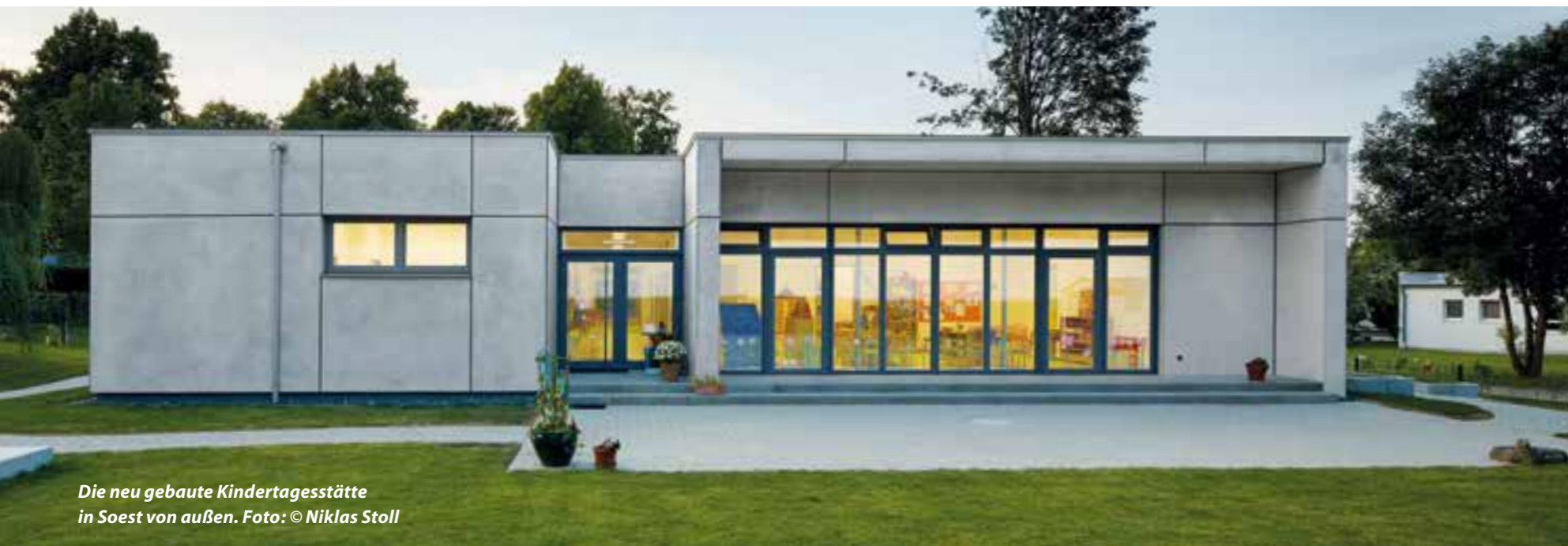
Die neu gebaute Kindertagesstätte in Soest von außen.