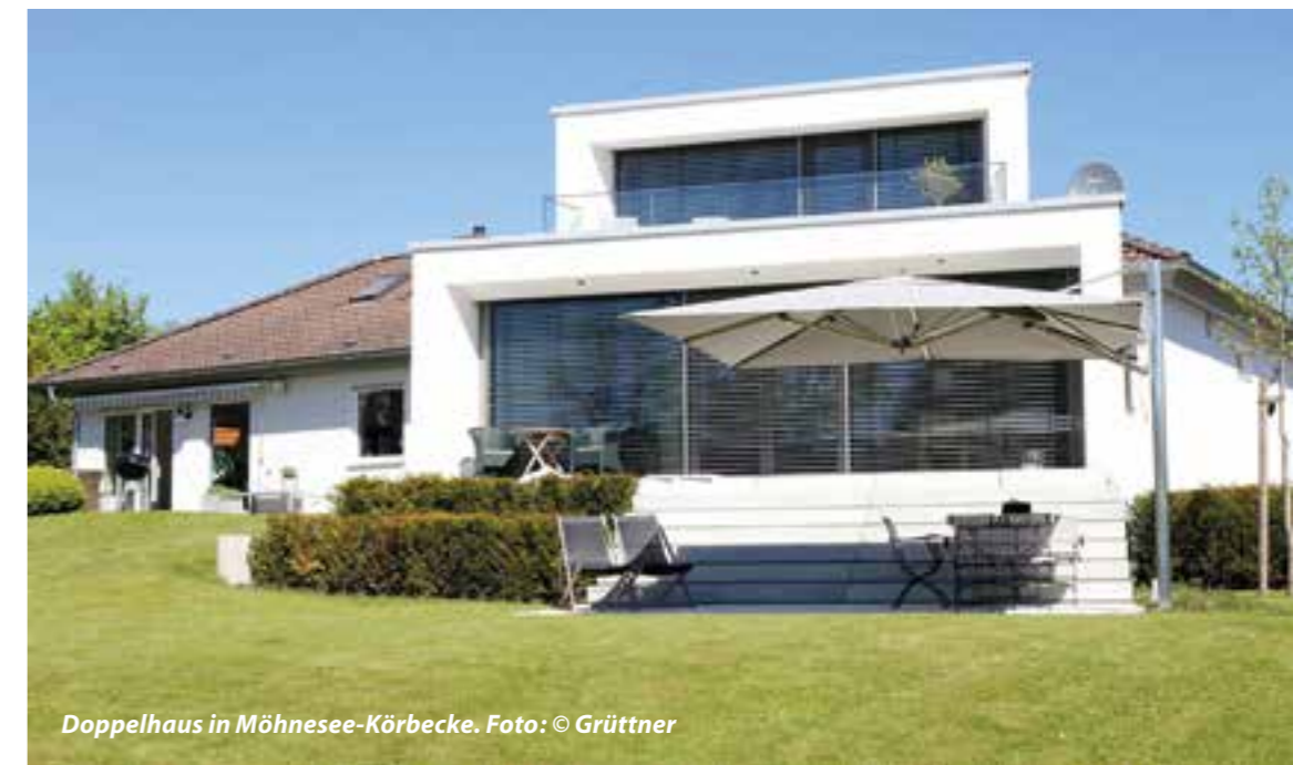
Doppelhaus in Möhnese-Körbecke.