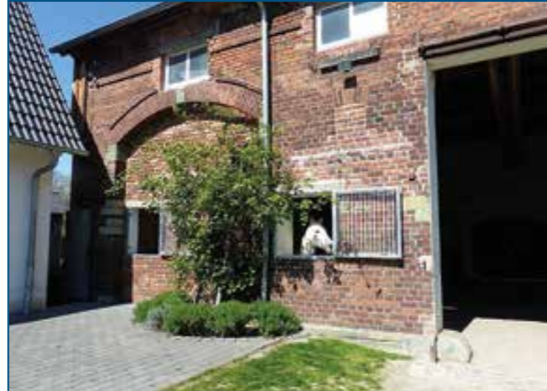
Traumhafter Reiterhof durch Immobilien Jablonski erfolgreich vermarktet.

Seit über 45 Jahren ist das Team von der Immobilien Jablonski GmbH auf dem Immobilienmarkt im Kreis Soest aktiv. Sie sind Ihre Spezialisten für den Verkauf, die Vermietung sowie die Verwaltung von Immobilien.