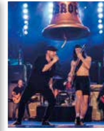
Seite 7 Verlosung Stadthalle