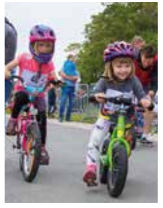
Seite 19 Kinder-Fun-Triathlon