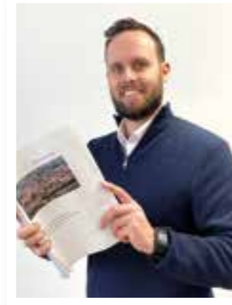
Seite 4 Klimaschutzbeauftragter Soest