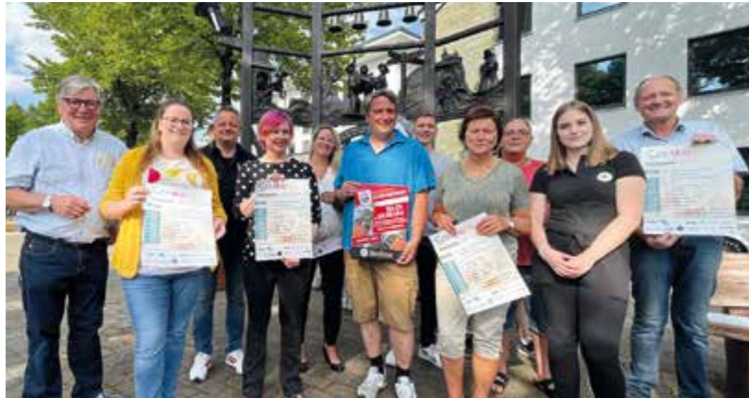
Die Warsteiner Dieplohgemeinschaft veranstaltet auch in diesem Jahr wieder die Veranstaltungsreihe „Sommer im Dieploh“.