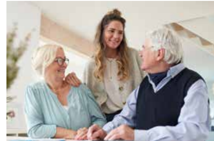
Mit Unterstützung der Eltern ins eigene Traumhaus: Um Kindern die Finanzierung einer Immobilie zu erleichtern, gibt es verschiedene Möglichkeiten.

Die Preise für Immobilien steigen weiter, auch Baufinanzierungen werden teurer. In der Folge sehen viele ihren Traum vom Eigenheim bedroht. Doch es gibt Möglichkeiten, wie Kaufwillige die Rahmenbedingungen ihrer Finanzierung verbessern können – auch ohne Kapitalaufstockung.