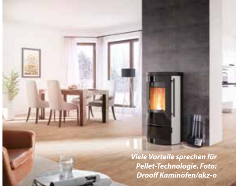
Viele Vorteile sprechen für Pellet-Technologie.

- Nachts die Rollläden schließen. Tagsüber kann solare Einstrahlung durch Fenster zur Wärmegewinnung genutzt werden.