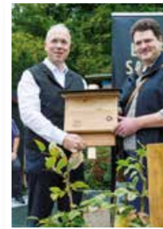
Seite 4 Wildpark Völlinghausen