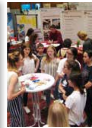
Seite 21 Aktionstag Arbeit und Ausbildung