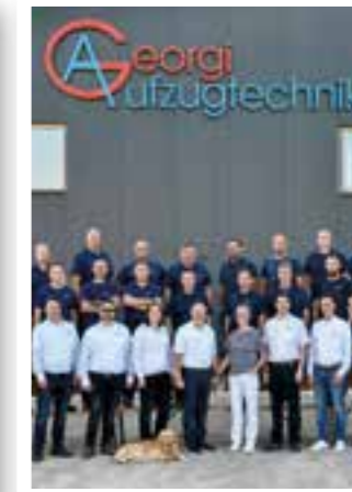
Seite 22 Jubiläum bei Georgi Aufzugtechnik