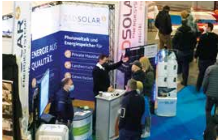
Legden 2020.

Lippstädter Bautage und Hochzeitsmesse in der Südlichen Schützenhalle