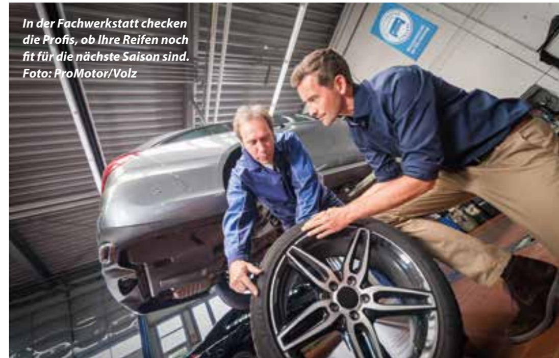
In der Fachwerkstatt checken die Profis, ob Ihre Reifen noch fit für die nächste Saison sind.

Um den Wagen auf die kalte Jahreszeit perfekt vorzubereiten, sollten Sie nicht nur einen intensiveren Blick auf Kraftstofffilter, Klimaanlagefilter, Ölfilter