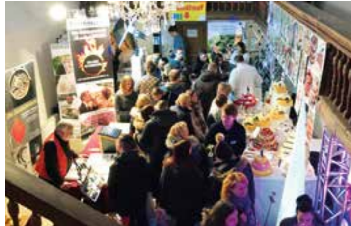
Hochzeitsmesse Herten 2019 (Archiv).

viele Anregungen und passende Ansprechpartner zu diesen Fachbereichen finden sich an dieser Wochenende in Lippstadt. So geht es beim Thema Hausbau um Massivhäuser, Energiesparhäuser, individuelle Fertighäuser, Holzhäuser, Architektenhäuser bis hin zu Anbau oder Aufstockung. Neueste Entwicklungen im Bereich der Photovoltaik, der Sicherheitstechnik, in der Elektromobilität, beim Wintergarten oder den Bauelementen sind wichtige Themen. Es