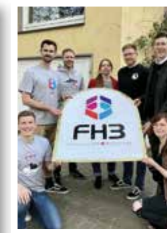
Seite 34 3. Stern für „We love Warstein“