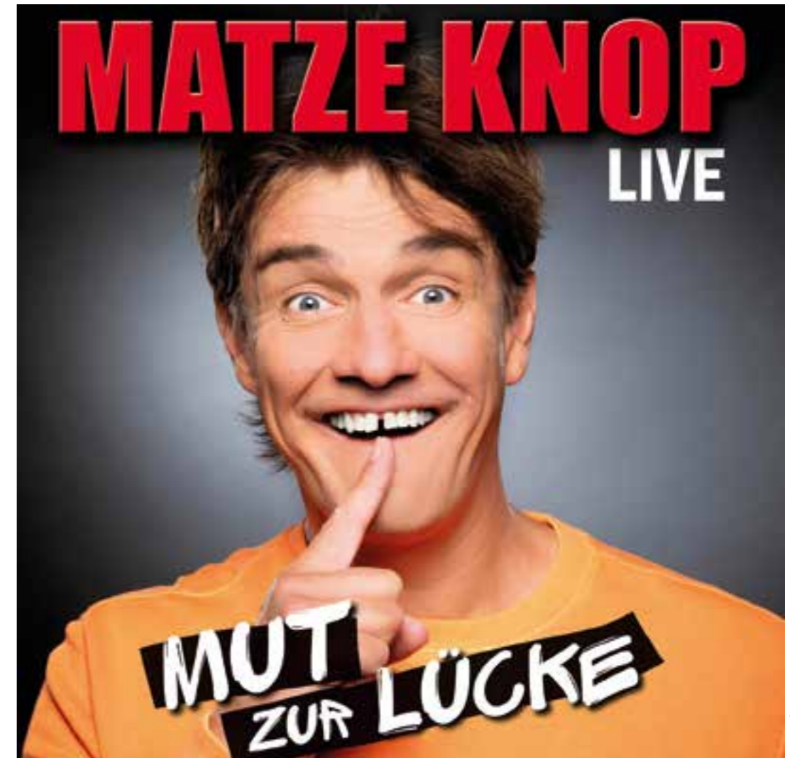
Pressfoto: Matze Knop

Dort nimmt er die Absurditäten des Alltags, die Tücken der Technik und die Peinlichkeiten von Promis und Politikern scharfsinnig auf die Schippe und liefert erneut ein großartiges Live-Entertainment-Programm. Natürlich dürfen auch Matzes Kult-Parodien nicht fehlen. Von Fußballstar Christiano Ronaldo über Bundestrainer Jogi Löw, dem Kult-Kloppo bis hin zu Dieter Bohlen – alle sind auch im neuen Programm wieder mit dabei. Wann? Samstag, 21. Januar 2023, 20.00 Uhr im Tagungs- und Kongresszentrum (TuK). Tickets sind im Vorverkauf erhältlich ab 36,50 Euro in der Gäste-Information Bad Sassendorf, über www.hellwegticket.de und bei den Vorverkaufsstellen der Sparkasse SoestWerl sowie über www.eventim.de .