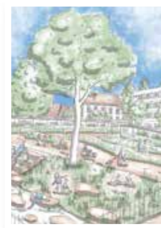
Seite 4 Grüneres Soest