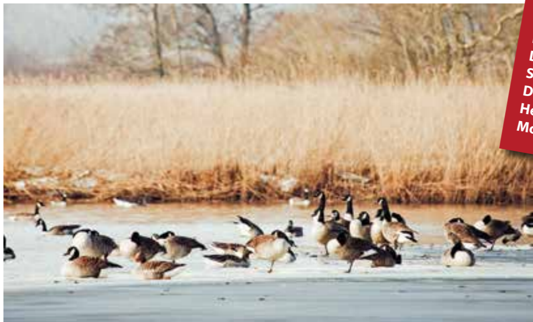
Beeindruckende Naturschauspiele am Ostseefjord Schlei.

Eine winterliche Reise nach Schleswig und Umgebung