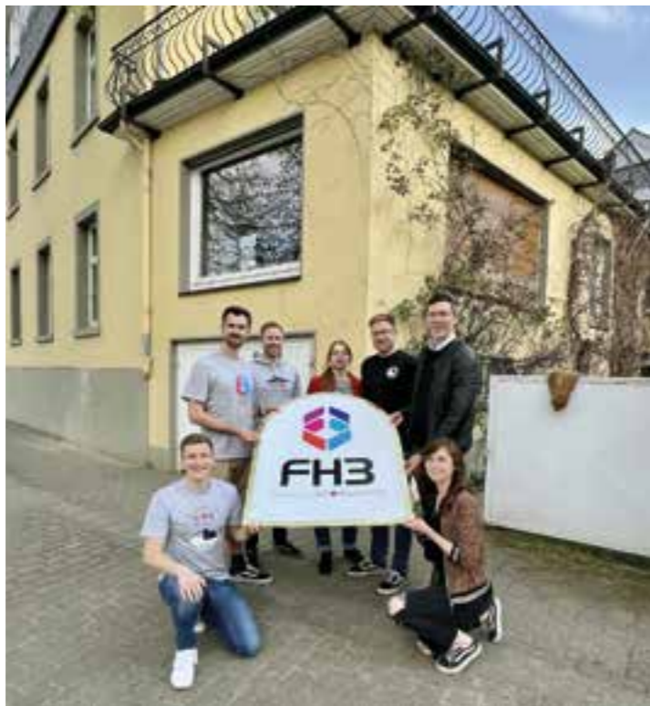
Die Initiator:innen des Vereins „We love Warstein“ freuen sich über den dritten Stern in der REGIONALE 2025.