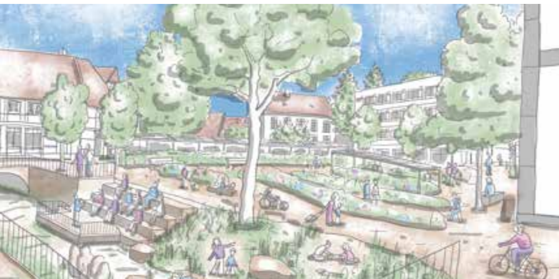
Statt Parkplatz soll am Kohlbrink Platz u.a. für eine Kleinkunsthöhle, Beete und Bänke entstehen. Barrierefrei und für alle Generationen. Grafiken: Michaela Ruhfus

Fragen Sie sich gerade, was das Grimm'sche Märchen mit Grün zu tun hat? Was eine „Hans-im-Glück-Kultur“ überhaupt sein soll? Und wo genau es in Soest an Natur mangeln soll? Dann schauen wir Sie nun über eine Initiative auf, die sich für Flächenentsiegelung und mehr Miteinander im Stadtkern einsetzt.