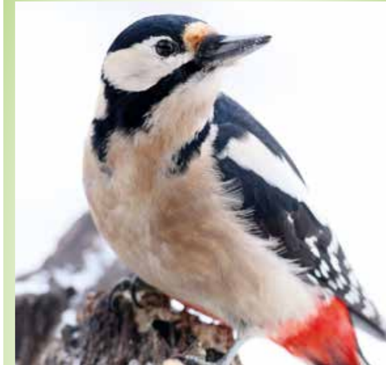
Mag Zapfen, Samen und Nüsse: der Buntspecht.

Deutschlands größte Vogelzählung startet wieder