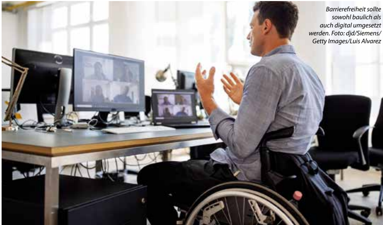
Barrierefreiheit sollte sowohl baulich als auch digital umgesetzt werden.

Menschen mit Behinderung als gern gesehene Job-Bewerber