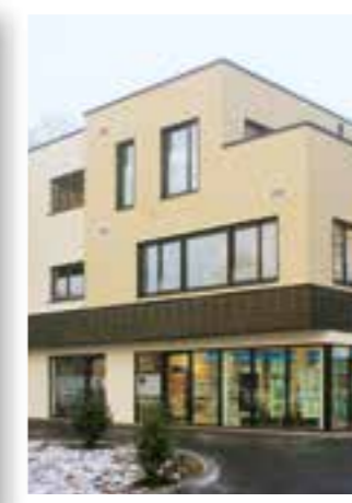
Seite 18 Ärztehaus Körbecke