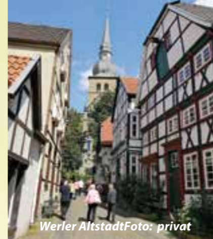
Werler Altstadt

Gemeinden wie Hirschberg bis hin zu Bad Sassendorf mit seinem Kurpark und der Bördetherme findet man überall Highlights zum Anschauen, Besichtigen oder für einen Bummel. Hier und da gibt's natürlich auch actionreiche Angebote, wie Mini- und Fußball- (Möhnesee) oder Adventuregolf (Bad Sassendorf) sowie Klettervergnügen in Soest. Lassen Sie es sich unterwegs schmecken! Wie wäre es mit italienischen Spezialitäten bei Tino in Werl oder herzhaften Schnitzeln im Haus Schulte in Westönnen? Auch über den näheren Umkreis