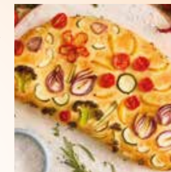
servieren. (Dr. Oetker/hs) Guten Appetit!

(Ø 25-30 cm) ausrollen. Pizzasauce auf dem Teig verteilen, dabei 1 cm Rand frei lassen. Füllung jeweils auf einer Seite verteilen. Teigrand dünn mit Wasser bestreichen. Die nicht belegte Hälfte überschlagen und Teigänder gut andrücken. Die Calzonen mit Wasser bestreichen. Mit Gemüse und Kräutern verzieren und backen. Einschub: Mitte Backzeit: etwa 20 Min. Gemüse-Calzonen mit dem Backpapier auf einen Kuchenrost ziehen und warm