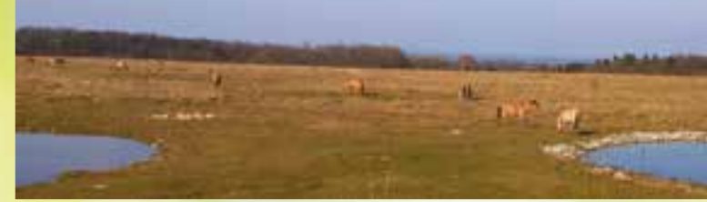
Foto: Wildpferde in Möhnesee-Büecke.

lich ist das Ausflugsziel Nummer 1, der Möhnesee, zu jeder Jahreszeit einen Besuch wert. Ab dem 1. April startet die Saison der MS Möhnesee, mit der Sie über das „Westfälische Meer“ schippern können. Das große Rad- und Wanderwegenetz rund um See und im Arnsberger Wald lädt auch alle Aktiven zum Erkunden