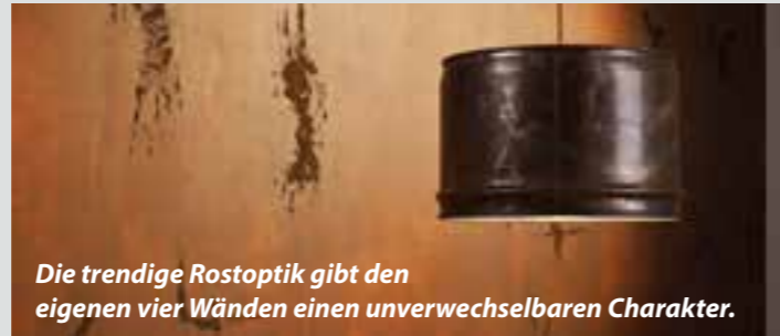
Die trendige Rostoptik gibt den eigenen vier Wänden einen unverwechselbaren Charakter.

Eine mit Sorgfalt ausgewählte Einrichtung bringt den Geschmack und die Persönlichkeit der Bewohner zum Ausdruck. Großen Anteil an der Wirkung eines Raums haben die Wände – schon aufgrund ihrer Größe. Neben der Wahl des Lieblingsfarbtons stehen dabei noch viele