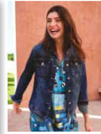
Seite 20 Frühjahrsmode