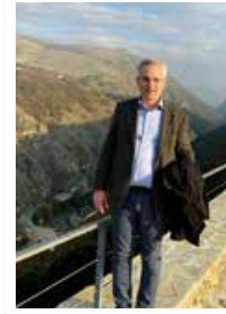
Seite 4 Fachkräfte aus dem Ausland