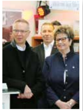
Seite 24 MeTa in Ense