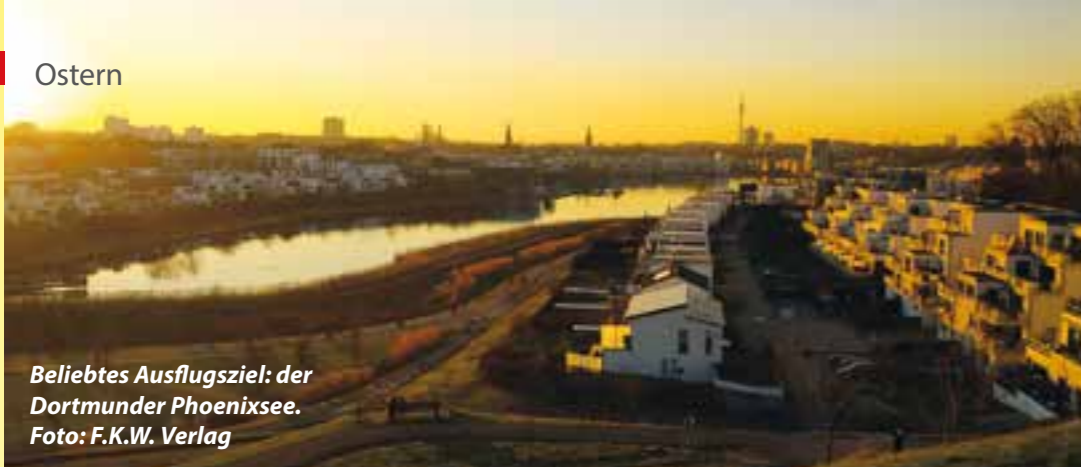
Beliebtes Ausflugsziel: der Dortmunder Phoenixsee.

türlich auch ein passendes Museum als Ausflugsziel. Spannende Kunstausstellungen finden Sie darüber hinaus im „U“, einem der Szene-Orte der Stadt. Oder schauen Sie sich mal das frühere Hoesch-Gelände im Süden der Stadt an: Rund um den Phoenix-See im Stadtteil Hörde können Sie nicht nur bummeln, sondern auch kulinarischen Genüssen fröhnen. Egal, wohin es Sie verschlägt: Überall freuen sich die Gastronomen auf ihren Besuch. Egal, ob zum Dinner, zur Kaffeezeit oder ausgiebigem Frühstück. Genussvolle Osterzeit! (hs)