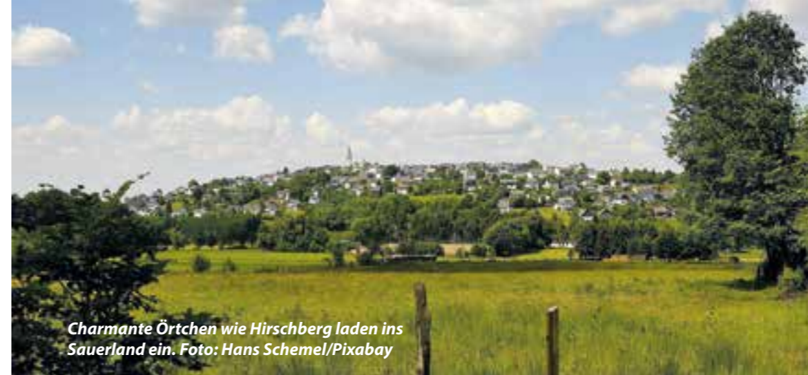
Charmante Örtchen wie Hirschberg laden ins Sauerland ein.