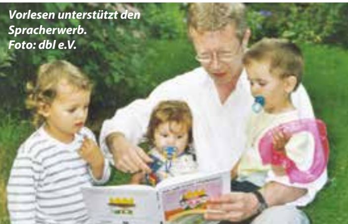
Vorlesen unterstützt den Spracherwerb.

Beim diesjährigen Europäischen Tage der Logopädie am 6. März steht im Fokus, wie Eltern die Sprachentwicklung ihrer Kinder unterstützen und fördern können.