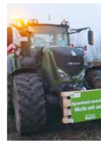
Seite 4 Landwirtschaft in Not