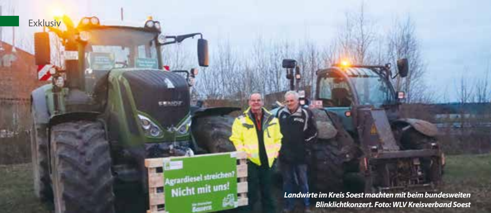
Landwirte im Kreis Soest machten mit beim bundesweiten Blinklichtkonzert.