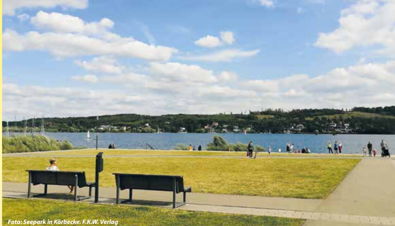
Foto: Seepark in Körbecke.

Reservierungen nehmen wir gerne telefonisch unter 02924/9820 entgegen! Seestraße 5 · 59519 Möhnesee · www.hotel-haus-griese.de