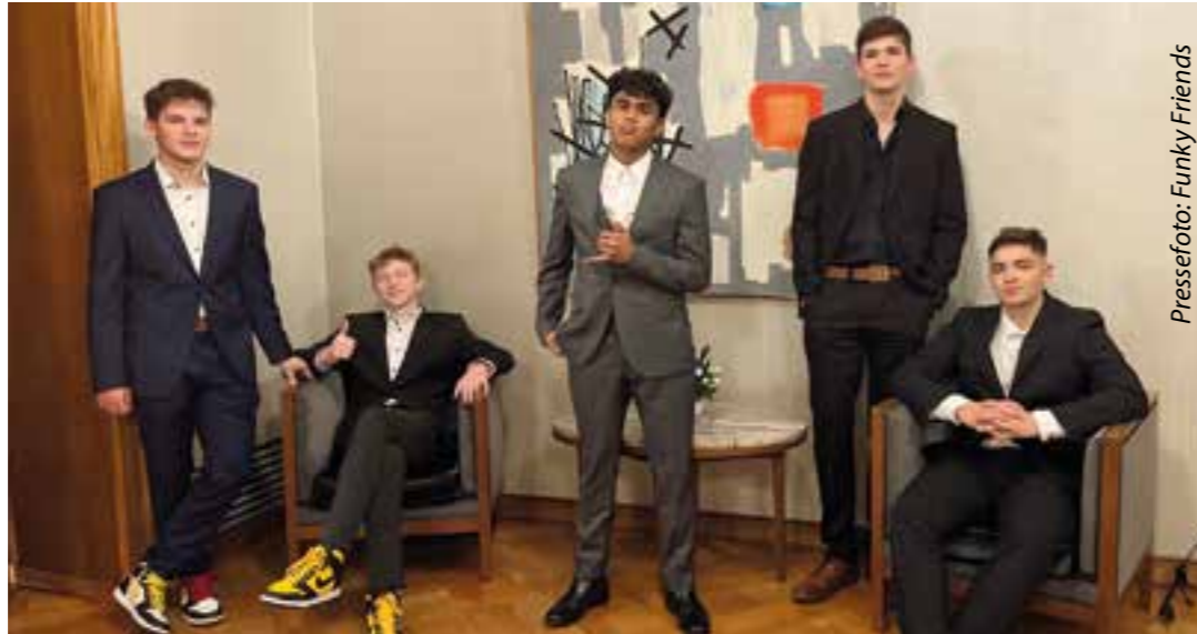
Pressefoto: Funky Friends

Die Jazzband „Funky Friends“ aus Soest besteht aus sechs jungen Nachwuchsmusikern aus Soest im Alter von 16 bis 18 Jahren. Interessierte können die Gruppe am Freitag, 22. März, um 20 Uhr live im KaDeWi (Kaufhaus der Wickeder) erleben.