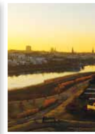
Seite 17 Ostern