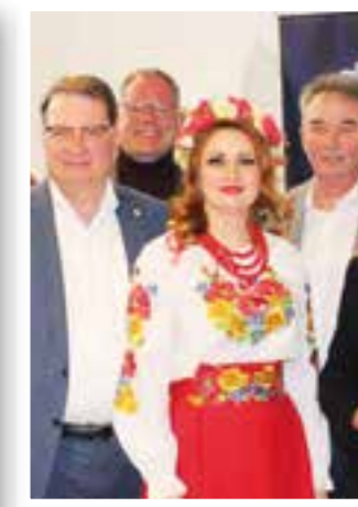
Seite 24 Enser MeTa