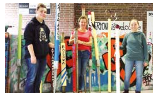
Die Holzstelen im Erinnerungsarten der Fritz-Winter-Gesamtschule konnten dank des Minifonds gepflegt werden.

Im letzten Jahr hat zum Beispiel das Stelenprojekt von der Fritz-Winter-Gesamtschule vom Minifonds profitiert: Mit Geld aus dem Fond wurden Holzstelen überarbeitet, die an Zwangsarbeiter erinnern, welche während des NS-Regimes in Ahlen aus-