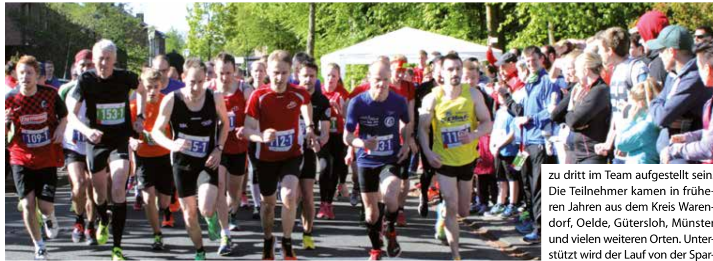
„Auf die Plätze fertig los“ heißt es auch in diesem Jahr wieder bei der Sparkassen Marathon-Staffel in Beckum.

35. Beckumer Marathon-Staffel lädt zum Mitlaufen ein