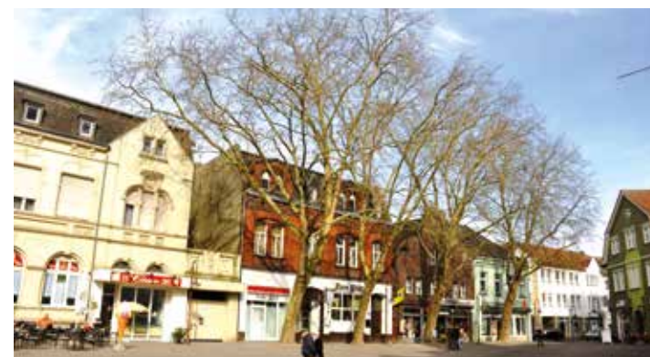
Marktplatz 1: Beckums gute Stube hat mit den großen Bäumen ein einladendes Flair und viele Menschen wollen es erhalten.

Werden die Platanen abgesägt oder nicht? Bürgerentscheid am 8. Juli