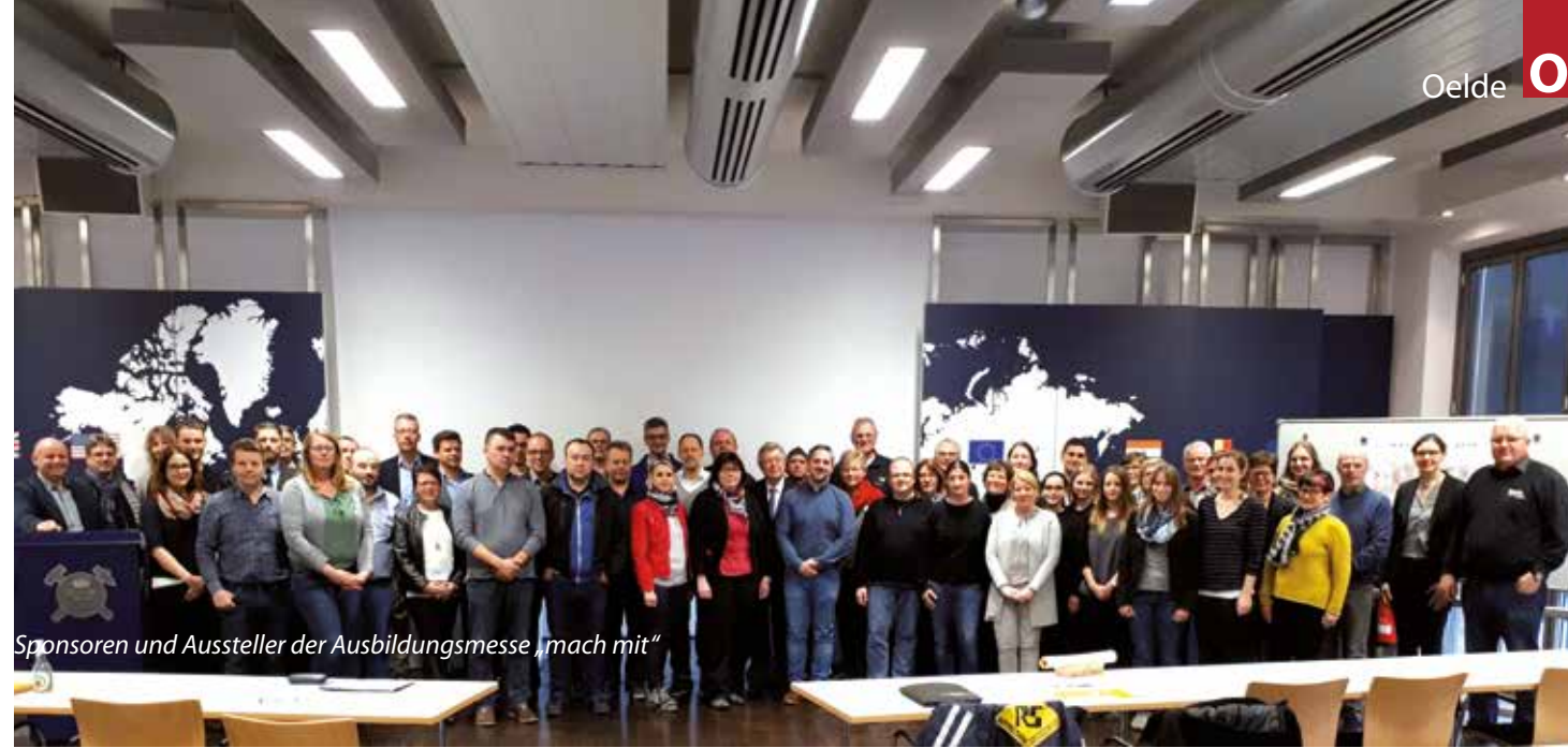
Sponsoren und Aussteller der Ausbildungsmesse „mach mit“