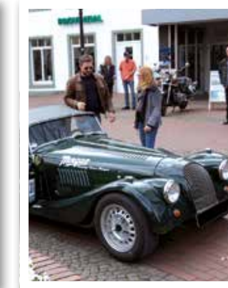
Oelde Seite 18