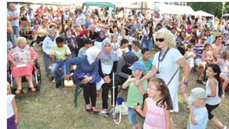
Zum Tag der Begegnung sind Behinderte und Nicht-Behinderte auf den Westenfeuermarkt eingeladen.

Aktive aus Schulen, Kindergärten, Freizeiteinrichtungen, Behinderteneinrichtungen, Vereinen und Selbsthilfegruppen werden ver-