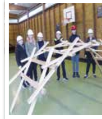
Ahlen Seite 8 Stolpersteine für NS-Opfer