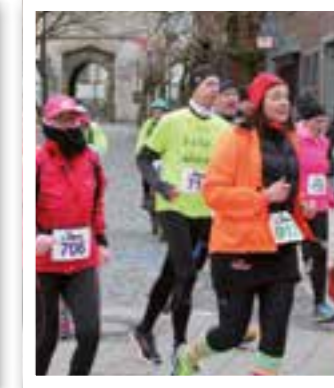
Oelde Seite 42 Burggrafenlauf in Stromberg