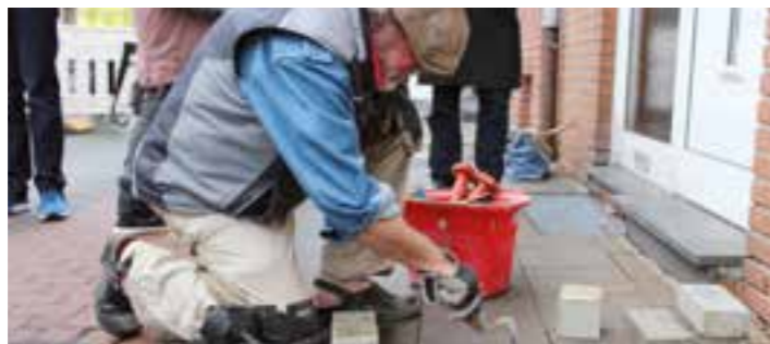
Künstler Gunter Demnig verlegt den Stolperstein an der Rottmannstr. 11.