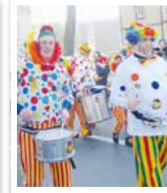
Beckum Seite 22 Heiße Karnevalsphase beginnt