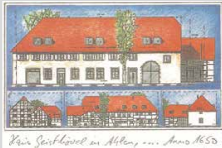
– Anzeige –

Unser Team wird Sie mit seiner herzlichen Freundlichkeit und Kompetenz überzeugen!