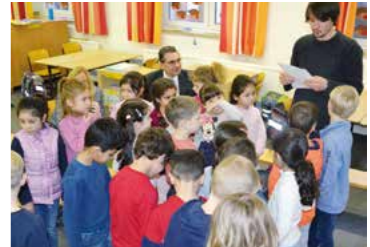
Eng und ungemütlich: Die Schülerinnen und Schüler der Klasse 1b bekommen ein Gefühl dafür, wie sich Eisbären ohne Eisschollen fühlen müssen.

Die Stadt will mit der Schulung von Energiebeauftragten nicht nur Energiekosten reduzieren. Durch einen bewussten Umgang mit elektrischer Energie und Wärmeenergie leisten die Schulen