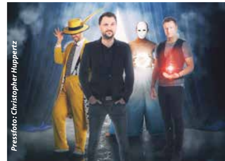
Pressefoto: Christopher Huppertz