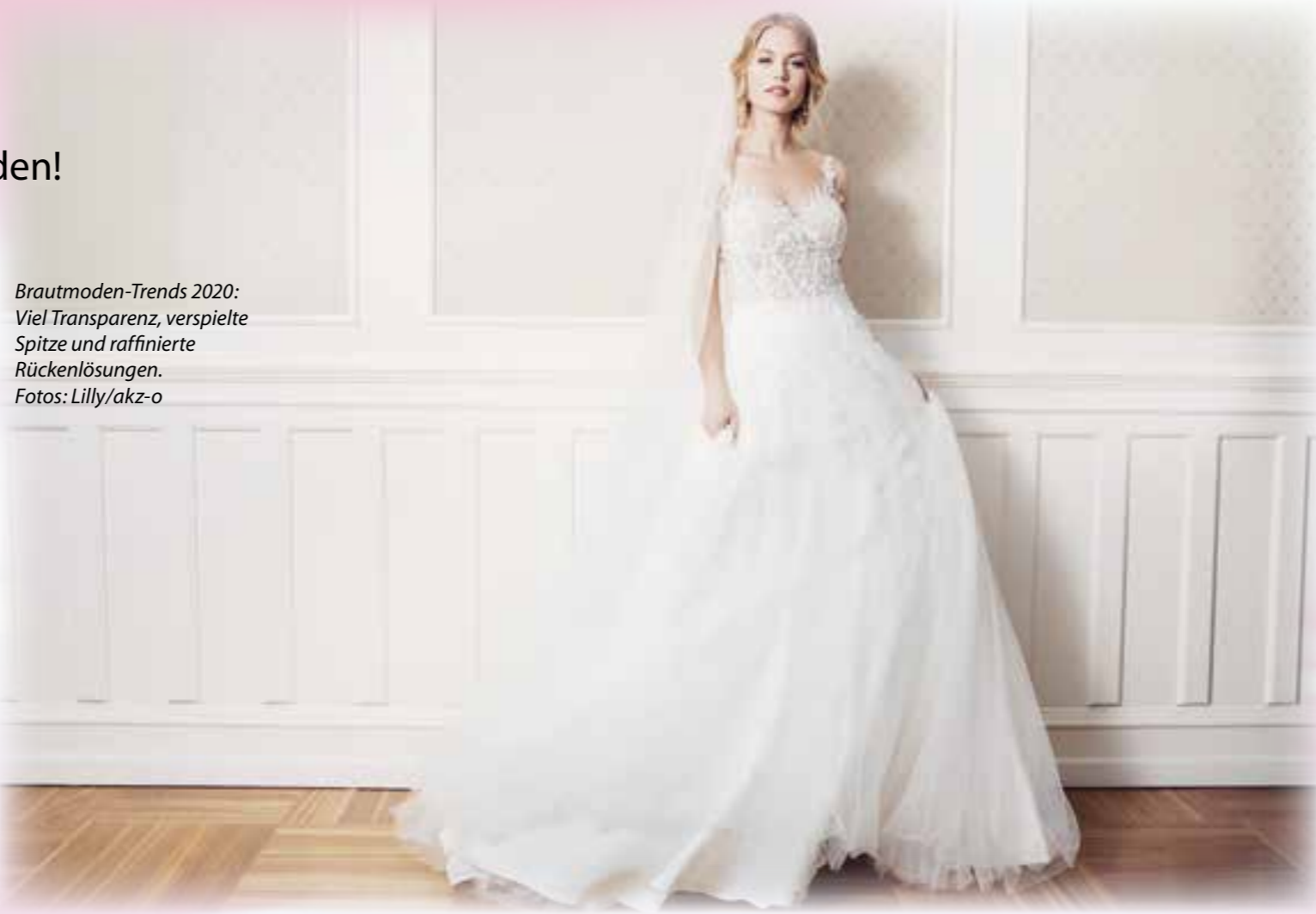
Brautmoden-Trends 2020: Viel Transparenz, verspielte Spitze und raffinierte Rückenlösungen.

ganisations-Service oder auch Kinderbetreuung an. Wenn Sie die Qualität der Speisen vor Ort noch nicht kennen, sollten Sie in jedem Fall einmal dort essen gehen. Menü- und Büfettvorschläge sollten Sie sich später auch einmal dort mitgeben lassen. Wenn Sie Saal und Caterer separat buchen, sind Empfehlungen aus dem Bekanntenkreis hilfreich – vielleicht kamen Sie selbst schon einmal in den Genuss eines edlen Büfetts, das Ihnen gefallen hat? Tipp: Auf Hochzeitsmessen präsentieren sich stets viele regionale Profis und gerade die Caterer bieten gern einen Probierhappen für den ersten Eindruck an.