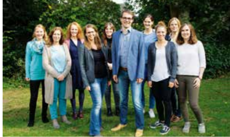
Das Forschungsteam der LWL-Universitätsklinik freut sich auf neue Studienteilnehmer.