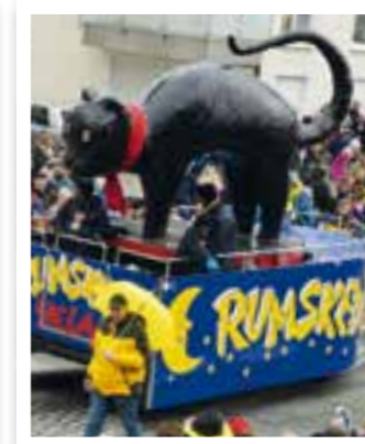
Beckum Seite 11 Präsidenten im Gespräch