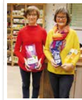
Ahlen Seite 8 40 Jahre Weltladen