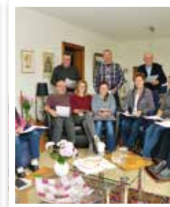
Ennigerloh Seite 23 Plattdeutsches Theater