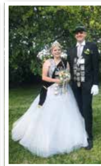
Ahlen/Beckum Seite 6