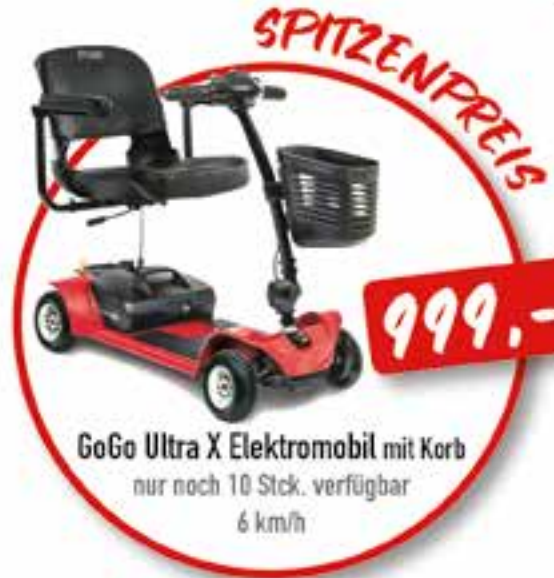
GoGo Ultra X Elektromobil mit Korb nur noch 10 Stck. verfügbar 6 km/h