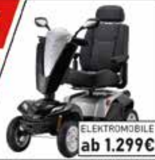
ELEKTROMOBILE ab 1.299€