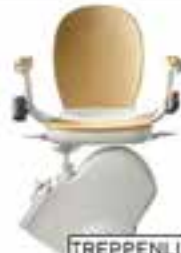
TREPPENLIFTE ab 2.999€