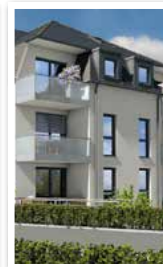
Oelde Seite 19