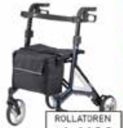
ROLLATOREN ab 149€

Reparatur | Inspektion Verkauf | Beratung