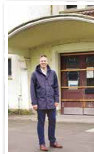
Neubeckum Seite 5