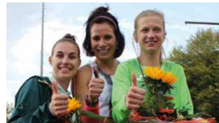
Auf eine Titelverteidigung müssen die drei Siegerinnen des Vorjahres, (v. l. Ninon Guillon-Romarin (2., Frankreich), Siegerin Jennifer Suhr (USA) und Tina Sutej (3., Slowenien), nach der Absage des am 13. September geplanten 22. Beckumer Volksbank-Stabhochsprung-Meetings bis ins Jahr 2021 warten.

„Die lokalen und regionalen Ereignisse und Restriktionen der vergangenen Wochen in den Kreisen Warendorf und Gütersloh haben die drei Veranstalter dazu bewogen, die Veranstaltung in diesem Jahr nicht durchzuführen“, bedauert Chef-Organisator Christof Kelzenberg die jetzt erfolgte Absage. Das sei gerade mit Blick auf die Athletinnen, die gerne in Beckum an den Start gehen würden, sehr schade.