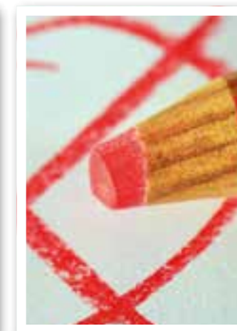
Ahlen/Beckum Seite 10 Kommunalwahl 2020