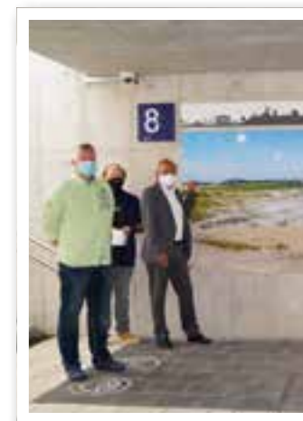
Neubeckum Seite 9 Eröffnung Bahnhof