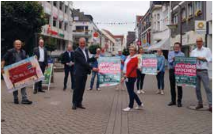
Machen was los für die Innenstädte: Die Veranstalter und Sponsoren der Beckumer Aktionswochen freuen sich auf viele Besucher.