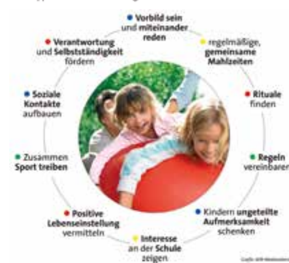
Gesunde Kinder – gesunde Zukunft Zehn Tipps für den Familienalltag

können Anzeichen für eine Hörstörung sein. In den ersten Lebensjahren reift das Hörvermögen des Kindes aus und es lernt etappenweise, weiter entfernte Dinge wahrzunehmen, Geräusche zu erkennen und am Ende konzentriert zuzuhören. Auf der einen Seite können Störungen des Hörvermögens bereits angeboren sein, so zum Beispiel eine Schwerhörigkeit. Aber auch durch eine Infektion ist das Gehört schnell beeinträchtigt. Der Gang zum Arzt ist in diesem Fall unumgänglich. Ein Hörtest lässt sich auch unkompliziert beim Hörgeräteakustiker durchführen.