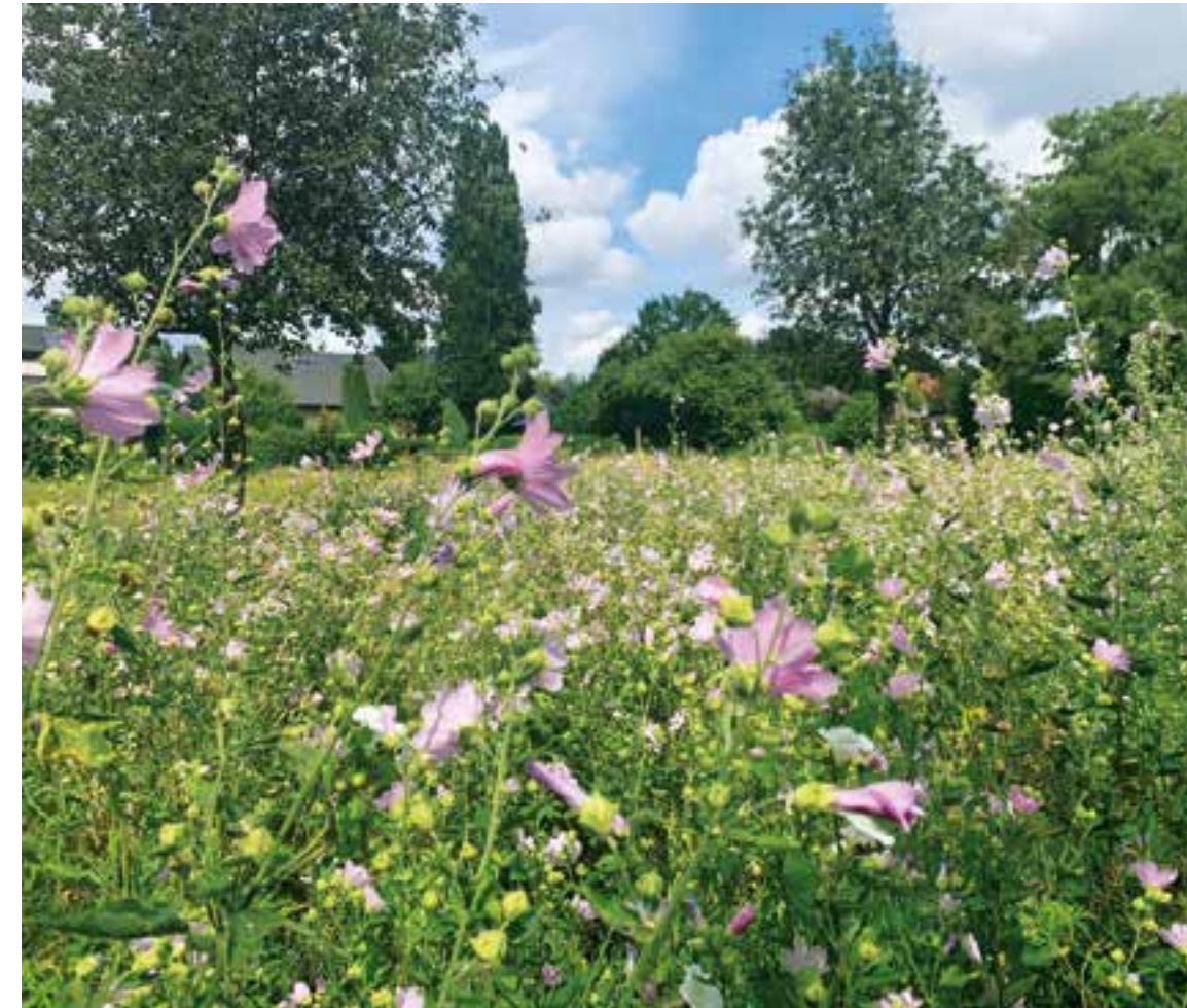
So könnte es mal aussehen: Die bereits bestehende Blumenwiese am Emssee in Warendorf dient als Vorbild.

„Die gestiegene Attraktivität von nachhaltigen Investments bei Anlegern kann zu einem auf das veränderte Konsumverhalten der Menschen mit bewusster Produktauswahl zurückgeführt werden. Zum anderen suchen Sparer in Zeiten niedriger Zinsen und zunehmender Unsicherheit an den Kapitalmärkten nach Anlagealternativen. Mit unserer Nachhaltigkeitskampagne wollen wir