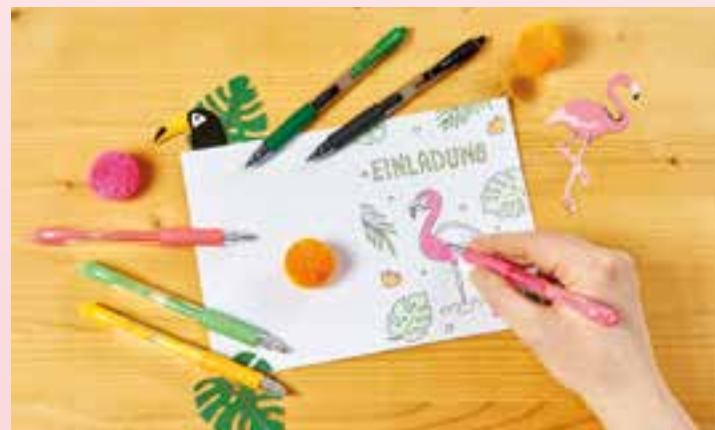
Schritt 2: Mit den Neon-Gelschreibern bringt man den Flamingo zum Leuchten.