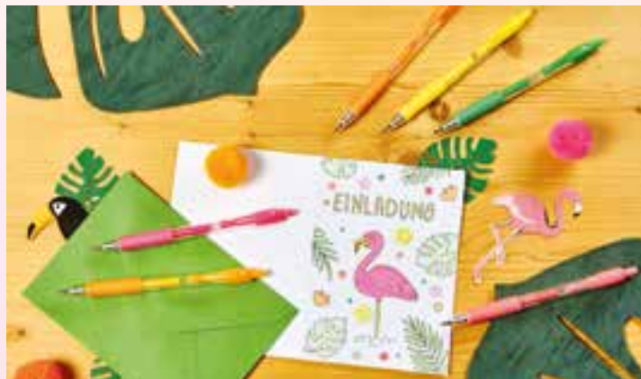
Ein pinker Flamingo inmitten exotischer Blätter und Blüten - fertig ist die fröhlich-bunte Einladungskarte für die nächste Geburtstags-, Sommer- oder Gartenparty.

Wer die Karten noch kreativer verzieren möchte, setzt schimmernde Highlights mit kleinen Pailletten und anderen Deko-Elementen, die mit Flüssigkleber auf die Karten befestigt werden. (djd).