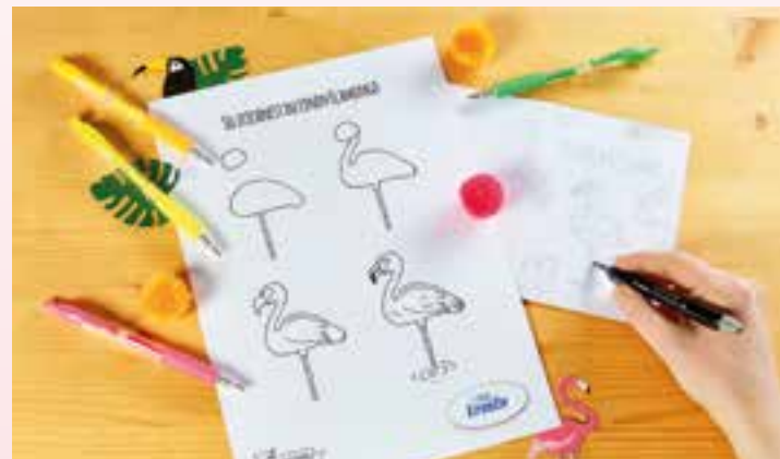
Schritt 1: Mithilfe der Vorlage wird der Flamingo in die Mitte der Karte gezeichnet.