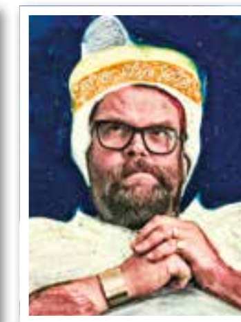
Ahlen/Beckum Seite 10 Kultur

Impressum Ortszeit Ahlen/Beckum Herausgeber und Verlag: FKW – Fachverlag für Kommunikation und Werbung GmbH Geschäftsführung: Rüdiger Deperade Delecker Weg 33 59519 Möhnesee-Wippringsen www.fkwverlag.com info@fkwverlag.com