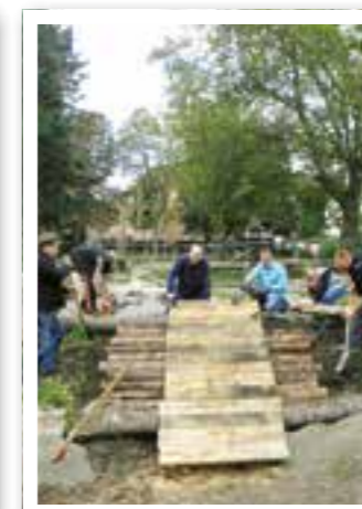
Ennigerloh Seite 10 Spielplatz-Baustelle