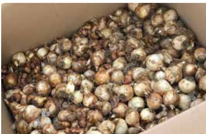
Der Inhalt von 111 Kartons mit Blumenwiebeln wird zurzeit in Ahlen verteilt.

Nachhaltig verbessert hat sich im Stadtgebiet das Nahrungsangebot für Insekten. Die Ahlener Umweltbetriebe (AUB) haben dazu in diesem Jahr über das Stadtgebiet verstreut Blühwiesen angelegt.