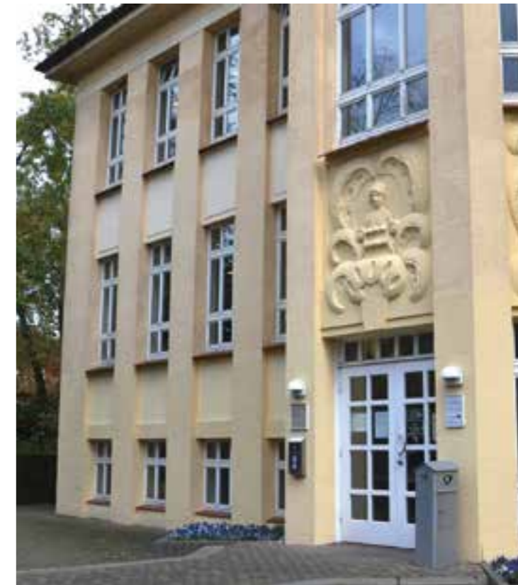
Kostenfrei ist das Angebot der Stadtbücherei, auf einen großen Bestand an Medien zuzugreifen – in der Bücherei, aber auch online.

Mit kostenfreiem Schnupperausweis Zugang zu Medien