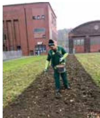
Die „Schneeglöckchenoffensive“ ist auf der Blühwiese an der Zeche gestartet. Das Sähen ist Handarbeit.