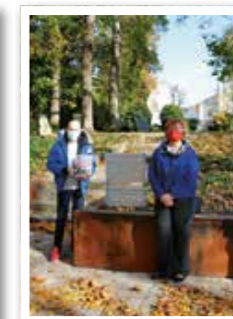
Ahlen Seite 46 Neue Gedenkstätte