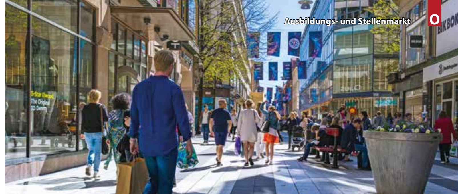
Zeit für eine neue Herausforderung: Seit Beginn der Öffnungen suchen unter anderem Einzelhandel und Gastronomie händeringend nach Personal.