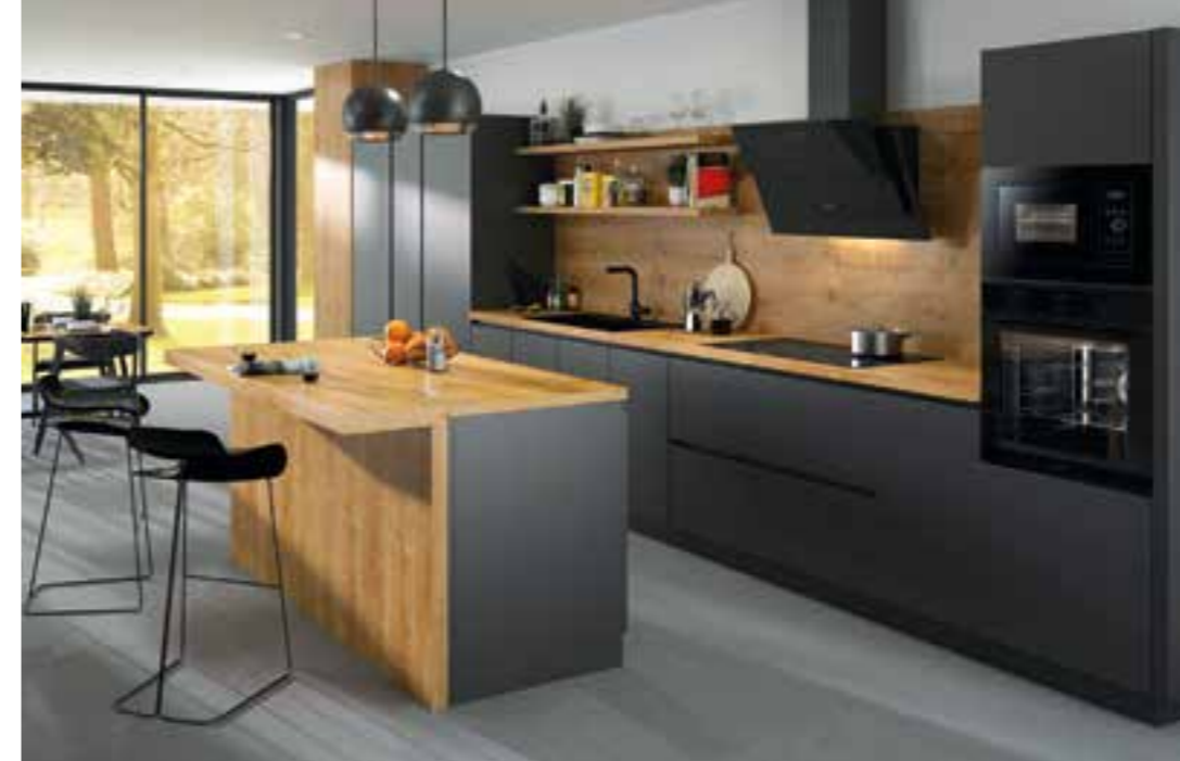
Vom Backofen bis zur Dunstabzugshaube – Designlinie in Schwarz ist ein wahrer Augenschmaus.

kann man sich ein Stück Natur in die eigenen vier Wände holen“, sagt Marko Steinmeier von einer Einkaufsgemeinschaft von mehr als 400 inhabergeführten Küchenstudios und Fachmärkten in Deutschland und Europa. Natürliche und softe Farbnuancen laden dazu ein, zur Ruhe zu kommen und den stressigen Alltag hinter sich zu lassen. Auch der Beton-Look, bei dem die Farbpalette von Weißbeton über Hellgrau bis hin zu Schiefergrau reicht, wirkt sehr harmonisch. Farb- und Materialmische können bei der Raumgestaltung tolle Kontraste zaubern und verleihen der Küche eine persönliche Note. „Eine anthrazitfarbene Arbeitsplatte aus Naturstein etwa macht sich gut zu war-