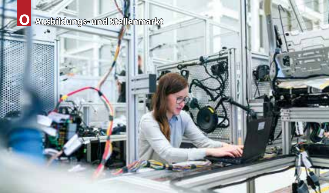
In der Industrie und in vielen technischen Berufen ist der Personalbedarf weiter hoch.