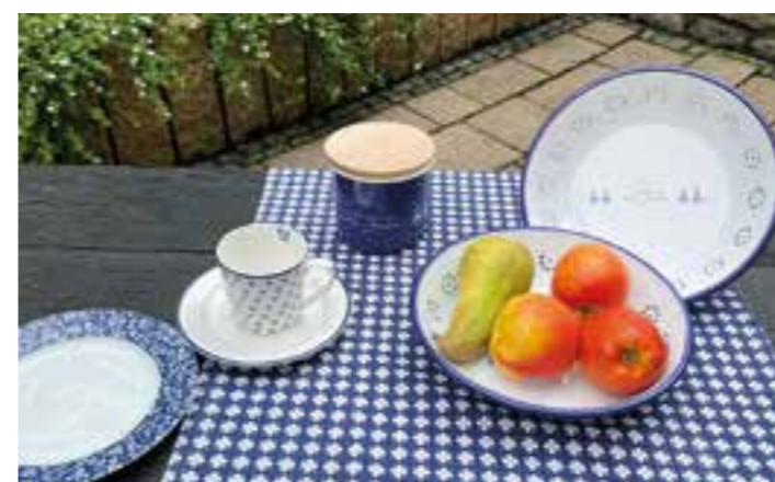
Ob als Brotkorb oder Obstschale, das 45. „Pöttken“ ist vielseitig verwendbar.

Die Wirtschaftsförderungsgesellschaft Ahlen (WFG), die Stadt Ahlen und Pro Ahlen hatten bis zuletzt gehofft, doch die aktuelle Entwicklung der Infektionen mit dem Corona-Virus ließ ihnen keine andere Wahl: Der Pöttkes- und Töttkenmarkt findet auch in diesem Jahr nicht statt.