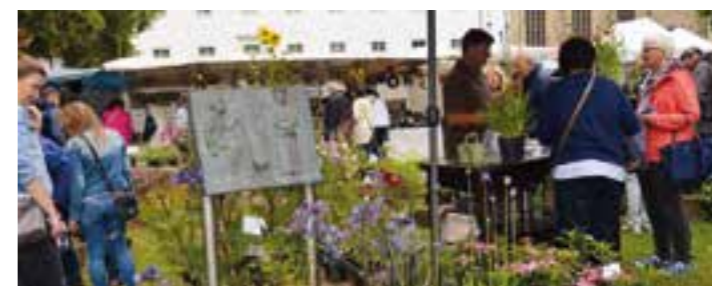
Das bunte Markttreiben des Handwerkstags wird in diesem Jahr komplett in den Außenbereich des Museum Abtei Liesborn verlegt.

Nach der Corona-bedingten Pause im letzten Jahr werden nun wieder 40 Aussteller zwischen 11 und 18 Uhr den Besucher:innen einen Einblick in alte Handwerks-techniken gewähren. Neben traditionellen Berufen wie Drechsler oder Seifensieder finden sich auch fast vergessene Gewerke wie Seiler, Stuhlflechter oder eine Hutmacherin. Für Familien und Kinder gibt es verschiedene Mitmachangebote, außerdem kommt die rollende Waldschule zu Besuch. Natürlich ist auch wieder für das