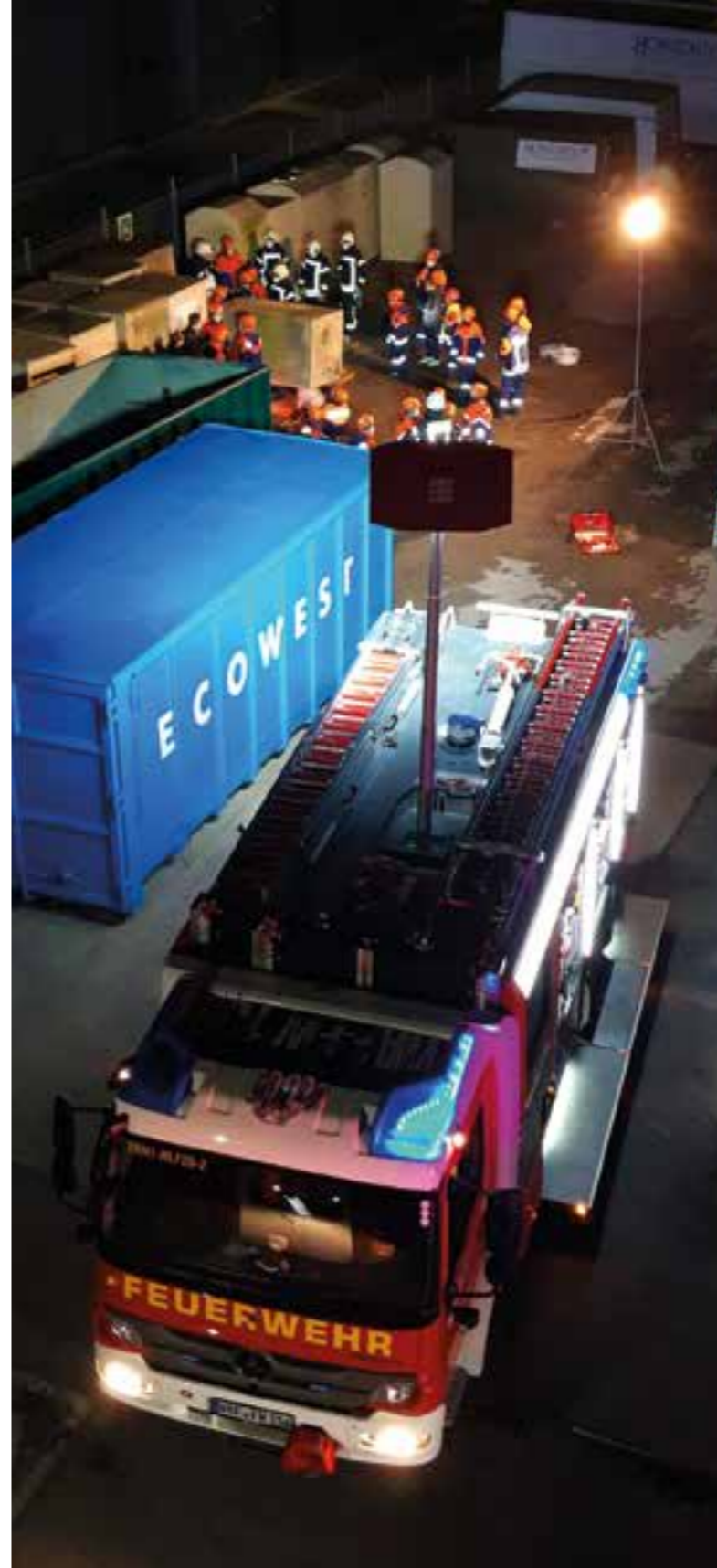
Die Jugendfeuerwehr übt einen Rettungseinsatz unter realitätsnahen Bedingungen auf dem Horizonte-Gelände.