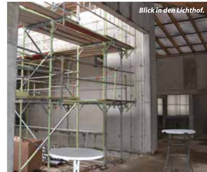
Blick in den Lichthof.