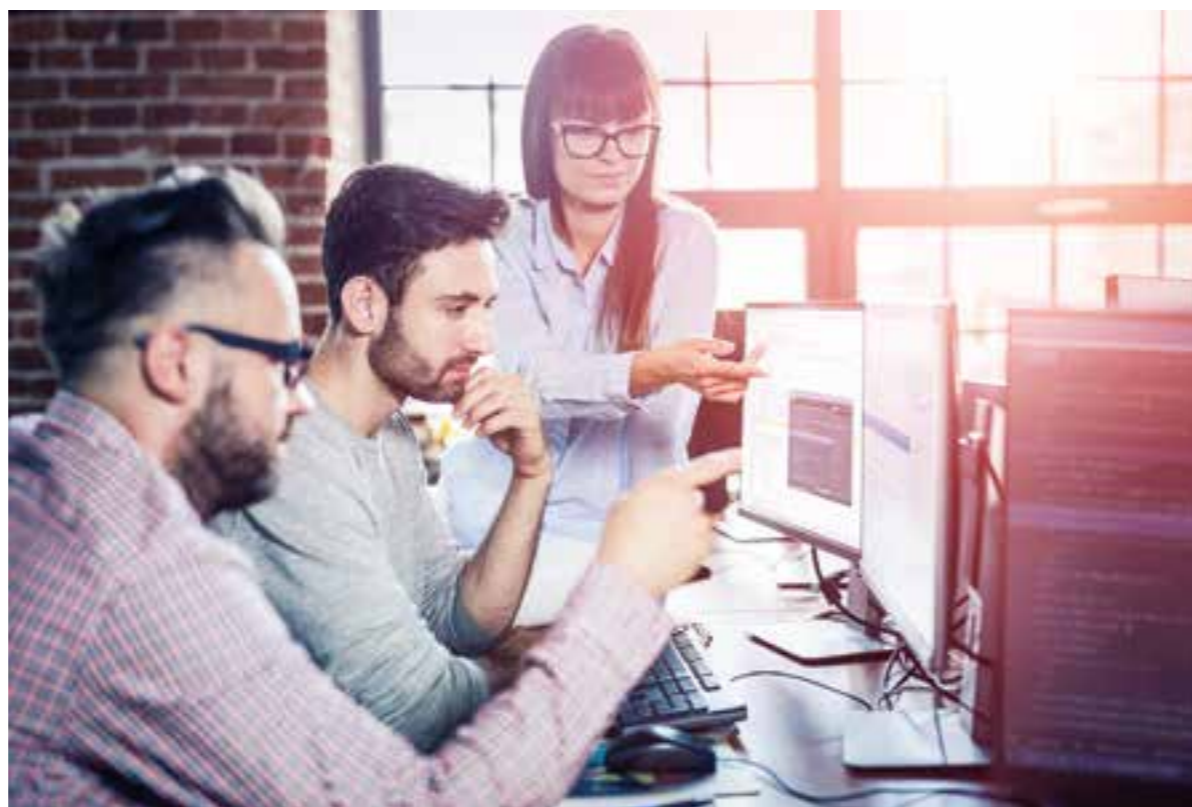
Viele Unternehmen suchen derzeit vermehrt nach neuem Personal.

Gute Zukunftsperspektiven Nach einer aktuellen Umfrage des