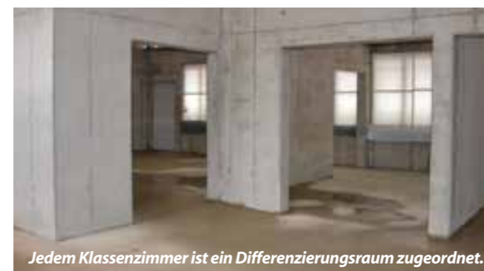
Jedem Klassenzimmer ist ein Differenzierungsraum zugeordnet.