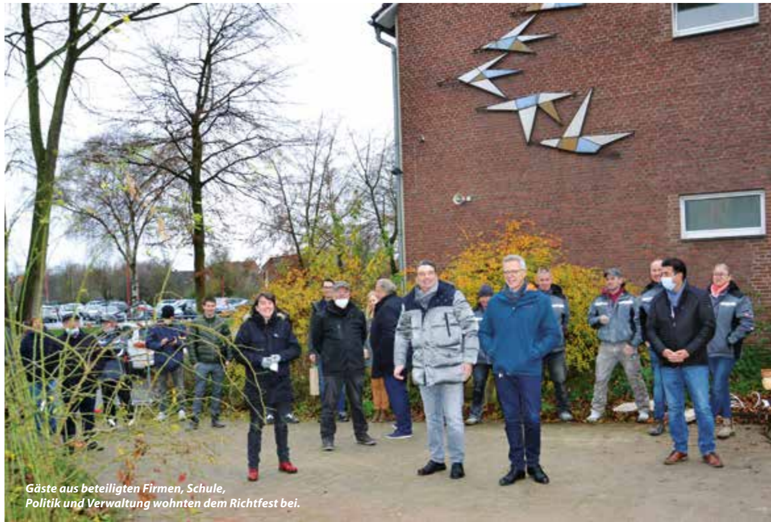
Gäste aus beteiligten Firmen, Schule, Politik und Verwaltung wohnten dem Richtfest bei.