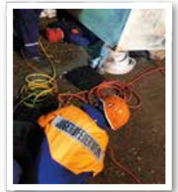
Ennigerloh Seite 14 Jugendfeuerwehr-Übung