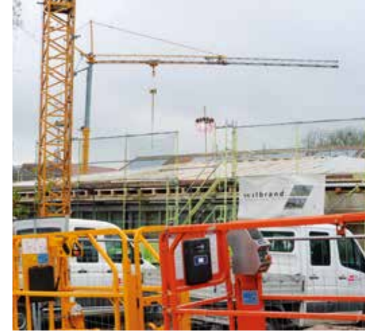
Der Richtkranz steht über dem Rohbau.