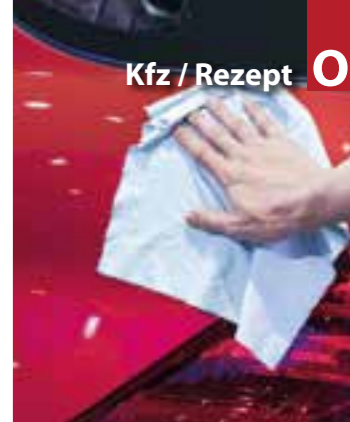
Kfz / Rezept O