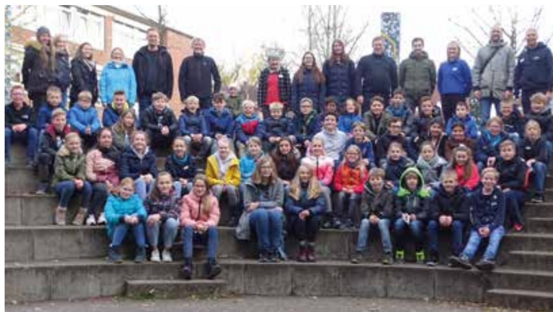
Rund 50 Schüler:innen aus dem Regierungsbezirk Münster haben an der SAMMS teilgenommen.

Bereits zum 18. Mal fand die SAMMS im Jugendgästehaus am Aasee statt. Die Akademie wurde von der Bezirksregierung Münster organisiert und veranstaltet und durch das Ministerium für