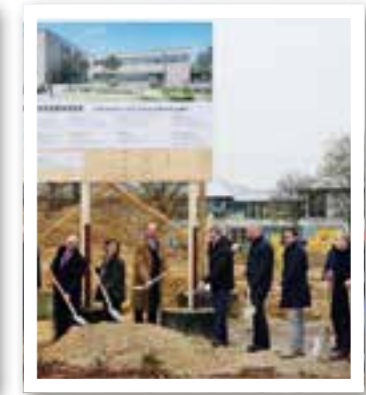
Beckum Seite 9 Spatenstich für neue Verwaltung