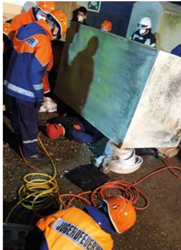
Der eingeklemmte „Verletzte“ wird betreut während der umgestürzte Altkleidercontainer patientenschonend mit Hebekissen angehoben und mit Schlauchrollen gesichert wird.

Der jugendliche Einsatzleiter verschaffte sich mit den Gruppenführern sofort einen Überblick und koordinierte zusammen mit den Betreu-