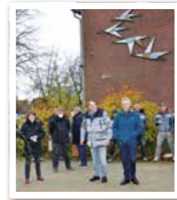
Ahlen Seite 6 Richtfest an der Gesamtschule

Impressum Ortszeit Ahlen/Beckum Herausgeber und Verlag: FKW – Fachverlag für Kommunikation und Werbung GmbH Geschäftsführung: Rüdiger Deperade Delecker Weg 33 59519 Möhnesee-Wippringsen www.fkwverlag.com info@fkwverlag.com Anzeigen: Jutta Schubert-Gosda Tel.: 0 25 21 · 82741 - 21 gosda@fkwverlag.com Sandra Epping Tel.: 0 25 21 · 82741 - 24 epping@fkwverlag.com Linnenstraße 2 59269 Beckum Tel.: 0 25 21 - 827 41 0 Fax: 0 25 21 - 827 41 29 www.fkwverlag.com Redaktion: Michaela Dziwisch Heike Sieger Satz: FKW Fachverlag GmbH Druck: Senefelder Misset, Doetinchem Erscheinungsweise: monatlich Verbreitungsgebiet: Ahlen, Beckum, Drensteinfurt, Oelde und Ennigerloh Erfüllungsort: Möhnesee Auflage: 25.000 Keine Gewähr für unaufgefordert eingesandte Manuskripte oder Fotos. Der Abdruck von Veranstaltungshinweisen ist kostenlos. Abdruck und Vervielfältigung redaktioneller Beiträge und Anzeigen bedürfen der ausdrücklichen Zustimmung des Verlages.