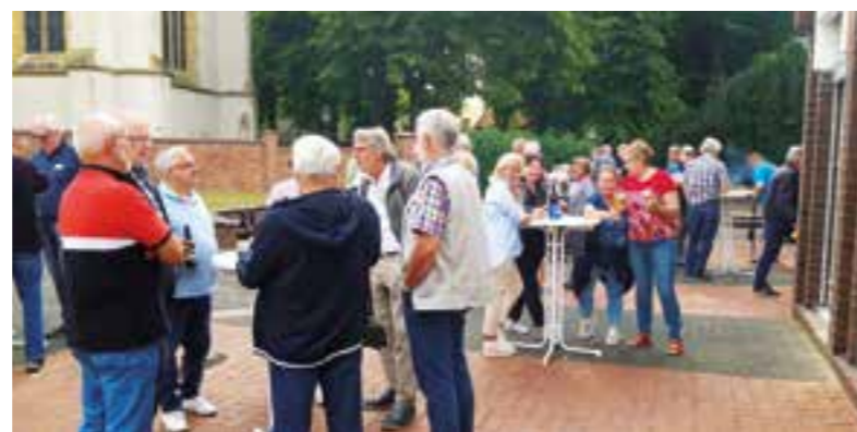
Rund 80 Ehrenamtliche trafen sich wieder zum Sommerfest. Alle haben den Abend mit dem regen Austausch untereinander sehr genossen.

Bei Würstchen und Kaltgetränken fand anschließend ein reger Austausch untereinander statt, dabei kamen auch die Erfahrungen mit den gestiegenen Kundenzahlen zur Sprache. Hier