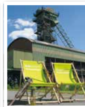
Ahlen Seite 10 Sommerfest der Fördertürme