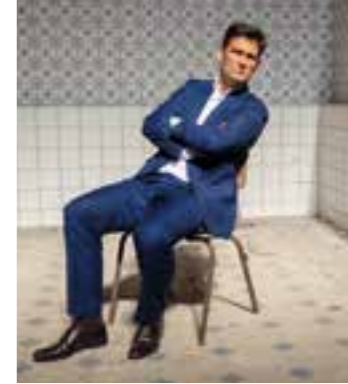
Christian Ehring