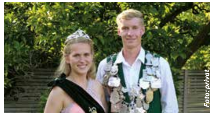
Wer folgt König Max (I.) Middelhove und Königin Laura (I.) Fissahn auf den Thron?

Am Samstag geht es nach dem Antreten der Kompanien Nord und