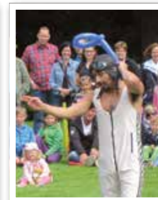
Oelde Seite 24 Gauklerfest