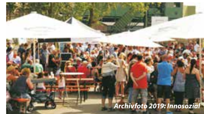
Archivfoto 2019: Innosozial

An diesem Nachmittag wird eine Mischung aus musikalischen, künstlerischen und sportlichen Darbietungen interkultureller