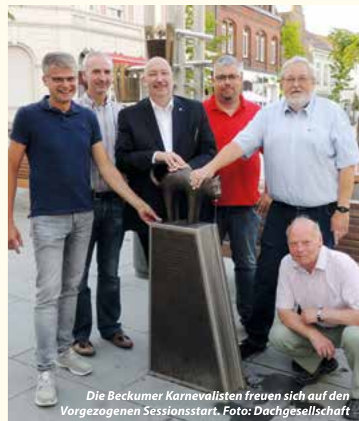
Die Beckumer Karnevalisten freuen sich auf den Vorgezogenen Sessionsstart.

Karneval im Sommer – das hat in Beckum schon eine Tradition. Schon drei Mal hat die Dachgesellschaft alle karnevalsbegeisterten Bürger:innen zum Open-Air-Fest eingeladen. Nach mehr als zweijähriger Corona-Zwangspause geht's jetzt zum vorgezogenen Auftakt der Session wieder in die närrischen Vollen. Nach einem kurzen Sternmarsch der Aktiven zum Marktplatz startet dort