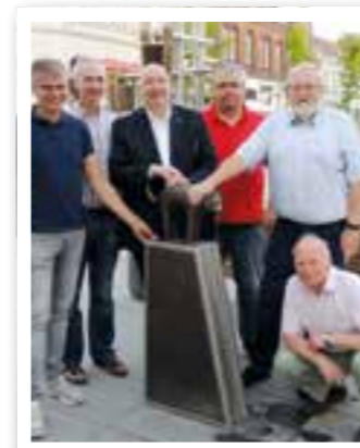
Beckum Seite 5 Sommerkarneval

Redaktion: Michaela Dziwisch Heike Sieger Satz: FKW Fachverlag GmbH Druck: Senefelder Misset, Doetinchem Erscheinungsweise: monatlich Verbreitungsgebiet: Ahlen, Beckum, Drensteinfurt, Oelde und Ennigerloh Erfüllungsort: Möhnese Auflage: 14.550 Keine Gewähr für unaufgefordert eingesandte Manuskripte oder Fotos. Der Abdruck von Veranstaltungshinweisen ist kostenlos. Abdruck und Vervielfältigung redaktioneller Beiträge und Anzeigen bedürfen der ausdrücklichen Zustimmung des Verlages. Titelbild: ©Stadt Ahlen/F.K.W. Verlag