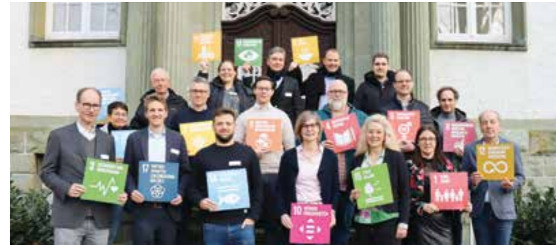
Wichtige Ziele im Blick: Die Steuerungsgruppe zur Erstellung der Beckumer Nachhaltigkeitsstrategie stellt sich vor der ersten Sitzung zum Gruppenfoto auf.

Beckum macht sich auf den Weg zur Nachhaltigkeitsstrategie