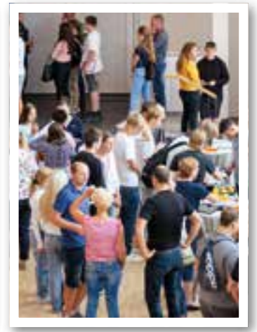
Wadersloh Seite 26 Messe BIM

Impressum Ortszeit Ahlen/Beckum Herausgeber und Verlag: FKW – Fachverlag für Kommunikation und Werbung GmbH Geschäftsführung: Rüdiger Deperade Delecker Weg 33 59519 Möhnesee-Wippringsen www.fkwverlag.com info@fkwverlag.com