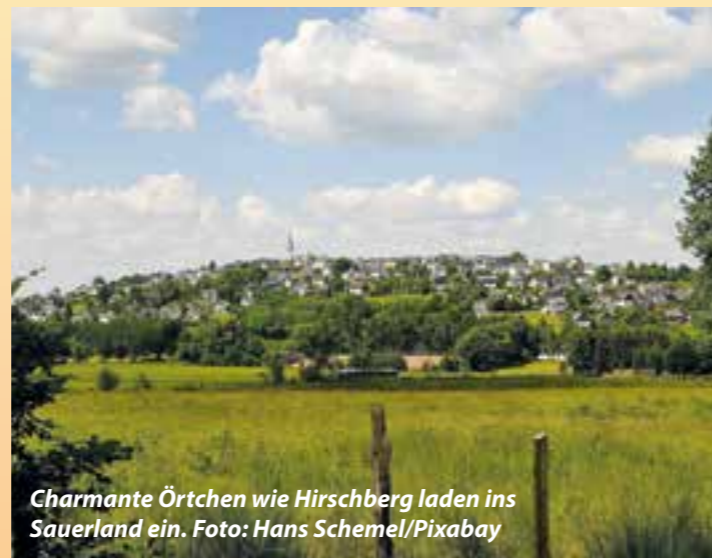
Charmante Örtchen wie Hirschberg laden ins Sauerland ein.

lem Familien wunderbare Möglichkeiten, etwas zu erleben. Der Vier-Jahreszeiten-Park in Oelde beispielsweise lockt zu dieser Jahreszeit mit den ersten Frühblüchern und natürlich Spielplatz-Spaß sowie dem Kindermuseum Klipp Klapp. Hamm ist auch