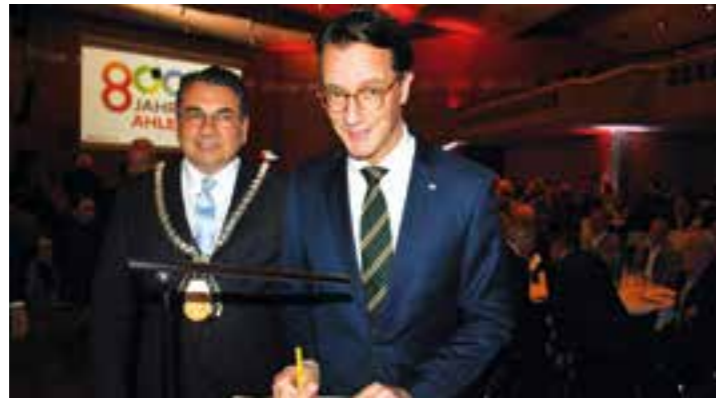
Ministerpräsident Hendrik Wüst trug sich in das Goldene Buch der Stadt Ahlen ein.

Mit einem Empfang für 300 geladene Gäste aus Stadtgesellschaft, Partnerstädten und Institutionen hat die Stadt Ahlen ihr Festprogramm zum Jubiläum der ersten urkundlichen Erwähnung vor 800 Jahren fortgesetzt. Ehrengast und Festredner in der Stadthalle Ahlen war der NRW-Ministerpräsident Hendrik Wüst, der sich in das Goldene Buch der Stadt Ahlen eintrug.