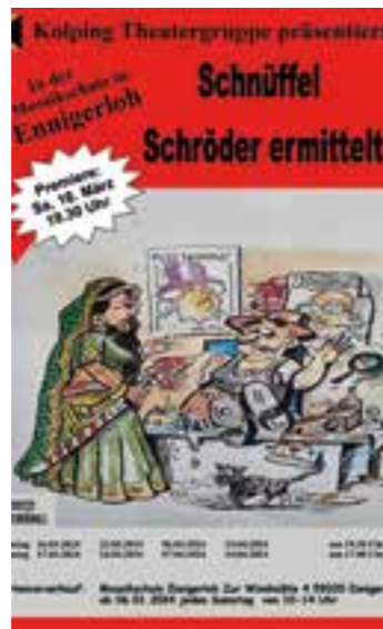
Plakat: Kolping Theatergruppe Ennigerloh

Im März ist es wieder so weit – die Ennigerloher Theaterfreunde sind wieder auf der Bühne. Zuerst wurden sie durch die Corona-Pandemie ausgebremst; danach fehlten einige Akteure. Nach intensiven Bemühungen sind wieder etliche neue Liebhaber des Theaterspiels hinzugekommen.