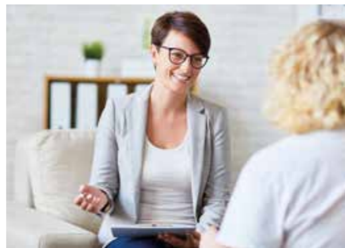
Vom Arbeitssuchenden bis zum angehenden Selbstständigen oder Existenzgründer – das Angebot an individuellen Coachings ist groß.