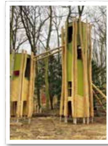
Oelde Seite 5 Neubau im Vier-Jahreszeiten-Park