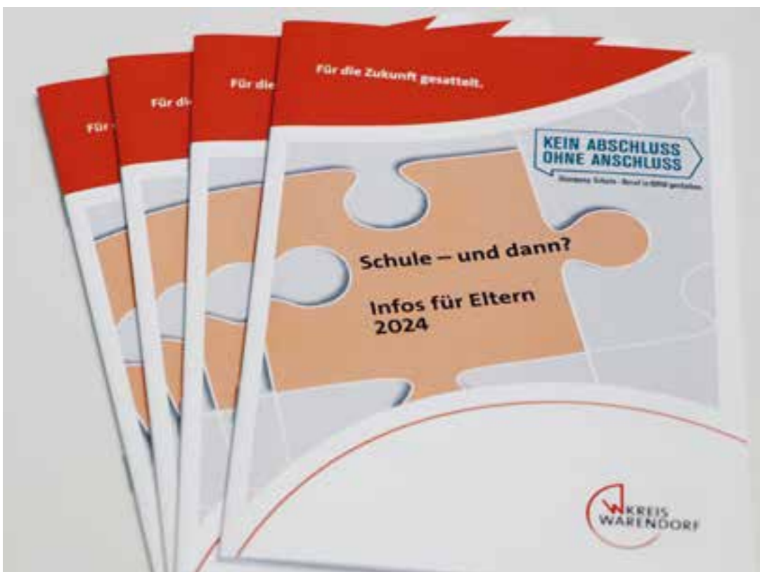
Die Elternbroschüre „Schule - und dann?“ ist in aktualisierter Form ab sofort erhältlich.

Downloadmöglichkeit für alle Interessierten