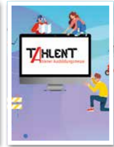
Ahlen Seite 8 Tahlent