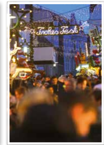
Adventszeit Seite 8 Weihnachtsmärkte im Kreis