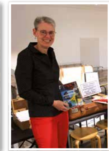
Geschichte Seite 21 Ausstellung zur Migration