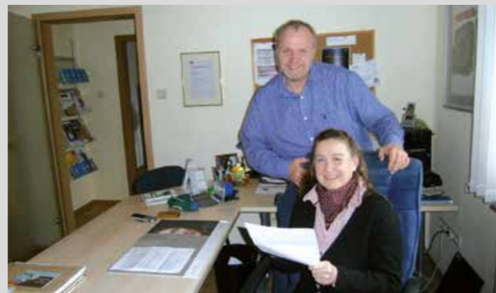
– Anzeige –

Kunden da und haben sich auf den Versicherungsschutz der Generation 50 Plus spezialisiert. „Gerade die Best Ager werden von den Versicherungen häufig im Stich gelassen, weil sie mit ihnen kaum Geld verdienen können. Wir helfen besonders diesen Kunden, ihren