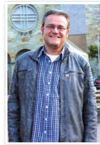
Titel Seite 4 Stadtgeschichte lebendig halten