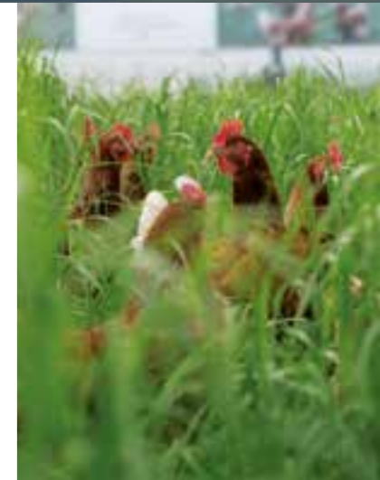
Glückliche, freilaufende Hühner

Eier bekommen Sie im Hofladen, der täglich rund um die Uhr geöffnet ist. Hier gibt's auch die leckeren Bio-Kartoffeln und natürlich Kürbisse!