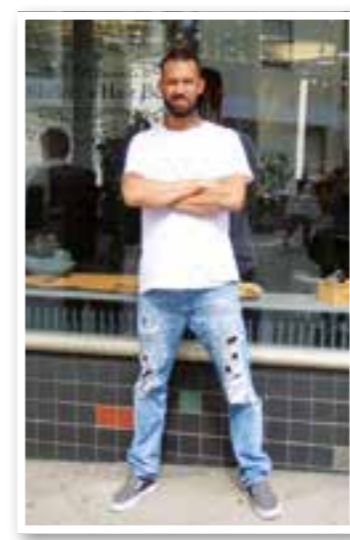
Story des Monats Seite 4 Empörungskultur