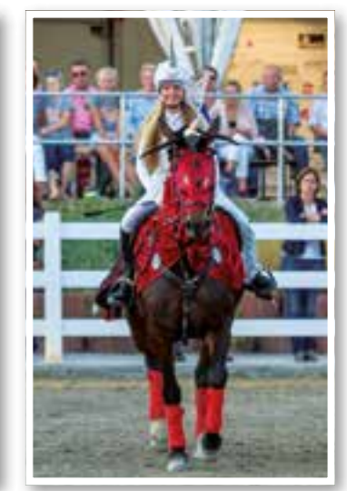
Massen Seite 30 Reit- und Springturnier