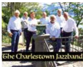
Pressefoto: The Charlestown Jazzband

Am Sonntag, 8. September, kommen Jazzfreunde in Kamen-Methler auf ihre Kosten. Dann findet ein Jazzfrühschoppen auf der Hofanlage Kalthoff in Wasserkurl statt. Zwischen 11 und 14.30 Uhr unterhält hier die holländische Spitzenformation „The Charlestown Jazzband“.