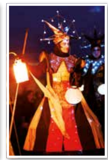
Kreis Unna Seite 19 4. „Nacht der Lichtkunst“