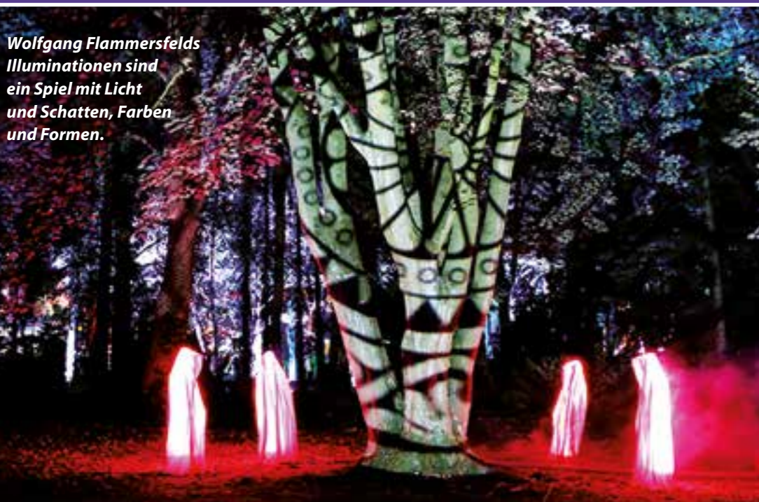
Wolfgang Flammersfelds Illuminationen sind ein Spiel mit Licht und Schatten, Farben und Formen.