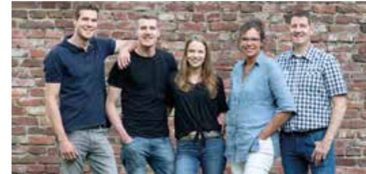
Familie Ligges – hier bekommen Sie auch außerhalb der Öffnungszeiten Kürbisse, Eier und Hof-Spezialitäten.

Es ist wieder so weit! Schon von Weitem leuchten die liebevoll dekorierten Kürbisse am Eingang von Hof Ligges in Kamen-Methler den Besuchern entgegen. Zum Start der Saison können sich kleine und große Kürbisliebhaber wieder mit dem vielseitigen Gemüse eindecken.