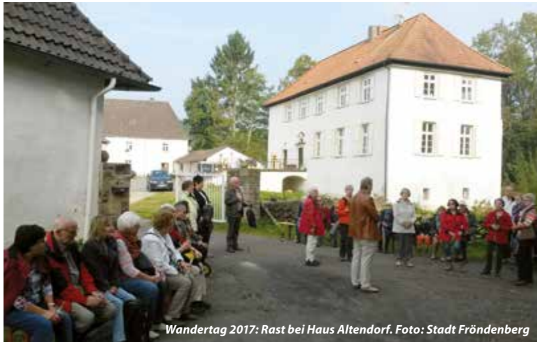
Wandertag 2017: Rast bei Haus Altendorf.

Los geht es am Sonntag, 1. September, mit der 27. Auflage des beliebten SommerSonntags-Konzerts ab 14 Uhr auf dem Marktplatz. Dann zeigen die 16 Fröndenberger Musikgruppen, der Mendener Frauenchor und die Silberlerchen aus Unna wie-