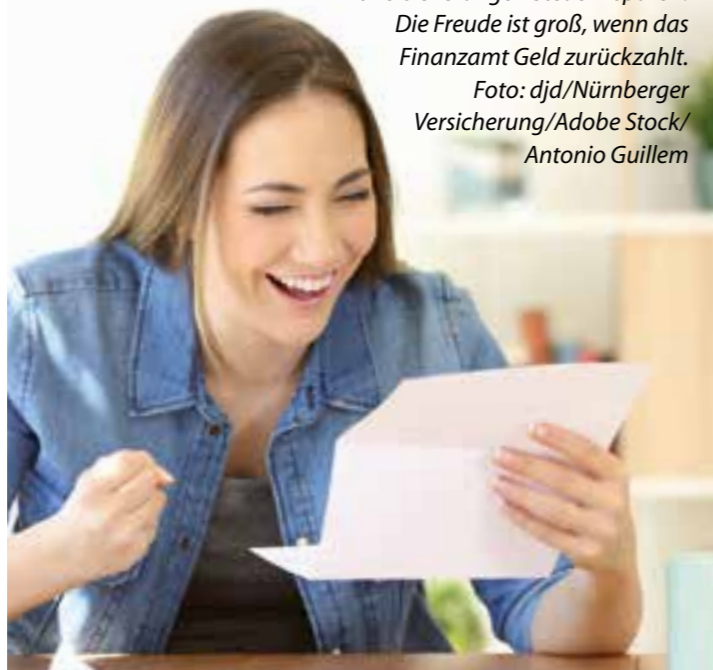
Mit Versicherungen Steuern sparen: Die Freude ist groß, wenn das Finanzamt Geld zurückzahlt.

Es ist eine schöne Stange Geld, die Arbeitnehmer und Selbstständige jährlich durch die Lohn- und Einkommensteuer an Vater Staat zahlen. Da lohnt es schon, wenn man den einen oder anderen Kniff kennt, mit dem sich die Steuerlast reduzieren lässt. Einige Möglichkeiten bieten dabei die Beiträge für bestimmte Versicherungen sowie das Geld, das man in die Altersvorsorge investiert. So können beispielsweise die Kosten für die Privathaftpflicht als Sonderausgaben steuermindernd geltend gemacht werden. Autofahrer und Hundehalter können sich darüber freuen, dass dies auch für die Kfz- und die Hundehalterhaftpflichtversicherung gilt.