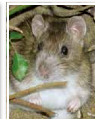
Unna Seite 27 Ratten - niedlich, aber schädlich