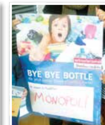
Kamen Seite 36 Bündnis gegen Plastik