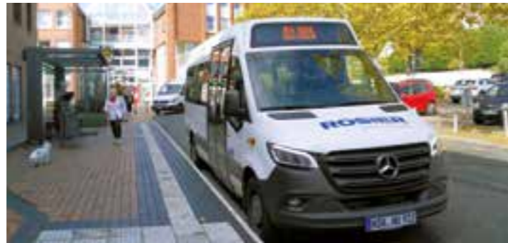
2020 wird der Frönderberger Bürgerbus zum KulturBürgerBus.