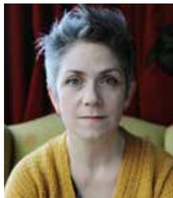
Denise Mina liest bei „Hellweg meets World“.