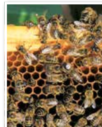
Story des Monats Seite 4 Es summt im Kreis