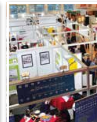
Kamen Seite 10 Messe Planen | Bauen | Wohnen