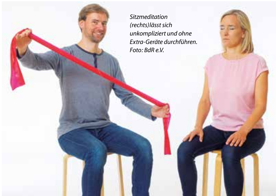
Sitzmeditation (rechts) lässt sich unkompliziert und ohne Extra-Geräte durchführen.

Achtsamkeit im Mittelpunkt des Aktionstages