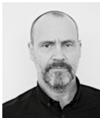
Simon Beckett sorgt für Mordspannung pur.

Mit Jussi Adler-Olsen ist ein Träger des Europäischen Krimipreises erneut bei „Mord am Hellweg“ zu Gast. Er bringt am Dienstag, 13. Oktober, den aktuellen, achten Fall für Carl Mørck mit nach Gelsenkirchen: „OPFER 2117“. Schauspieler Peter Lohmeyer (Das Wunder von Bern) übernimmt wie gewohnt kon-