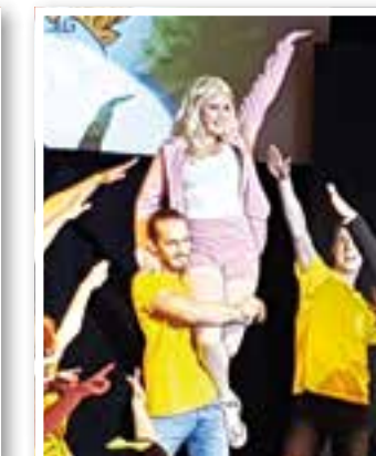
Holzwickede Seite 24 „Vorhang auf, Holzwickede“

Impressum Ortszeit Kreis Unna Herausgeber und Verlag: FKW – Fachverlag für Kommunikation und Werbung GmbH Delecker Weg 33 59519 Möhnesee-Wippringsen Telefon: 02924/87 970-0 Telefax: 02924/87 970-29 E-Mail: info@fkwverlag.com