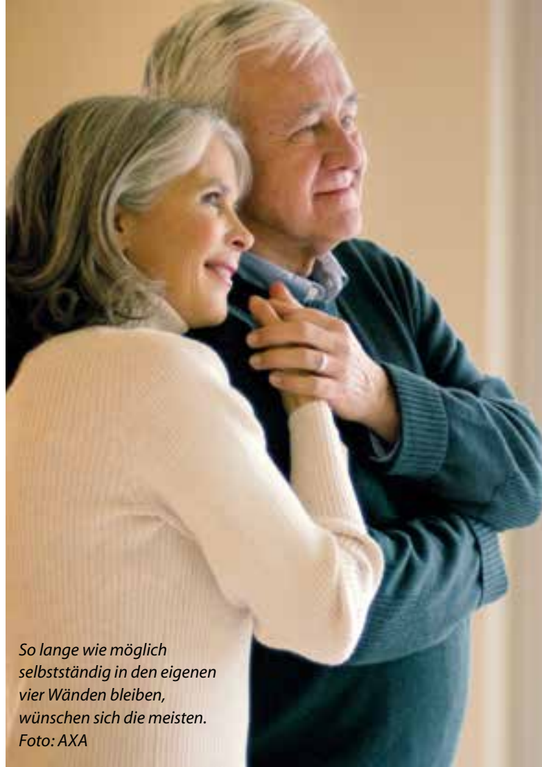
So lange wie möglich selbstständig in den eigenen vier Wänden bleiben, wünschen sich die meisten.

>>> geringe Fläche oft gedrun- gen und dunkel wirken. Als Alternative bietet sich ein grüner Sichtschutz an, etwa mit üppigem Kirschlorbeer, pflegeleichter Thuja oder individuell geplanten Beeten. Bambus und Gräser wachsen schnell und schirmen Blicke gut ab. Hier noch ein Blumenkübel, dort die selbst gezogenen Toma-