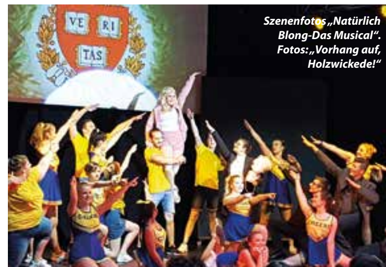
Szenenfotos „Natürlich Blond-Das Musical“.