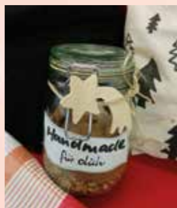
Einmal die umweltfreundliche Verpackung: Stofftaschen und Kekse im Weckglas.

Denn: „Die Fair-Trade-Produkte sind hochwertig, zu einem Großteil bio-zertifiziert, es wird den Arbeitern und Bäuerinnen ein gerechter Lohn gezahlt und somit deren Lebensumstände verbessert.“ Es ist quasi ein kleines Stück Entwicklungshilfe für die Klein-Produzenten in Afrika, Asien oder Süd-