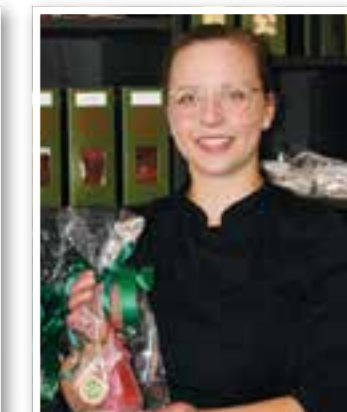
Unna-Massen Seite 24 Die Kuchen-Queen