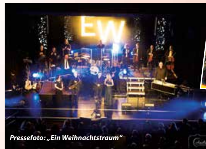
Pressefoto: „Ein Weihnachtstraum“

Das Kinderstück „Pettersson kriegt Weihnachtsbesuch“ ist für Donnerstag, 3. Dezember , um 17 Uhr geplant. Karten kosten zwischen 5 und 8 Euro. Es ist der Tag vor Heilig Abend. Endlich ist es draußen nicht mehr so bitter kalt und Pettersson und Findus gehen, wie jedes Jahr, hinaus in den Wald, um sich ihren Weihnachtsbaum auszusuchen. Dabei geschieht es: Pettersson verstaucht sich den Fuß! Und zwar so schlimm, dass er gar nicht mehr auftreten kann. Und für Weihnachten ist noch nichts vorbereitet-aweia! Doch als die Nachbarn von Petterssons Unglück erfahren, backen und kochen sie, füllen ihre Körbe mit den leckersten Sachen und machen sich auf den Weg zu Pettersson und Findus. Sogar ein Weihnachtsständchen wird geboten.