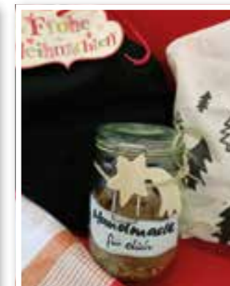
Kamen Seite 10 Nachhaltige Weihnachten