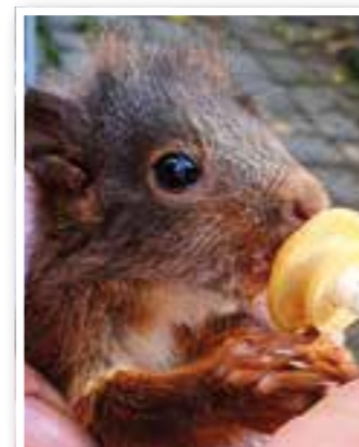
Story des Monats Seite 4 Lokale Hilfsorganisationen