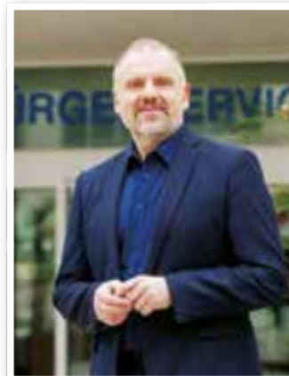
Story des Monats Seite 4 Bürgermeister Dirk Wigant