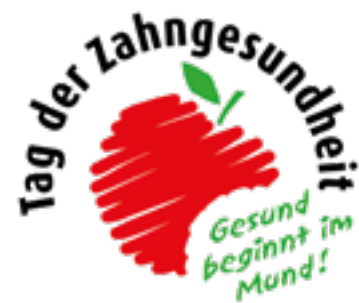
Grafik: Verein für Zahnhygiene

Bessere Therapie Passend zum diesjährigen Mototag gilt übrigens seit dem 1. Juli 2021 eine neue Richtlinie zur Behandlung von Parodontitis, die dem neuesten Stand der Wissenschaft entspricht und erweiterte Therapiemöglichkeiten für gesetzlich Versicherte zulässt. Es sind neue weitere Bausteine