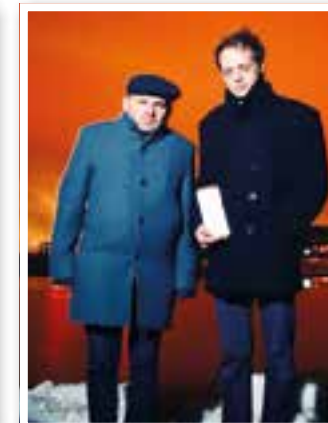
Fröndenberg Seite 8 Kultureller Herbst