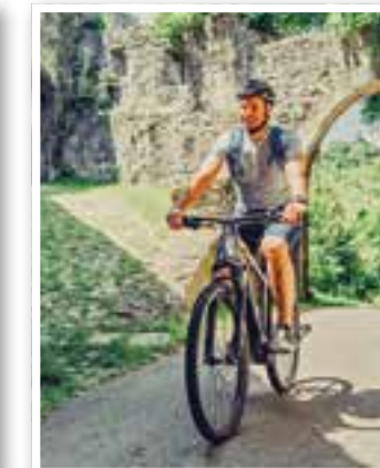
Ab ins Blaue Seite 12 Tipps für den Herbsturlaub

Impressum Ortszeit Kreis Unna Herausgeber und Verlag: FKW – Fachverlag für Kommunikation und Werbung GmbH Delecker Weg 33 59519 Möhnesee-Wippringsen Telefon: 02924/87 970-0 Telefax: 02924/87 970-29 E-Mail: info@fkwverlag.com