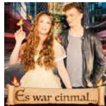
Plakat: „Freie Wildbahn“

Die neue Produktion vom Musical-Projekt „Freie Wildbahn“ – Jugendmusical für Unna. „Es war einmal...“ ist eine turbulente Komödie, märchenhaft, witzig, schillernd und bunt, mit aufwendigen Choreographien und viel Gesang, begleitet von einer Live-Band.