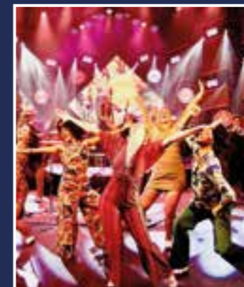
Latin Devils

Die „Latin Devils“ nehmen ihre Zuschauer:innen am 23. März um 20 Uhr mit auf eine Zeitreise von den 1920er-Jahren bis hin zur Gegenwart. „The Story of New York’s Spanish Harlem“ bietet mit Musik, Tanz und einer Multivision mit Bildern aus den verschiedenen Epochen eine Show der Extraklasse. Ein mit allen Grooves gewaschenes Sextett, drei Sänger:innen und zwölf preisgekrönte Tänzer:innen machen diese „hot show of Latin music, song & dance“ zu einem Er-