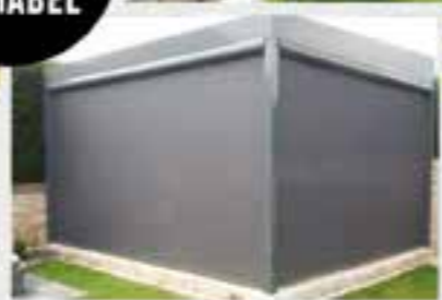
WOHLFÜHLEN ZU JEDER JAHRESZEIT

MASSGESCHNEIDERTE ÜBERDACHUNGEN SO INDIVIDUELL WIE SIE