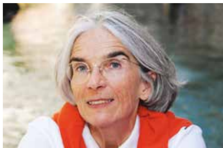
Donna Leon.

Nachdem Europas größtes Krimifestival pandemiebedingt zweimal verschoben werden musste, wird in diesem Jahr gleich doppelt gefeiert: 2002 als Biennale gegründet ist „Mord am Hellweg“ nunmehr 20 Jahre lang für seinen hochkarätig besetzten, achtwöchigen Veranstaltungsreigen bekannt – vom 17. September bis 12. November 2022 feiert es zudem seine zehnte Ausgabe! Die Festivalleitung liegt beim Westfälischen Literaturbüro in Unna e. V. und beim Bereich Kultur der Kreisstadt Unna.