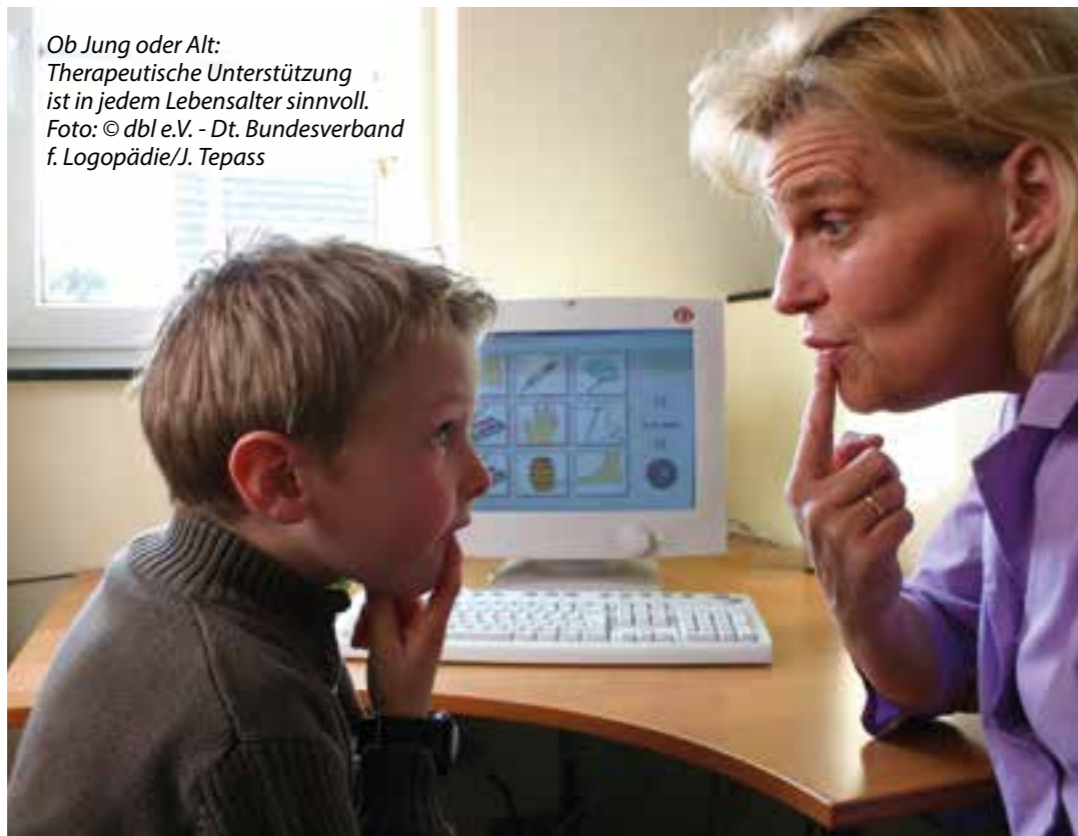
Ob Jung oder Alt: Therapeutische Unterstützung ist in jedem Lebensalter sinnvoll.

In diesem Jahr steht das Motto „Logopädie: Therapie in jedem Lebensalter“ im Mittelpunkt des Europäischen Tages der Logopädie und macht aufmerksam auf