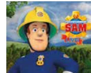
Pressefoto: Feuerwehrmann Sam

natürlich in jenem urtypisch eigenen Stil und markanten Sound von Götz Alsmann gehalten. Karten gibt's zum Preis von 19 bis 26 Euro.